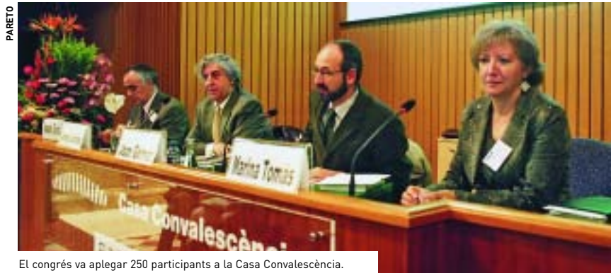
El congrés va aplegar 250 participants a la Casa Convalescència.

La trobada pretenia presentar l'estat actual de la reflexió i les pràctiques vincu-