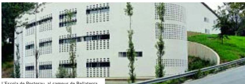
L'Escola de Postgrau, al campus de Bellaterra.

► La font d'ingressos per al curs 2003-2004 són les convocatòries i beques d'organismes públics