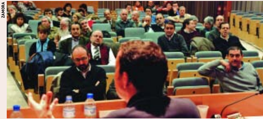
El rector va repassar les actuacions de la UAB l'any 2003 i va presentar les previstes per al 2004.