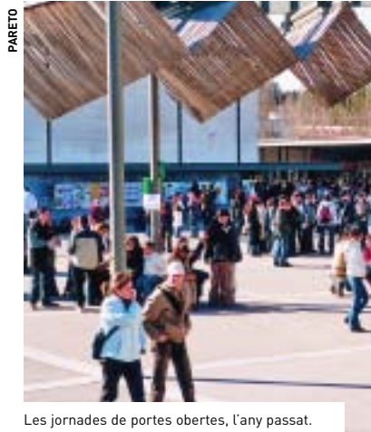
Les jornades de portes obertes, l'any passat.

Per als professors de secundària que acompanyen els seus alumnes també