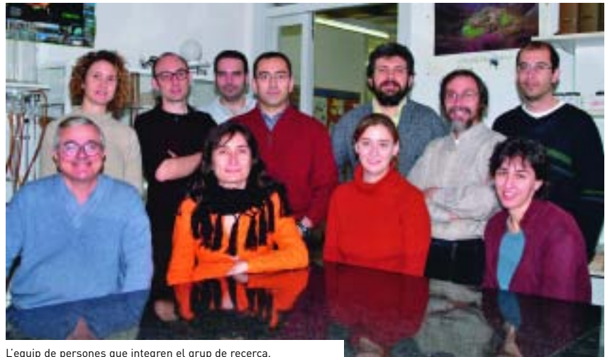
L'equip de persones que integren el grup de recerca.