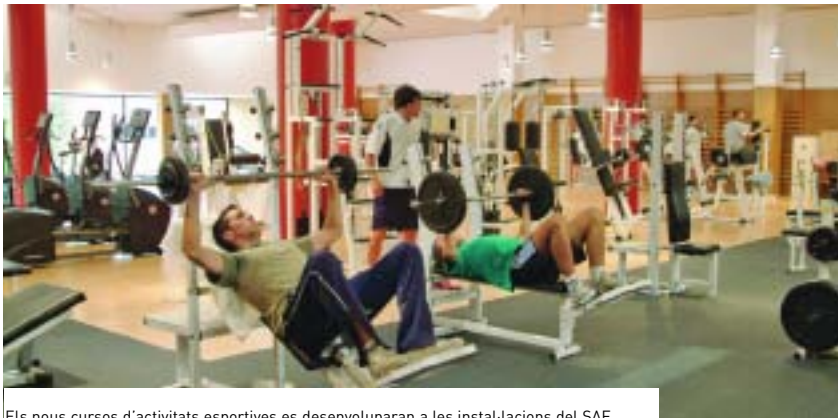
Els nous cursos d'activitats esportives es desenvoluparan a les instal·lacions del SAF.