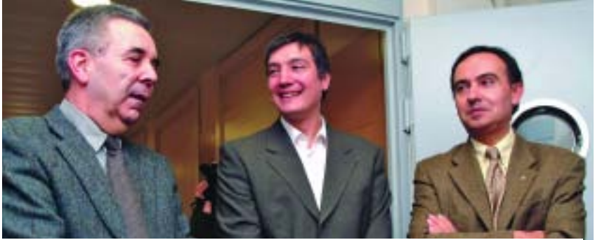
El degà de la Facultat de Ciències, el director de l'ICTA i el vicerector de Projectes Estratègics, en la inauguració.