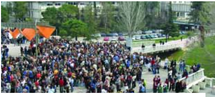
El dia després de la massacre, la plaça Cívica va concentrar la comunitat per mostrar el dol i la indignació.