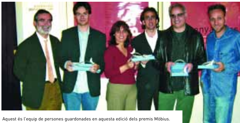
Aquest és l'equip de persones guardonades en aquesta edició dels premis Möbius.