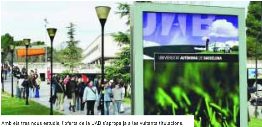
Amb els tres nous estudis, l'oferta de la UAB s'apropa ja a les vuitanta titulacions.