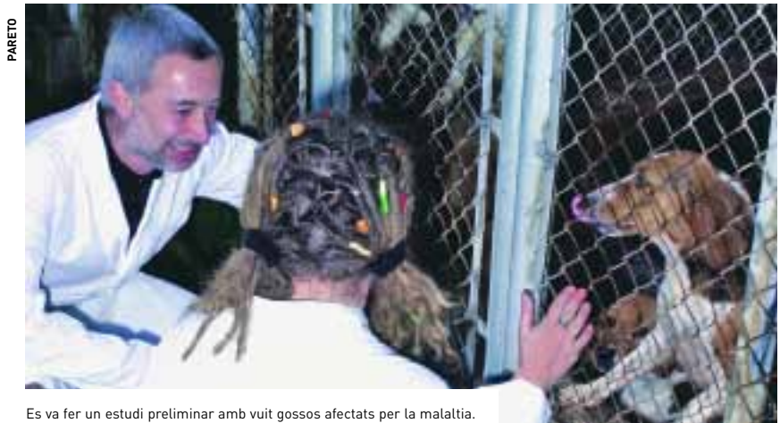
Es va fer un estudi preliminar amb vuit gossos afectats per la malaltia.

Aquest és el primer cop que es demostra que els pèptids antimicrobians són útils per al tractament de malalties parasitàries en situacions clíniques reals. Els investigadors del Centre d'Investiga-