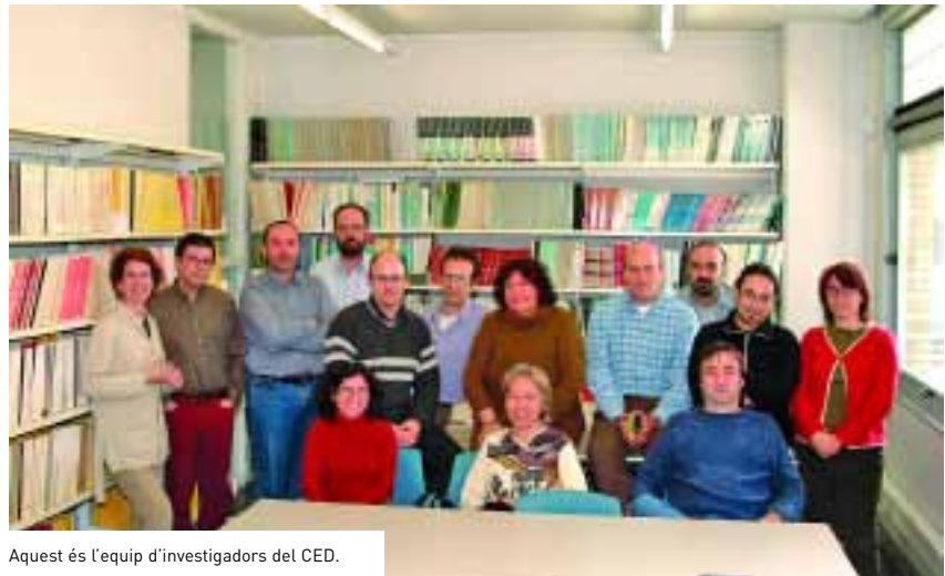
Aquest és l'equip d'investigadors del CED.

biblioteca i un centre de documentació especialitzats, en els quals es reuneix i es posa a l'abast de la comunitat científica la major part de les estadístiques catalanes i espanyoles (des de 1787), i una extensa bibliografia sobre demografia catalana, espanyola i europea.