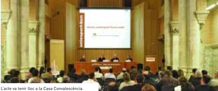
L'acte va tenir lloc a la Casa Convalescència.