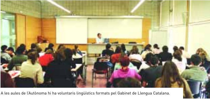
A les aules de l'Autònoma hi ha voluntaris lingüístics formats pel Gabinet de Llengua Catalana.

➤ El curs que organitza cada any el Gabinet de Llengua Catalana ha arribat a la setena edició