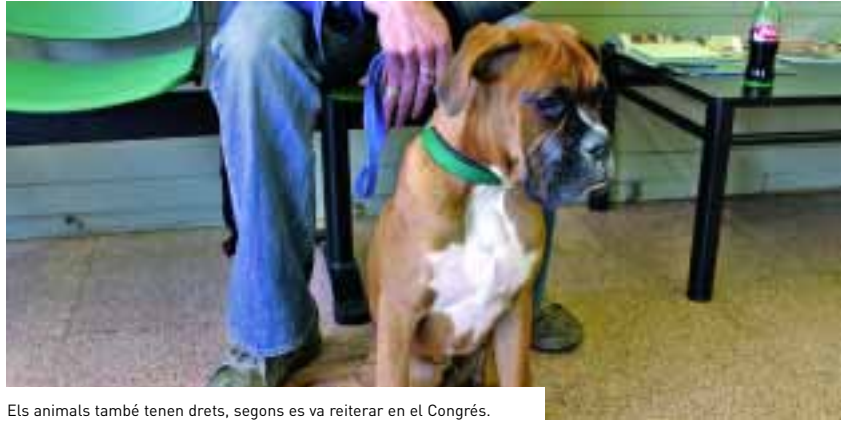
Els animals també tenen drets, segons es va reiterar en el Congrés.

En aquest primer Congrés sobre els Drets dels Animals es va tractar la reforma del codi penal, que suposa l'acceptació del nou delictes de maltractament d'animals, es va fer una anàlisi comparativa de la normativa local, autonòmica, estatal i europea, i de la Llei de conservació de la fauna silvestre als parcs zoològics.