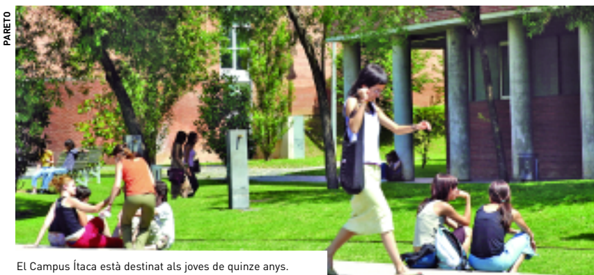
El Campus Ítaca està destinat als joves de quinze anys.