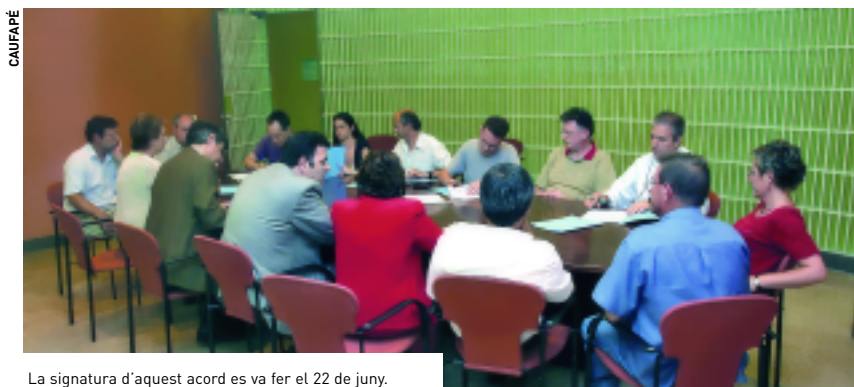
La signatura d'aquest acord es va fer el 22 de juny.

➤ Tots aquests acords seran vigents durant el període que va de l'any 2004 al 2007