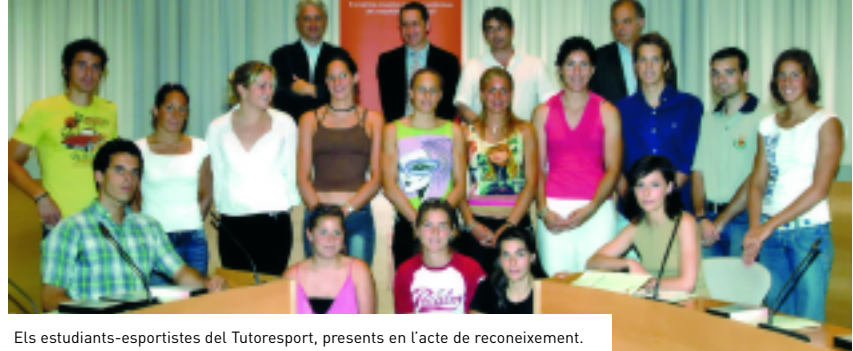
Els estudiants-esportistes del TutorSPORT, presents en l'acte de reconeixement.

En el decurs de l'acte es va anunciar que, a partir del curs 2004-2005, es reconixerà en forma de cinc crèdits de lliure elecció per curs la tasca desenvolupada fora de les aules pels esportistes d'alt nivell matriculats a la UAB, amb independència de si l'esportista aconsegueix o no un lloc destacat en les competicions en les quals participi.