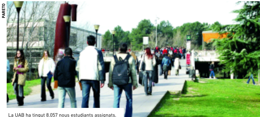
La UAB ha tingut 8.057 nous estudiants assignats.