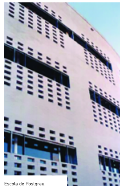
Escola de Postgrau.

Els estudis de tercer cicle i de formació continuada són, juntament amb la recerca, un element estratègic i diferenciador de la UAB. En els últims anys, i amb la creació de l'Escola de Postgrau, s'ha assolit un ràpid desenvolupament, tant pel que fa a infraestructures com en el nombre de programes.