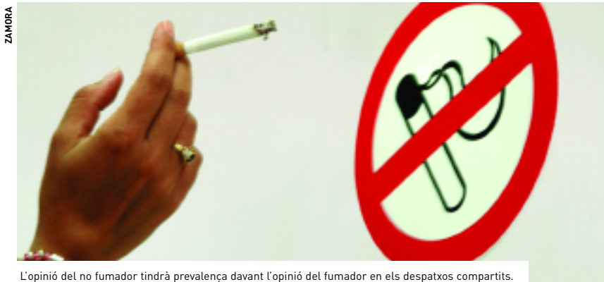
L'opinió del no fumador tindrà prevalença davant l'opinió del fumador en els despatxos compartits.

➤ No es podrà fumar a les aules, les biblioteques, els laboratoris i les zones d'atenció al públic