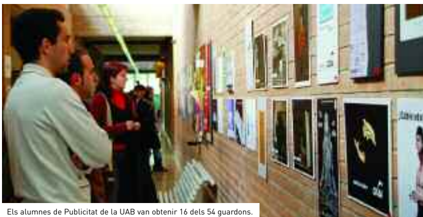
Els alumnes de Publicitat de la UAB van obtenir 16 dels 54 guardons.

La UAB, que va acollir per primer cop el certamen coincidint amb el 80è aniversari de l'Associació Empresarial Catalana de Publicitat, no només va fer de seu dels premis sinó que va voler fer dels Drac un festival fet per estudiants i no només «per a estudiants». Més de setanta estudiants de cinc llicenciatures diferents van treballar en diferents aspectes de l'organització: estudiants de publicitat –coordinats per l'Associació Catalana d'Estudiants de Publicitat (Puarkhé)–, de periodisme, de comunicació audiovisual, de documentació i de traducció i interpretació.