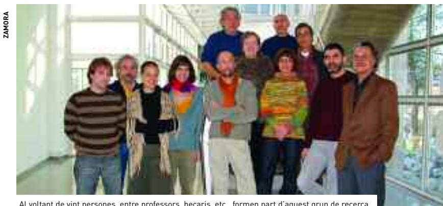
Al voltant de vint persones, entre professors, becaris, etc., formen part d'aquest grup de recerca.