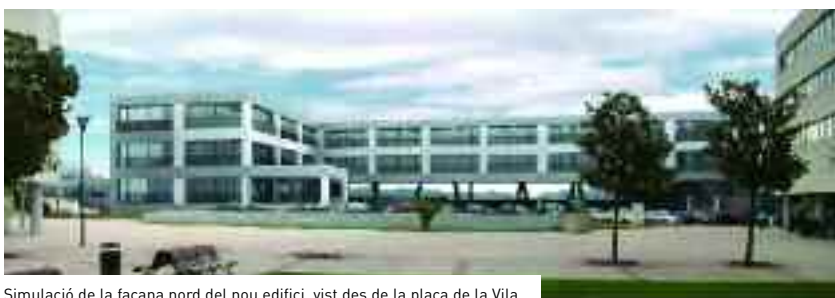
Simulació de la façana nord del nou edifici, vist des de la plaça de la Vila.