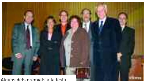
Alguns dels premiats a la festa.