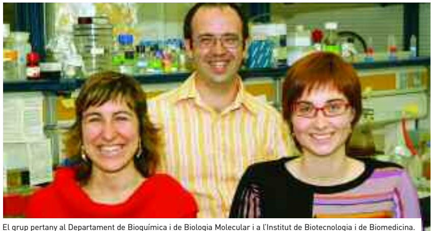
El grup pertany al Departament de Bioquímica i de Biologia Molecular i a l'Institut de Biotecnologia i de Biomedicina.

identificar els segments concrets de cada proteïna que, quan entren en contacte amb d'altres, forcen el rebregament i la formació d'agregats i de fibres amiloides. El grup ha comprovat el mètode amb diferents proteïnes implicades en malalties conformacionals identificant segments que ja eren coneguts pel seu paper en l'agregació de proteïnes en les malalties esmentades. Aquest mètode obre les portes al disseny de nous fàrmacs adreçats a bloquejar aquestes zones i a estabilitzar les molècules perquè no formin els agregats.