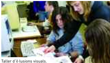
Taller d'il·lusions visuals.