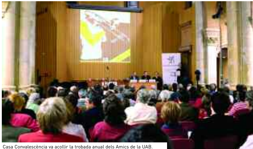
Casa Convalescència va acollir la trobada anual dels Amics de la UAB.