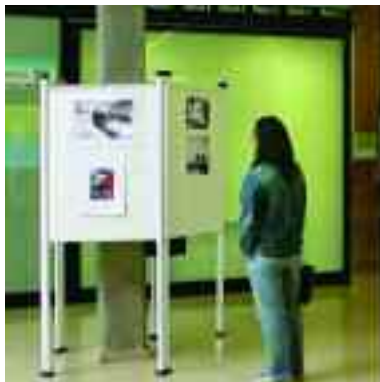
Exposició «Mitjans i imatges», a la Facultat de Ciències de la Comunicació.