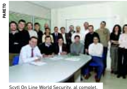
Scytl On Line World Security, al complet.

Els productes de l'empresa pretenen traslladar a l'activitat que es desenvolupa en línia les mesures de seguretat que existeixen en el món real. Ofereix una gamma de productes tant per al sector públic com per al sector privat, per utilitzar, per exemple, en les juntes generals d'accionistes o en les eleccions sindicals. Scytl va participar activament en