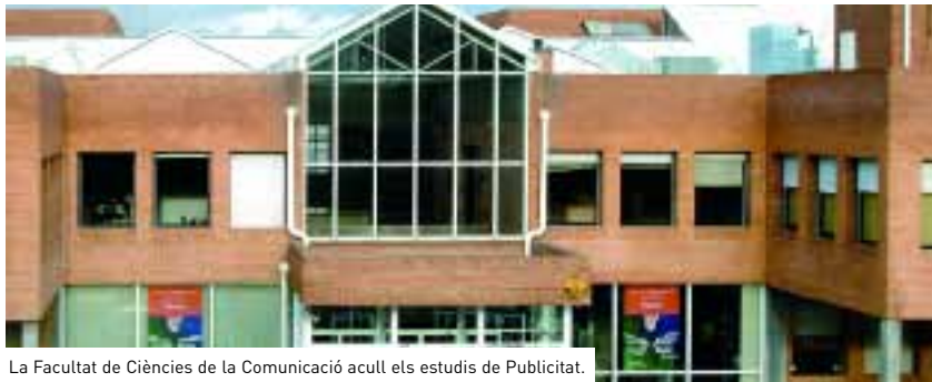
La Facultat de Ciències de la Comunicació acull els estudis de Publicitat.

➤ Els guardons als estudiants de publicitat constaten un any més el bon nivell de la UAB