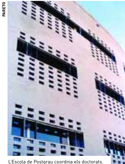
L'Escola de Postgrau coordina els doctorats.

La certificació és un procés d'avaluació externa, realitzada per l'Agència Nacional de Evaluación de la Calidad y Acreditación (ANECA), i sol·licitada, de manera voluntària, per cada programa de doctorat que s'ha d'avaluar. Aquesta avaluació comprova el nivell científic i