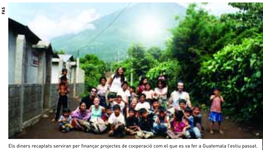
Els diners recaptats serviran per finançar projectes de cooperació com el que es va fer a Guatemala l'estiu passat.

La UAB realitza anualment una campanya de sensibilització animant els estudiants a aportar 12 euros en el moment de fer la seva matrícula. Enguany, tant la campanya de promoció com la col·laboració entre diversos departaments de la Universitat per tal d'agilitar els tràmits de selecció de la casella de la solidaritat en línia han permès d'arribar als 32.904 euros, xifra que augmentarà, ja que la matrícula continua oberta per als estu-