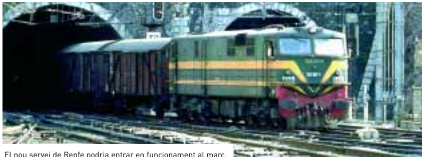
El nou servei de Renfe podria entrar en funcionament al març.

► La infraestructura permetria arribar al campus amb tren sense haver d'anar a Barcelona