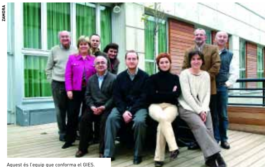
Aquest és l'equip que conforma el GIES.

La metodologia de recerca preveu el treball interdisciplinari i la combinació d'estudis experimentals de laboratori amb estudis observacionals de camp. Així, els principals camps de treball són el dolor crònic, la psicooncologia, les cures pal·liatives per a malalts termi-