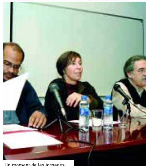
Un moment de les jornades.

El procés de debat acabarà amb una jornada final oberta a tota la comunitat universitària, que tindrà lloc els dies 5 i 6 de maig de 2005.