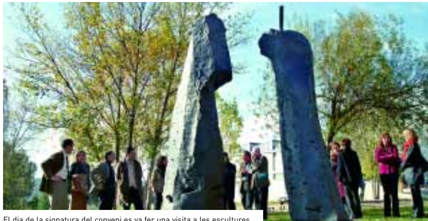
El dia de la signatura del conveni es va fer una visita a les escultures.

Segons l'acord, el Macba cedeix temporalment a la UAB, per un període de cinc anys, renovable, tres escultures pertanyents a la seva col·lecció. Els responsables de d'ambdues entitats han escollit, de comú acord, tres obres i les seves ubicacions. Així, davant de la Biblioteca i Hemeroteca General s'ha ubicat Solar 1 (1994), de Pablo Palazuelo, escultor que ha rebut el premi Velázquez de les Arts Plàstiques 2004; a la zona de la Facultat