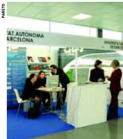
Biospain és la Fira Internacional de Biotecnologia.

L'activitat de recerca, docència i serveis de la Universitat Autònoma de Barcelona i del conjunt de l'Esfera UAB, relacionada amb la biotecnologia i la biomedicina, es va representar a la fira Biospain 2004, que va tenir lloc entre els dies 29 i 30 de novembre a Barcelona.