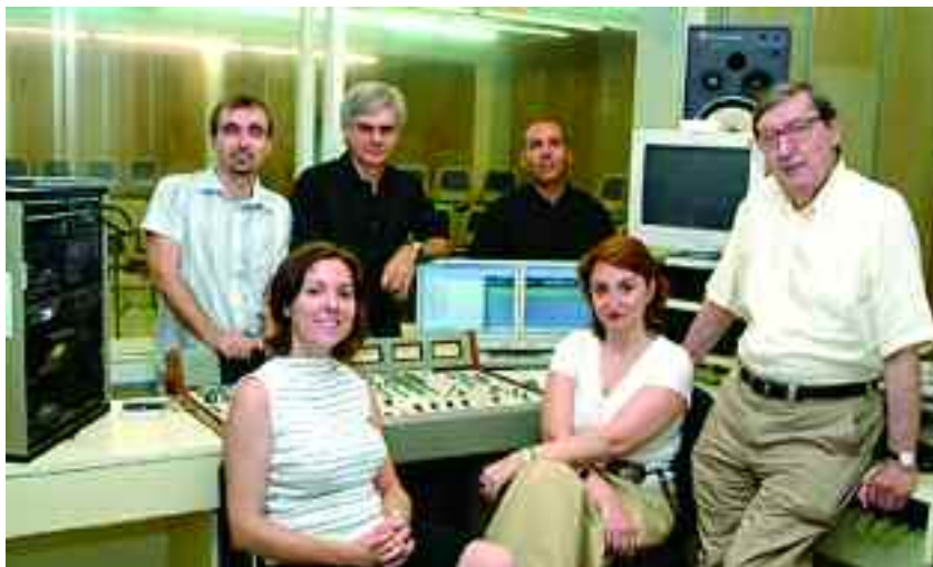
El grup vol impulsar i estimular la innovació en aquest mitjà.