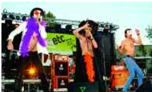
El grup Sidonie, durant diferents moments de la seva actuació.