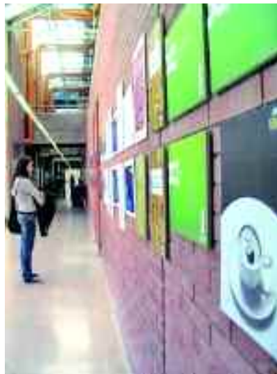
Els estudiants de la UAB van rebre dinou guardons.

El centre més premiat ha estat l'Escola de Creatius Complot, ubicada a Barcelona, que ha aconseguit nou Dracs i set diplomes d'honor. La segueixen, de molt a prop, la Universitat Autònoma de Barcelona, amb vuit Dracs i onze diplo-