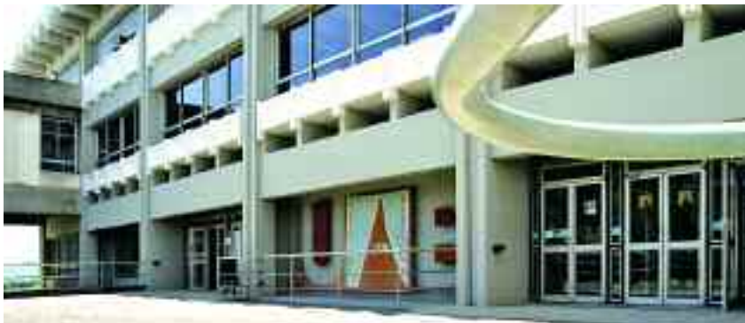
Els estudiants que van votar van ser 2.069. A la Facultat de Medicina, a la foto, és on hi va haver més participació.

➤ La participació va ser del 6,69 %, mentre que als comicis passats va ser del 2,85 %