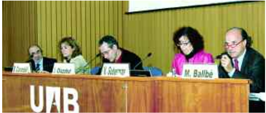
Les Jornades van reunir juristes, investigadors i treballadors socials de primer nivell de Catalunya i del Quebec.

Segons els organitzadors d'aquestes primeres Jornades, l'experiència del Quebec en l'atenció a les persones grans pot ser de gran utilitat per a la implantació del sistema públic d'atenció domiciliària a Catalunya, arran de la nova Llei de dependència aprovada pel Parlament espanyol. En aquest sentit, les Jornades van suposar un intercanvi de coneixements i d'opinions, des del punt de vista de la pràctica i de la investigació cana-