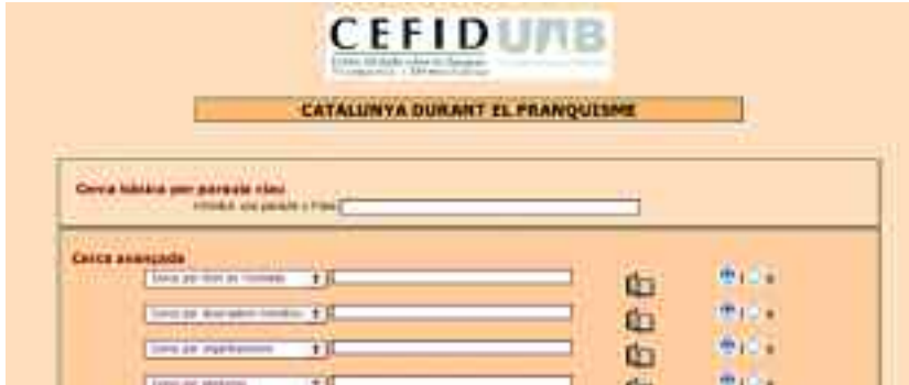
La base de dades conté més de mig miler de registres relacionats amb el període franquista a Catalunya.

➤ Més d'un centenar d'especialistes, coordinats pel CEFID, han elaborat aquesta eina de consulta