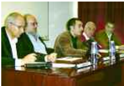
Ponents de la taula rodona del 29 de novembre.

Durant aquestes darreres setmanes, han continuat les activitats de l'Any de l'Evolució de la Universitat Autònoma de Barcelona. El 14 de novembre, va tenir lloc a la Facultat de Traducció i d'Interpretació la primera taula rodona del cicle, titulada «Darwin: la primera