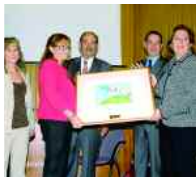
Els membres del SAS recollint el premi.