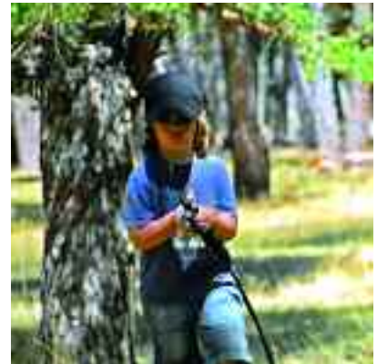
Molts problemes psicopatològics s'inicien als tres anys.

L'estudi consta de diferents treballs de camp que aborden el tema dels trastorns psicopatològics en preescolars des de diversos punts de vista: el diferent desenvolupament d'aquests trastorns entre els nens que viuen en un entorn urbà i els que viuen en un entorn rural, l'aparició de símptomes somàtics, el desenvolupament de trastorns de l'alimentació a causa de factors psicosocials, la diferència entre pares i mestres en la detecció de símptomes depressius, etc.