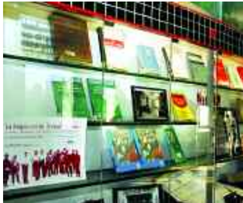
La mostra de material s'ha instal·lat al vestíbul de la Facultat.

La conferència inaugural, «Cent anys de la Inspecció de Treball», a càrrec d'Elisenda Giral, cap de la Inspecció de