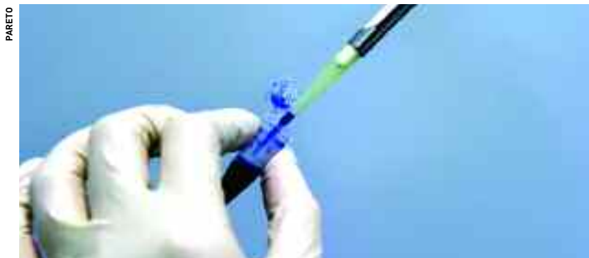
La major part dels investigadors de l'ICREA treballen en les àrees de les ciències experimentals i ciències de la vida.

Amb un pressupost per a l'exercici de 2005 de 8.621.000 euros, l'objectiu principal de l'ICREA és obrir noves línies d'investigació i reforçar els grups de recerca a Catalunya que configuren el Sistema Català d'Investigació i d'Innovació. Del volum d'investigadors contractats per l'ICREA, la majoria treballen en les