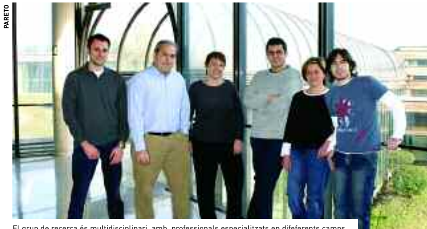
El grup de recerca és multidisciplinari, amb professionals especialitzats en diferents camps.