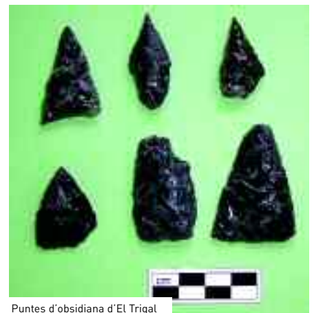
Puntes d'obsidiana d'El Trigal

ficis eren destinats al treball centralitzat, i no a servir com a llocs cerimonials en contra del que s'havia pensat al principi. D'aquesta manera, els investigadors han pogut evidenciar un ampli nombre de tasques de processament agrícola i de treballs artesanals.