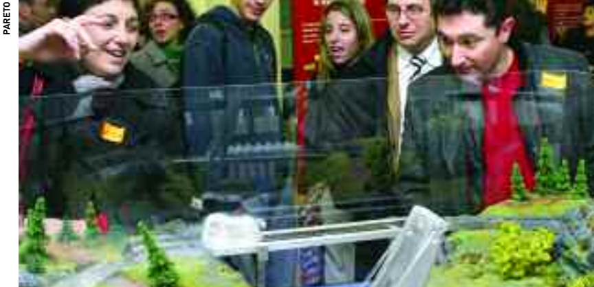
Es van poder veure trens d'alta velocitat de levitació magnètica que «floten» sobre els rails sense cap fregament.

➤ La Facultat de Ciències va acollir aquesta exposició, organitzada per diverses institucions europees