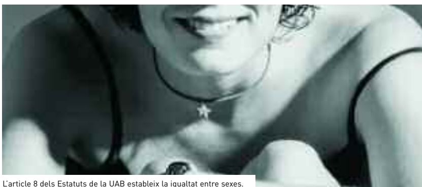
L'article 8 dels Estatuts de la UAB estableix la igualtat entre sexes.