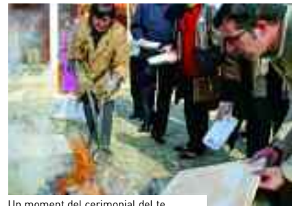
Un moment del cerimonial del te.

Facultat de Ciències de l'Educació es va convertir en l'escenari perfecte per aprendre el cerimonial del te verd, iniciar-se en el tai-txi, contemplar una exhibició de taekwondo, practicar la cal·ligrafia xinesa i coreana, o bé gaudir d'un massatge xinès. L'activitat va coincidir amb les Jornades de Portes Obertes de la UAB, la qual cosa va permetre que professors i alumnes de secundària prenguessin contacte amb el món oriental.