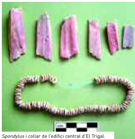
Spondylus i collar de l'edifici central d'El Trigal.

Els científics han documentat l'existència d'un nou tipus d'edifici singular, desconegut fins ara. Es tracta d'un conjunt de patis, construïts amb murs de pedra, situat al centre de l'àrea urbana. L'excavació d'un sector d'un d'aquests edificis, al cim del jaciment conegut per El Trigal, ha mostrat que els edi-