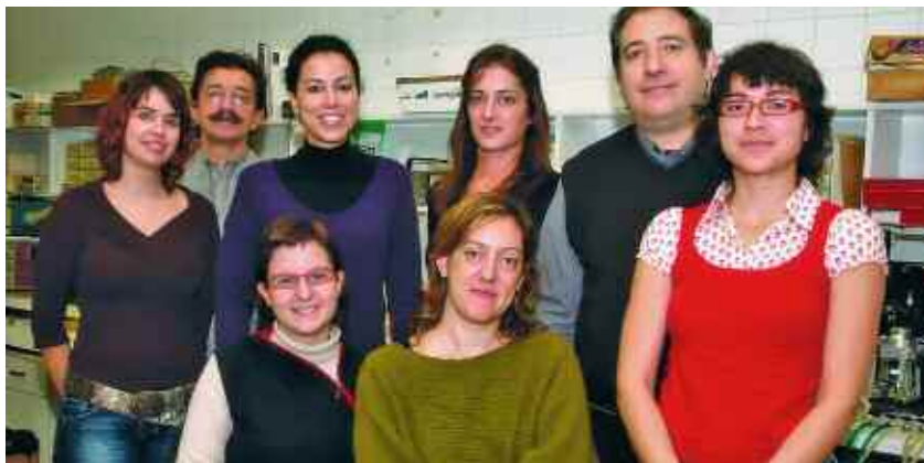
El Grup, ubicat a la Facultat de Medicina, està integrat per especialistes en diverses àrees de la neurobiologia.

Set grans línies serveixen de base per a la recerca que porten a terme els investigadors d'aquest grup: l'estudi dels mecanismes bàsics de les alteracions funcionals i morfològiques en neuropaties perifèriques, en humans i en models experimentals; l'estudi dels fenòmens de regeneració i de reinnervació en el sistema nerviós perifèric lesionat; la reparació per tubulització i desenvolupament d'empelts nerviosos artificials;