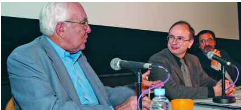
El premi vol fomentar la creació d'aquesta modalitat, en la qual es reflexiona a través de la imatge i del so.

➤ En la primera edició, l'any passat, es van rebre més de 40 pel·lícules de set nacionalitats diferents