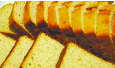
Aquest nou pa s'assembla més al pa de farina de blat.