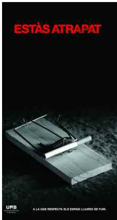
El disseny dels pòsters busca conscienciar.

La UAB ha posat en marxa una campanya informativa sobre el tabac amb un doble objectiu. D'una banda, recordar als membres de la comunitat universitària la necessitat de respectar els espais lliures de fum que hi ha a la Universitat (s'ha detectat la dificultat de respectar la norma aprovada pel Ministeri de Sanitat ara fa un any). D'altra banda, també es vol conscienciar sobre els efectes danyins en la salut que provoca el tabac. Tot i això, una enquesta del Centre Superior d'Investigacions Científiques ha detectat que el nombre de fumadors joves (entre 18 i 34 anys) ha disminuït en més de set punts el darrer any. Als centres docents i també als serveis d'ús comú, com restaurants, biblioteques, etc., s'han distribuït uns pòsters que busquen alertar i cridar l'atenció sobre aquest tema.