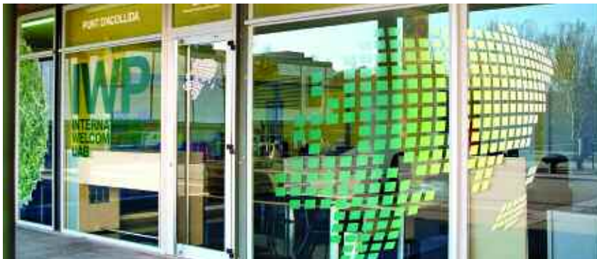
La nova oficina es troba ubicada al bell mig de la plaça Cívica, just al costat del Punt d'Informació general de la UAB.

➤ Des de l'IWP es podrà tramitar la documentació legal, obtenir el carnet UAB o rebre informació