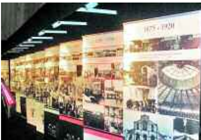
La mostra fotogràfica, a la Facultat de Veterinària.

La Facultat de Veterinària ha acollit, els mesos de desembre i gener, l'exposició fotogràfica «II segles d'universitat i empresa del món agroalimentari a Espanya», que ha palesat la influència del progrés científic i del desenvolupament econòmic en l'alimentació al llarg