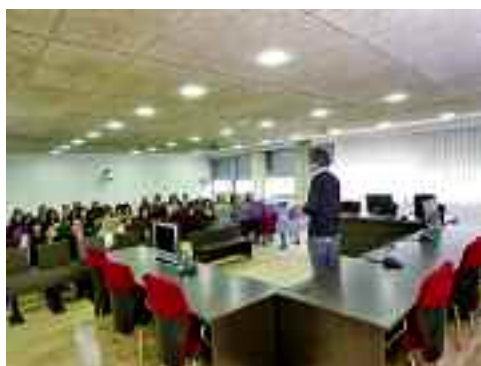
Un moment de la visita a la Facultat de Dret.