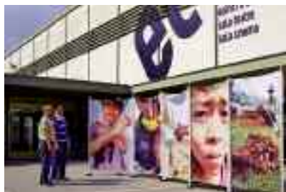
La campanya va portar una exposició a la plaça Cívica.

Paral·lelament, entre el dilluns 20 i el dimecres 22 d'abril, la plaça Cívica va acollir una exposició de fotografies, procedent d'Oslo i relacionada amb la conferència anterior, que forma part de la campanya sobre les bombes de dispersió duta a terme l'any passat.