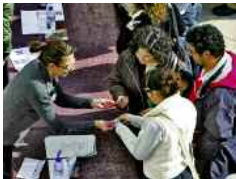
Les famílies s'acreditaven en arribar a la Universitat.