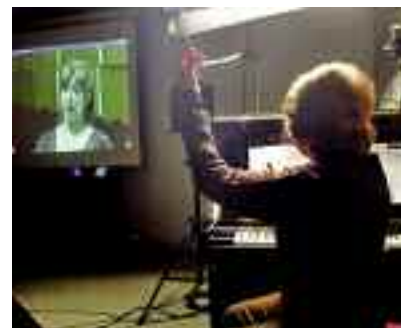
El seminari es va centrar en el lied alemany.

El seminari, centrat en la interpretació del lied alemany, consisteix a connectar una sala de l'Escola Universitària d'Informàtica de Sabadell amb l'edifici Pakhuis de Zwijger d'Amsterdam, als Països Bai-