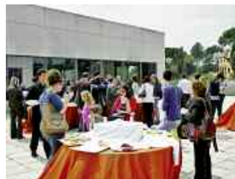
La jornada va acabar amb un refrigeri a l'Hotel SERHS Campus.

➤ Prop d'un centenar de persones han vingut de poblacions de fora de Catalunya