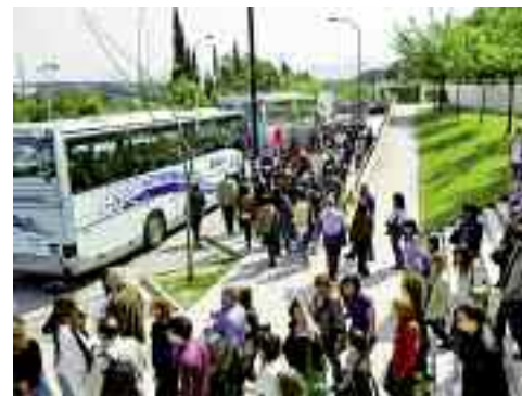
Els visitants van fer una volta pel campus amb autocar.