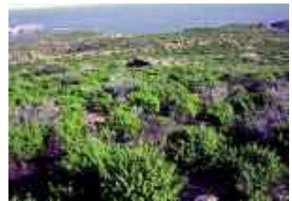
Diverses espècies arbustives estan en perill.