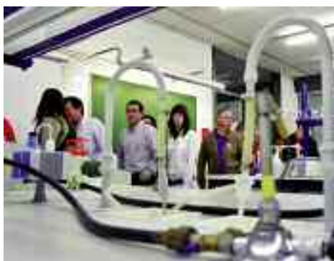
Les noves carreres de biociències van aixecar expectació.