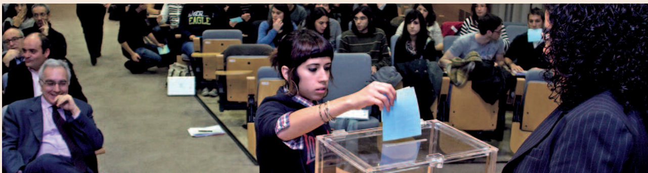
Durant el Claustre es van votar diferents mocions presentades per claustrals.