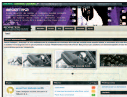
Una pantalla d'aquesta xarxa social.

Les xarxes socials a Internet, com ara Facebook, Twitter, Myspace, Orkut i Hi5, entre altres iniciatives, han transformat les formes de comunicació i transmissió d'informació en temps real i permeten que qualsevol persona amb un ordina-