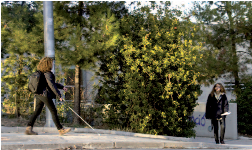
El Pla ha analitzat les pràctiques d'inclusió d'altres universitats europees per tal d'incorporar-les a la UAB.