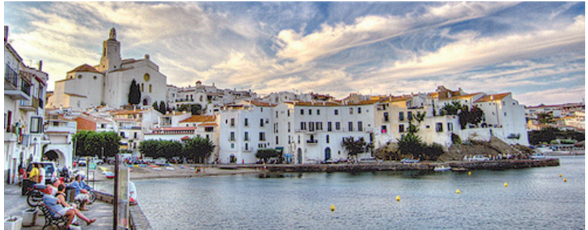
Cadaqués, a la Costa Brava, un dels indrets catalans que atrauen turistes de tot el món.

L'activitat turística creixerà un 1,9 %. Segons les previsions de la UAB, el nombre