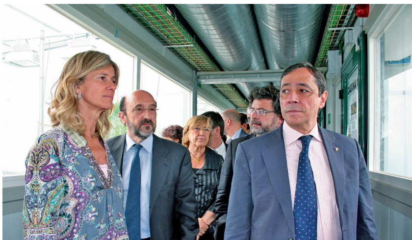
Les autoritats presents en la inauguració, amb la ministra al capdavant, van recórrer les instal·lacions del CRAG.

L'edifici nou, una construcció de 9.000 metres quadrats distribuïts en quatre plantes, ha suposat una inversió d'uns 20 milions d'euros, aportats en parts molt semblants pel CSIC i per la Direcció General de Recerca de la Generalitat de Catalunya. La participació de fons europeus és de gairebé un 50 % en tots dos casos. La UAB hi ha cedit els terrenys.