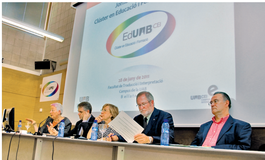
Els objectius i les actuacions principals del Clúster es van presentar a la Jornada d'R+D+i.

➤ Més de quaranta grups de recerca han contribuït a definir-lo i hi han aportat 155 actuacions concretes