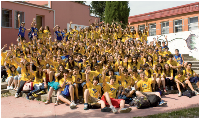
Els participants es van repartir en tres torns de 144 alumnes que feien estades de dues setmanes cadascun.