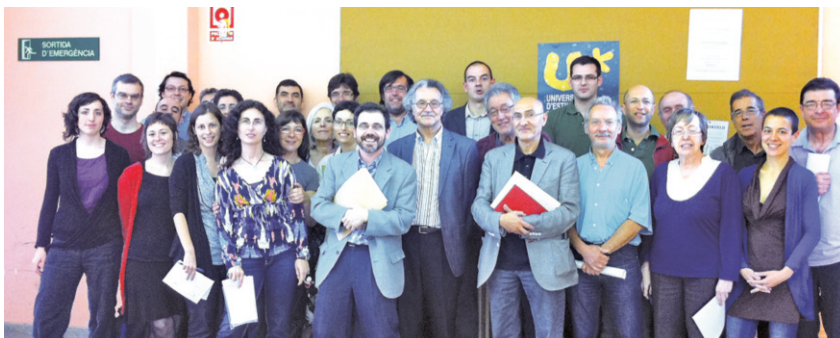
Els membres del Consell de l'Institut d'Estudis del Treball.

➤ Aquest centre realitzarà activitats de recerca sobre l'àmbit del treball i la vida quotidiana