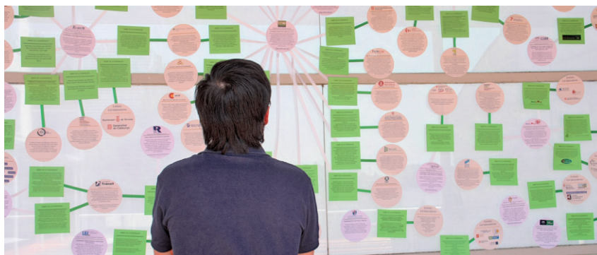
A la jornada de presentació s'hi va poder veure una exposició sobre la xarxa vinculada al projecte.

Els objectius i les actuacions principals del clúster es van presentar, el dia 28 de juny, a la Jornada d'R+D+i del Clúster d'Educació i Formació de la UAB, que va tenir lloc a la Facultat de Traducció i d'Interpretació, en el marc de les actuacions del Campus d'Excel·lència Internacional UAB-CEI. La jornada va ser un espai de trobada dels grups de recerca de la UAB que treballen amb agents externs a l'àmbit de l'educació i la formació per tal d'impulsar la reflexió sobre les relacions entre aquests dos col·lectius.