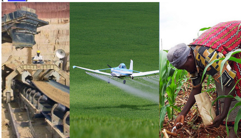
El trilema del fósforo