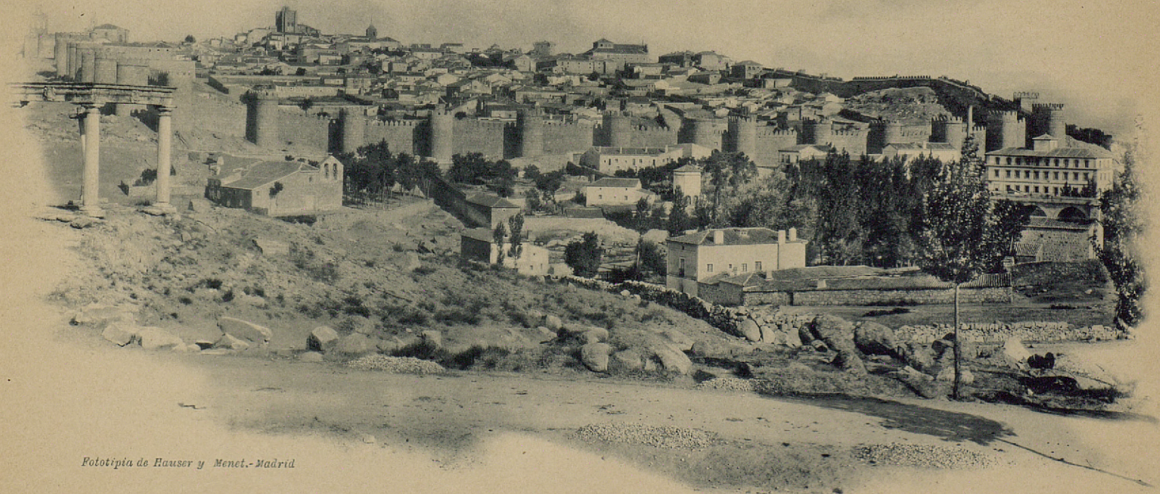
Fototipia de Hauser y Menet.-Madrid