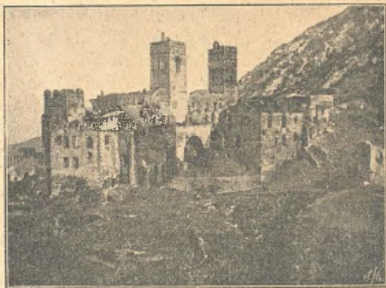
Sant Pere de Roda. Vista presa del camí de Vilajuïga.

A poch més enllà queda a la nostra esquerra una capelleta romànica, sòlida, extremadament senzilla, ab son àbsit circular, y sobre de la porta la lladronera. És la capella