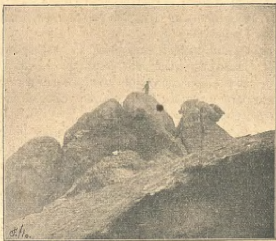
Tudela (roques de Cap de Creus)

Semblant explicació fàcil y natural trobariem a les faules de l'antiguitat, si poguessim remontarnos a n'aquells temps en que afirmaven la sonoritat de les muralles de Tebes, les armonies de les harpes eòliques y els cants mis-