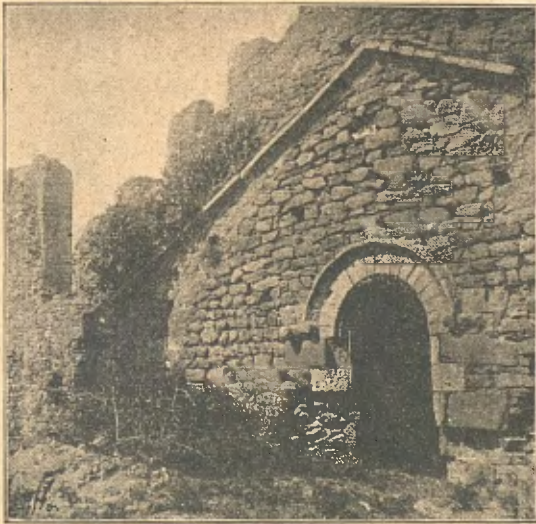
Finestra de la façada de Sant Pere de Roda

dir després de lo que han escrit Piferrer y Pi y Margall, reproduït més tart en l'obra España , anotada per Aulestia, y en l' Historia del Ampurdán , de Pella y Forgas. La vista, quan fuig desconsolada del pedregam que ompla tots els departaments que formaven el complicat conjunt del monestir, ahont sols després de molt estudi arribaria a desxifrar-se'l plan y objecte de tant vastes construccions; a l'apartarse ab tristesa y quasi ab temor de les parets des-