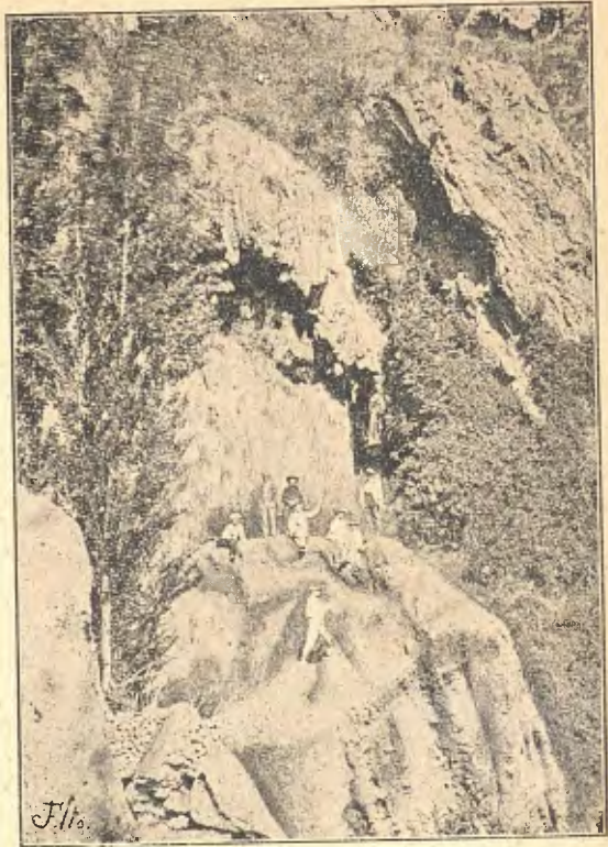
Lo dossier de Valderrós

—Mireu, mireu quin sostre més bonich,—diguí als companys, ja ab segona intenció.