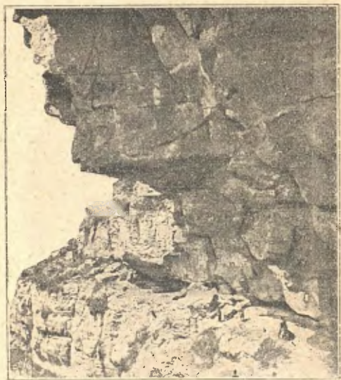
Singles de Bertí

D'allí marxàrem directament cap a Can Casals , en qual casa'm contà en Francisquet que temps enrera'ls follets