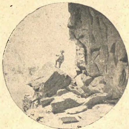
En un relleix dels singles

promès, no tingué més remey que dirli, d'una manera que's coneixia a la llegua que era per força, si volia pujar; però, què va dir? Tots quatre, sense esperar més cerimònies, ens llençarem escala amunt, desitjosos de profanar aquell Sancta Sanctorum . L'excusa havia sigut mirar l'enquixat del sostre, però ab prou feines si'ns hi fixàrem, perquè no tenia gaire importancia: les nostres mirades se dirigien a tots els recons de la sala pera observar els objectes. En una paret hi havia un gros quadro del qual no's