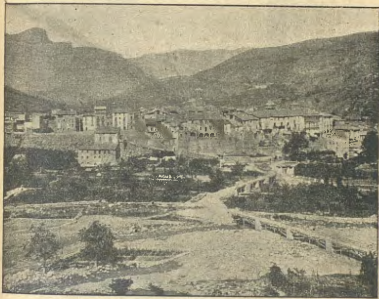
Pobla de Segor: Vista general

gressos. A més d'aquest, se'n cobren dos més: lo del Noguera y un altre sobre'l mateix Flamisell, en lo camí de la montanya; y per l'únich punt que no's passava cap riu, fins ara, com veurem més endavant, ha cobrat una casa particular lo pas de l'estret de Collegats; de manera que era una de les poques poblacions de Catalunya, potser l'única, que no s'hi podia entrar sense afluixar la mosca.