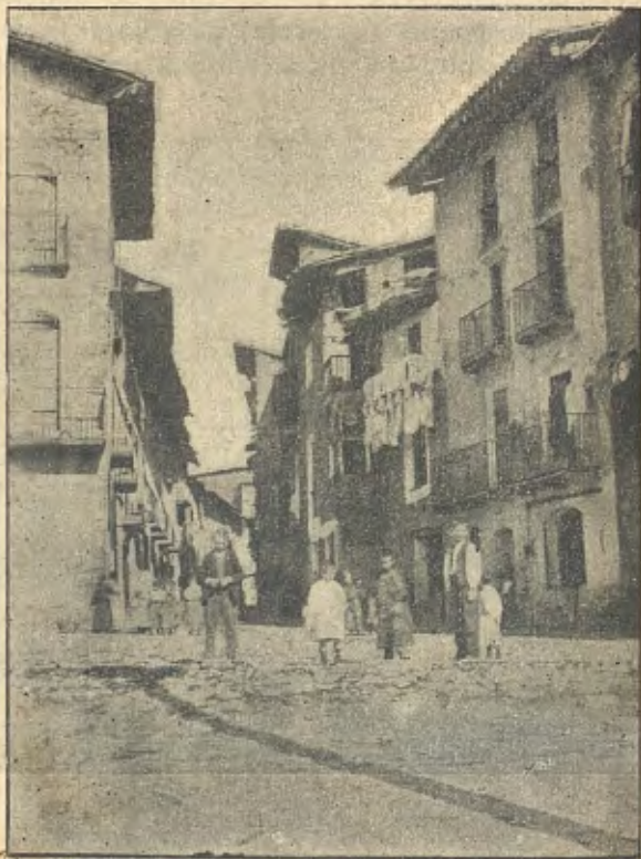
Pobla de Segur : Carrer Major

La Pobla de Segur s'aixeca a 525 metres sobre'l nivell del mar, de cara a mig-dia, a l'extrem del pla que forma'l centre de la comarca y al peu de la montanya de Sant