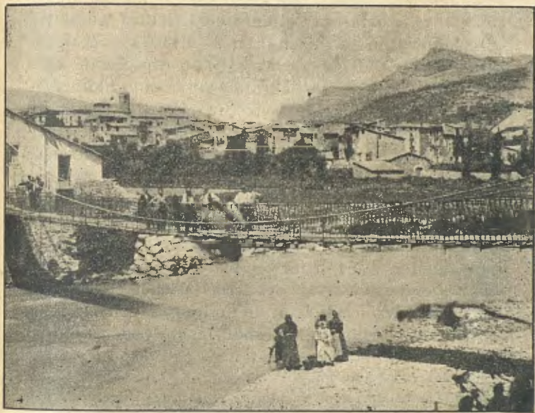
Pobla de Segur: Pont sobre'l Noguera Pallaresa

Situada a la confluència del Pallaresa y Flamisell, per quines riberes se comuniquen la montanya y la vall d'Aràn