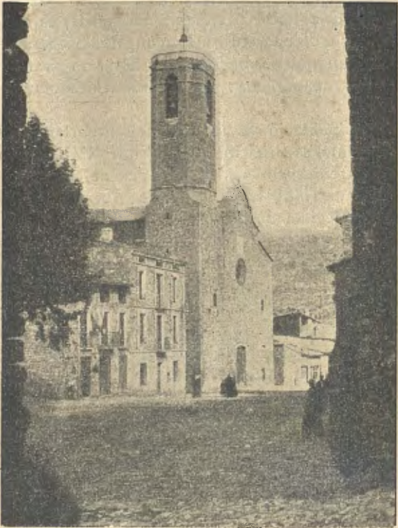
Pobla de Segur: Iglesia

central s'obre un ample corredor fins al creuer, coronat per elevada cúpola. Un dels altars laterals, costejat per la família Orteu, és un notable exemplar de l'art barroch, ab la particularitat de que és erigit a l'Immaculada Concepció