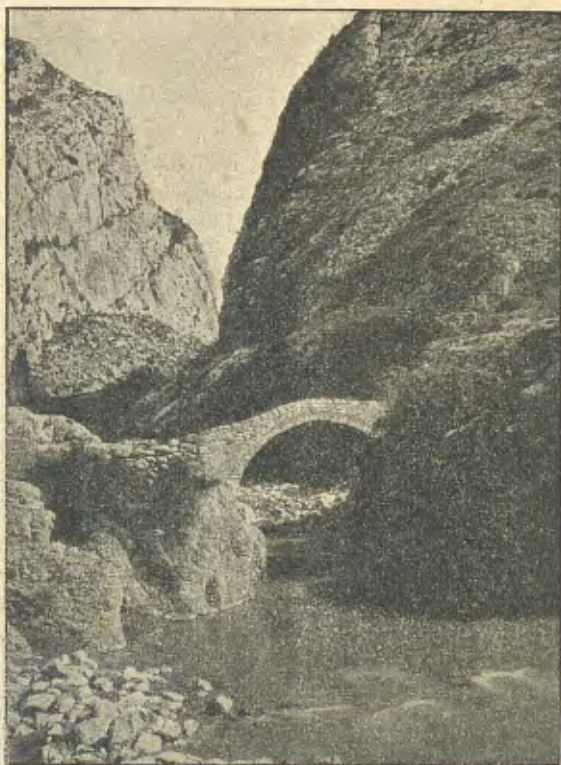
Congost: Pontet d'Erinyà

del presbiteri, cúpola y el cor, salvantse no més que'ls altars laterals y la sacristia, y no's va perdre cap de les valioses joyes que posseeix, entre elles una notable creu gòtica de plata sobredaurada. De mica en mica s'ha