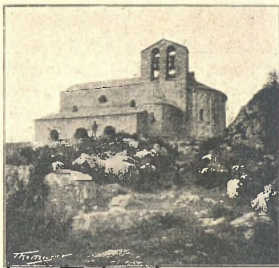
Sant Pere de Montgrony

ran relatives comoditats, carinyós servey y desinteressat hostatge que us ompliran de dolç benestar. Poca cosa de interès artístich ofereixen a l'excursionista la casa del santuari y la capella d'aquest: allí la Naturalesa, ab ses feréstegues formes, ho aclapara tot; la mateixa capella està quasi tota formada per la roca del cingle, que li dóna un caràcter que en va hauria buscat el més genial arquitecte. De la casa's puja a la capella per una rústega escala de