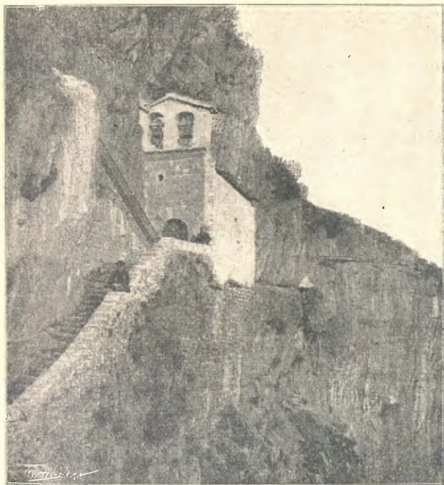
Santuari de la Verge de Montgrony

que'ns havia acostat molt al santuari, tocàrem els pitos, y per les finestres y galeries d'aquell sortiren alguns dels qui s'havien anticipat, y ens saludaren ab crits de joia y fent voleyar els mocadors, demostracions a les que contestavem