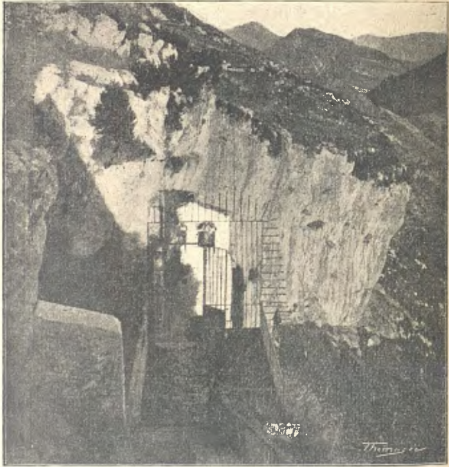
Santuari de la Verge de Montgrony

a seva situació y rústega senzillesa. Penjat dalt del cingle que'l resguarda dels vents del nord, contempla al seu davant un panorama d'incomparable bellesa y grandiositat, format per la conca del Freser a l'est, la del Merdàs