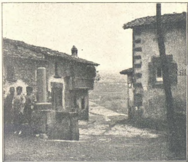
Sant Pere de Torelló

Sortirem a les tres quaranta-cinch minuts, dirigint-nos per vora la casa de camp anomenada Càn Pla, y, seguint el bell camí que atravessa'l torrent d'Archs, pas-sàrem prop la casa de Redorta y Hostal del mal Govern, aon comença la montanya. Varem pujar al Padronet, petit pilar aixecat sobre un precipici y que conté una cape-