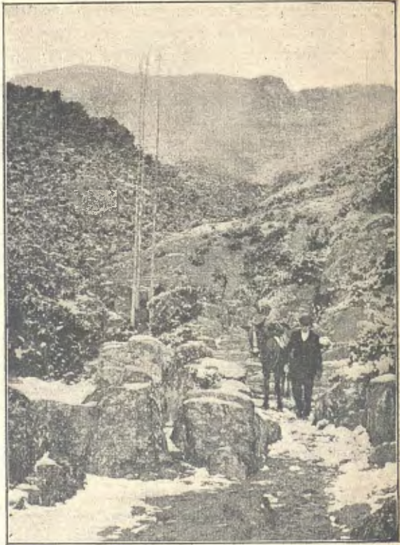
Camí del santuari de Bellmunt

Aquesta ermita fou aixecada sobre un espadat turó de roca viva y té uns 1,180 metres d'altitut sobre'l nivell