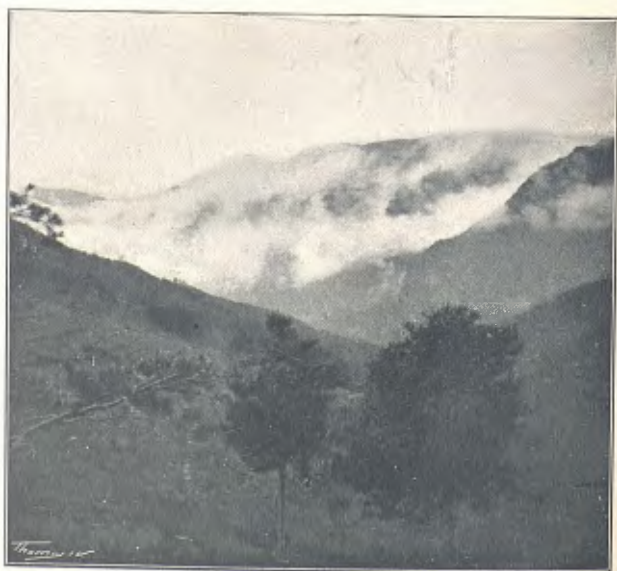
DE VILADA A SANT JAUME DE FRONTANYÀ. COLL DE CERCOSA