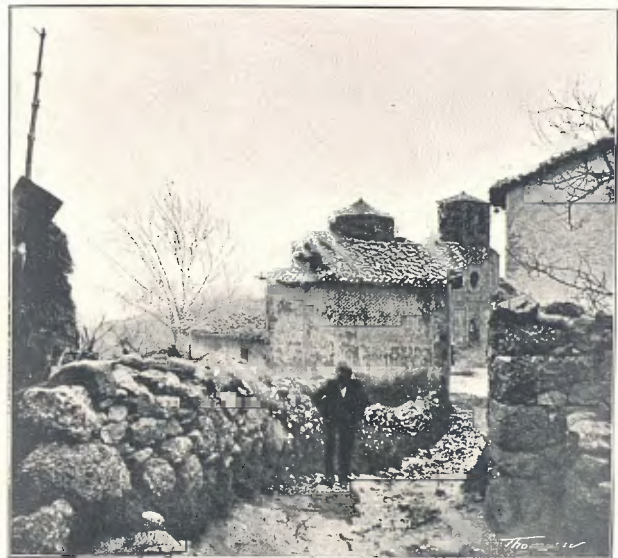
SANT JAUME DE FRONTANYA