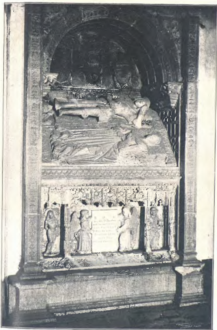
SEPULCRE DEL DUCH FERRANT DE CARDONA