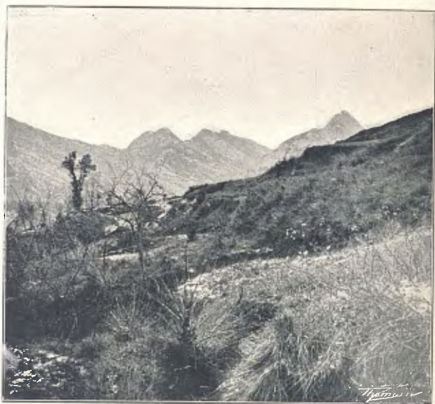
DE VILADA A SANT JAUME DE FRONTANYÀ. VALL DE VILADA