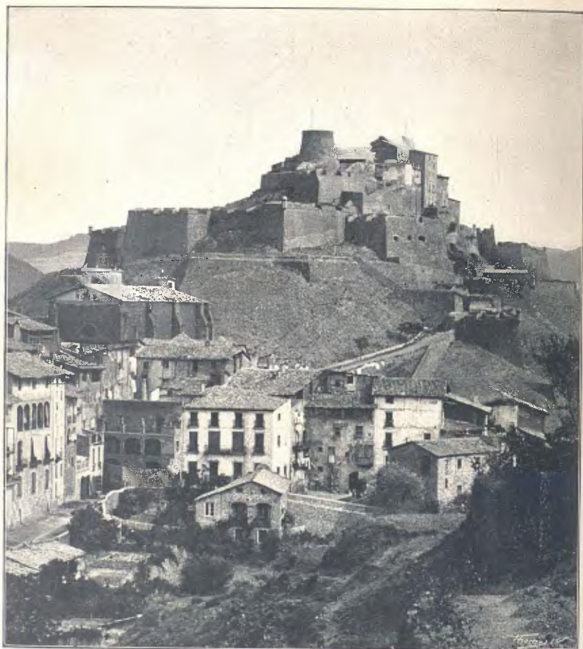
VISTA GENERAL DEL CASTELL DE CARDONA