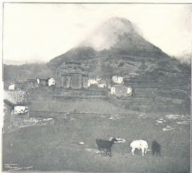
SANT JAUME DE FRONTANYA