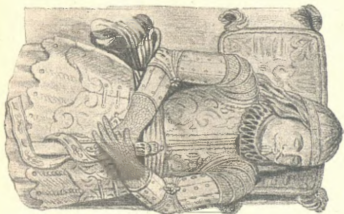
Estatua jacent del sepulcre d'en Joan R. Folch

Hi ha també la cambra d'en Perot Call, santificada per la presencia de Nostre Senyor, que acompanyat dels àngels administrà'l Viàtich al gloriós Sant Ramon Nonat, que morí en ella y fou convertida en capella pels Duchs el 1682. En nostres dies està abandonada aquesta capella