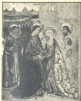
FRAGMENT DEL RETAULE

El de La Visitació es el més hermós de tot el retaule. Es interessant la figura de la Verge Mare, plena de senzillesa y vestida ab elegancia y bon gust. Sa cosina Santa Isabel, habillada ab rica estofa de brocatell d'artístich dibuix, expressa ben clarament en son semblant l'admiració y l'alegría que sent al rebre la fausta nova que li comunica la Verge. Es una delícia l'hermosa figura de Sant Joseph, vestit ab lloba de rica estofa, folrada y enribetada d'armini. En son posat, en l'ingenua expressió de sa cara, en sa actitud al descobrir-se pera saludar a sos cosins els sants Zacaries y Isabel,