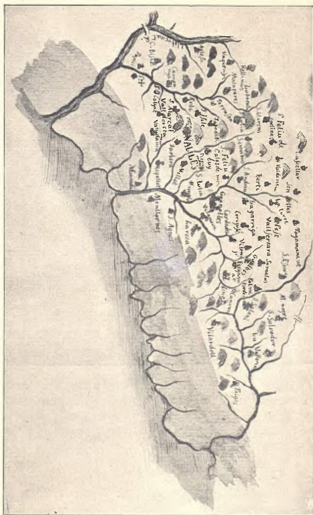
II. — FRAGMENT DE LA CARTA «CATALONIÆ PRINCIPATUS DESCRIPTIO NOVA»

colors. No porta la divisió de vegueries, però, en cambi, posa les comarques naturals, sense senyalar els termes. Vegi-s carta II.