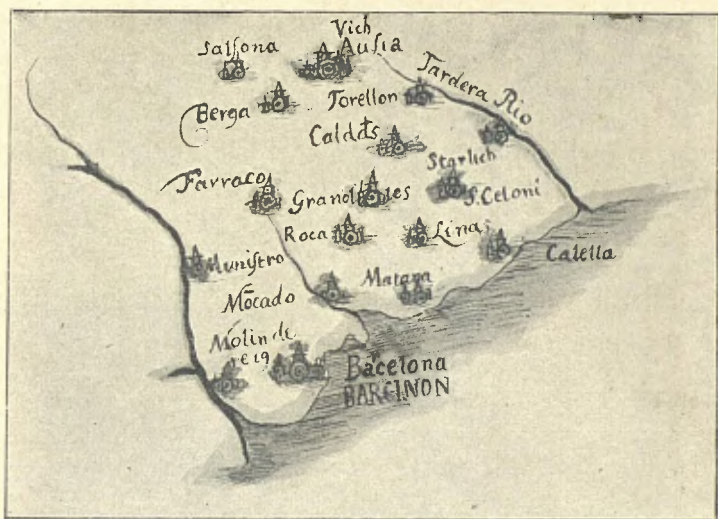
I. — FRAGMENT DE LA CARTA «ARAGONIA ET CATALONIA»

Les poblacions pertanyents al Vallès que cita són: Gra-