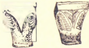
Capitells del claustre de Santa Maria de Labaix

Els comtes de Pallars, quals dominis s'extenien per la vessant esquerra del Ribagorçana fins a la vall de Bohí, varen fer-li moltes donacions durant els segles X, XI y XII, en quina època degué arribar al període més brillant de la seva historia, íntimament lligada ab la d'aquell comtat, sobre quin territori, en sa part occidental, exercí una veritable influencia, aixís com el monastir de Gerri la tenia en el centre del Pallars.