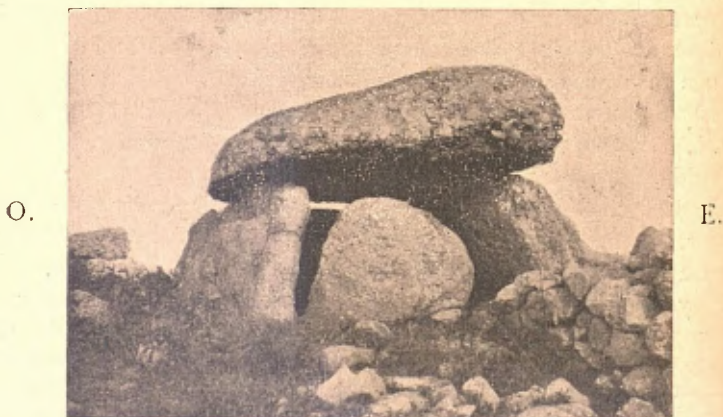
LA CASA ENCANTADA. — DOLMEN DE PINYANA

gada. Si voleu saber com se varen portar allà dalt aquelles pedrasses, us diràn que una nit va sortir una encantada d'estany obert; duya la pedra més grossa al cap, dugues a sota l'aixella, y les més petites a la falda; va seguir torrent avall fins a Cadolla, y desde allí empenqué la pujada; y pera demostrar que no l'afadigava'l pes, afegeixen que no va deixar la filosa en tot lo camí (1).