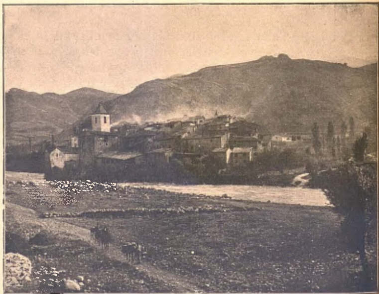
PONT DE SUERT

El Pont es la població més important de l'alta conca Ribagor-