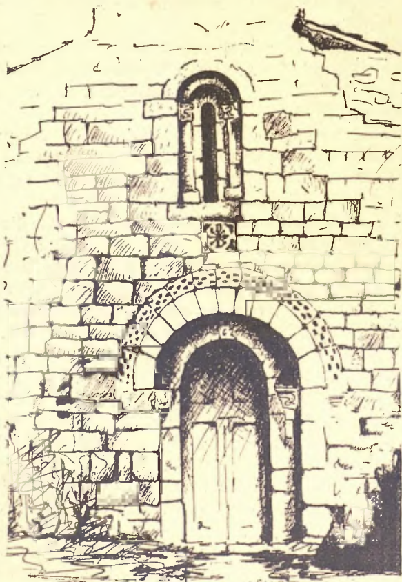
IGLESIA DE CORRONCUY

Passades les cases del Pla, recolat en una penya coronada per una antiga torre que'n diuen del Molar, se veu a mà esquerra, de cara a mig-dia, lo petit poble de Corroncuy (1).