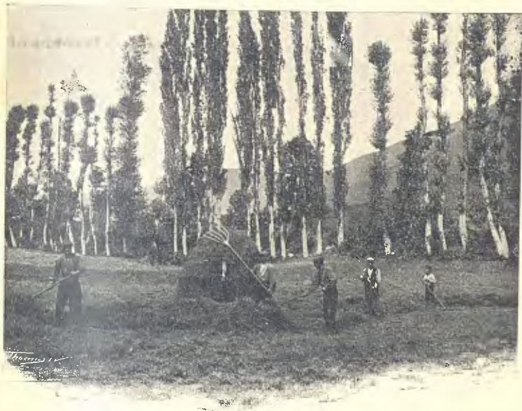
RECOLECCIÓ DE L'HERBA