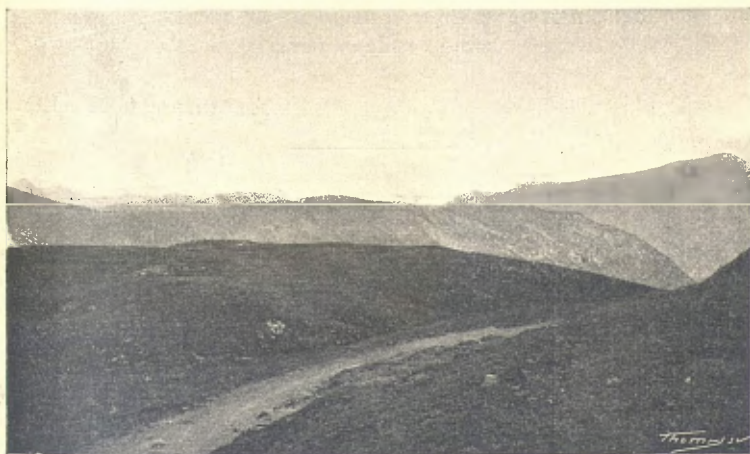
CAP DEL PORT

Ab hora y mitja's puja del santuari de les Ares al cap del port,