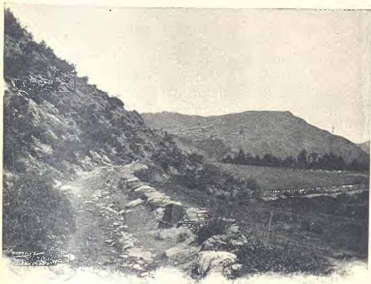
EL MALL («MASSA DE ROTLANT»)