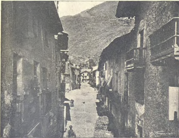
ESTERRI. — CARRER MAJOR

Pera fer l'excursió a la Vall desde Barcelona poden seguir-se tres diferents itineraris. El més curt es per la via de França a Tolosa, Boussens y St. Giron, tres o quatre hores de carruatge seguint