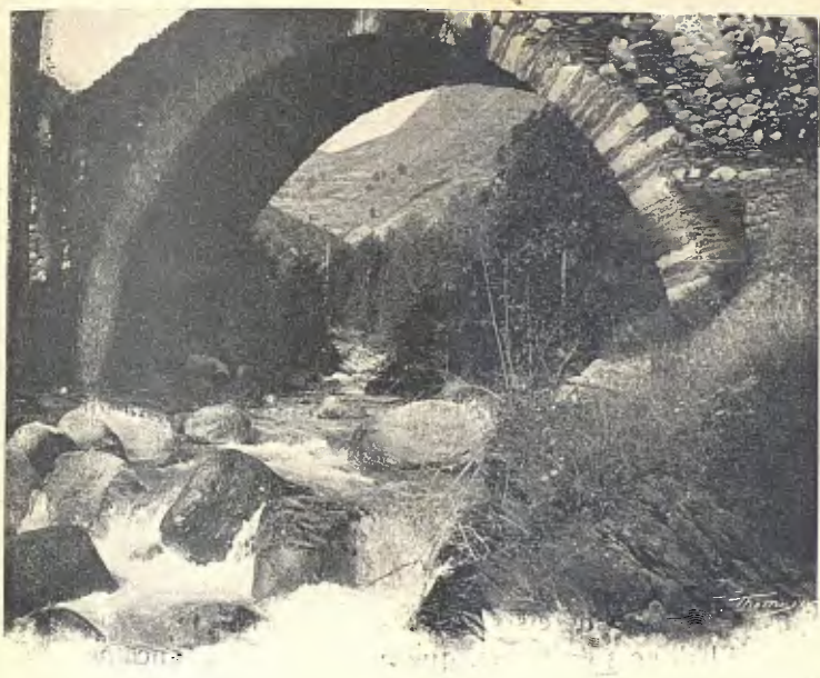
VALL D'ANEU. — PONT DE LA TORRASSA