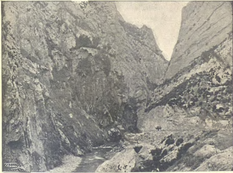
PAS DE COLLEGATS. — L'ARGENTERIA

Una hora més amunt se troba la vila de Gerri, dita de la Sal, per la gran quantitat d'aquest producte que's recull en sos salins, per evaporació espontania de l'aigua de la Font Salada, que la