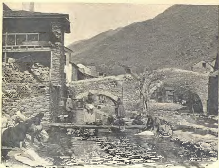
ESTERRI. — PONT Y RESCLOSA DEL MOLÍ