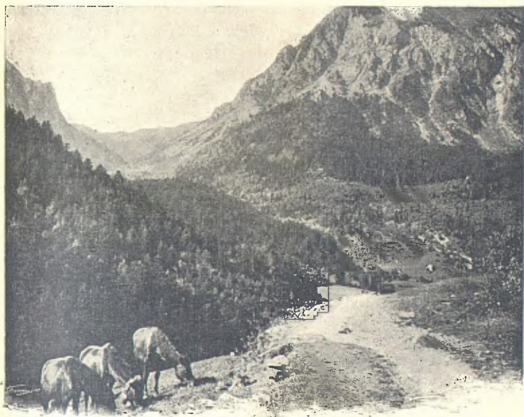
COLL DE BACIERO Y PUIG DE LA BONAIGUA

Poch més d'un quart més amunt se troba una de les vistes més hermoses del Pireneu, el coll de Baciero. A l'esquerra del primer terme, l'acabament del riquíssim bosch de la Mata, propietat de la casa de Medinaceli (1). Darrera, en segon terme, a la mateixa esquerra, el Puy de Baciero, y a la dreta, enfront seu, el colossal y