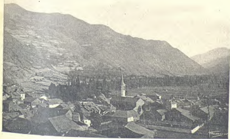
VILA Y PLA D'ESTERRI