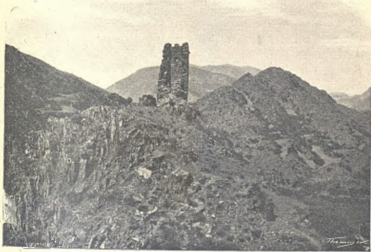
TORRA DE PORT ARAN

Molts anys, segles tal volta, s'ha mantingut la torra esberlada de dalt a baix, com si ho fos per un llamp, fins que fa dotze o catorze anys s'enrunà l'una meitat. Es tradició que havia existit un poble en eix lloch y molt a la vora'l monastir de Sant Esteve, aon,