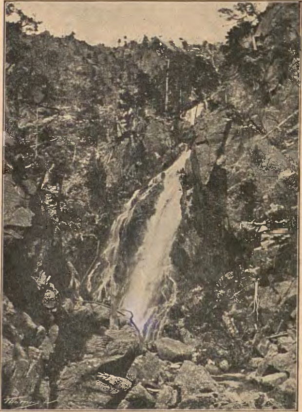
SALT DE BICIBERRI

Als nostres peus, y a 1.775 m. d'altitut, el teniem, aquella ampla clapa de blau de safir (1), espurnejada pels tocs argentats de sa superfície riçada per la suau brisa, y quals onades en miniatura anaven a petonejar ab monòtona cadencia ses voreres rocalloses.