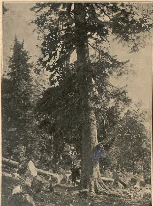
BOSC DE BICIBERRI

En una hora de pujar, y després d'haver atravesat un fort tarter de grosses masses de granet, ens trobarem dessota la muralla que, a manera d'ampla presa, serveix de contenció a l'estany. Per una esquerra d'aquella paret en ruïnes sobreïxen ses aigües, sal-