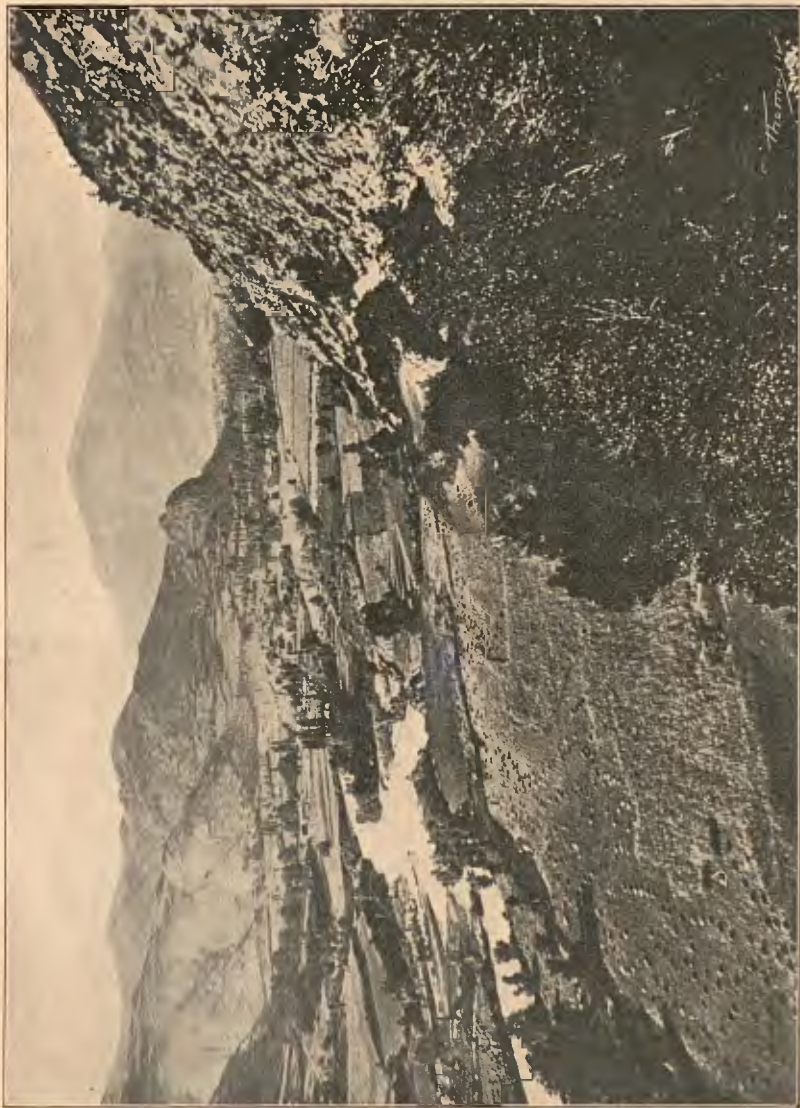
LA NOGUERA RIBAGORÇANA A PONT DE SUERT