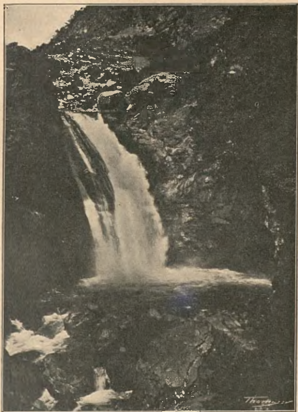
SALT DE SENET

A les quatre arribàrem a Senet (tres hores de Vilaller), darrer poble de la ribera Ribagorçana cap al nord, situat a l'extrem de la comarca, frontierís pel riu ab la provincia d'Osca, y ab escasses y dolentes comunicacions ab els poblats vehins. El camí, abans