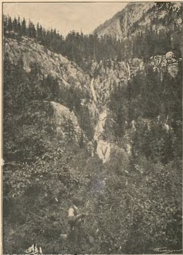
SALT DEL RIU BUENO

esguerrinxades que passos. «Pari compte ab els escorçons», me deya'l guia. Sí, per escorçons estava jo, tip de tanta brega. Per sort no tardàrem a arribar a la font d'Anglos, aont ens revenírem ab sa exquisida aigua. Reempresa tot seguit la marxa y seguint pujant