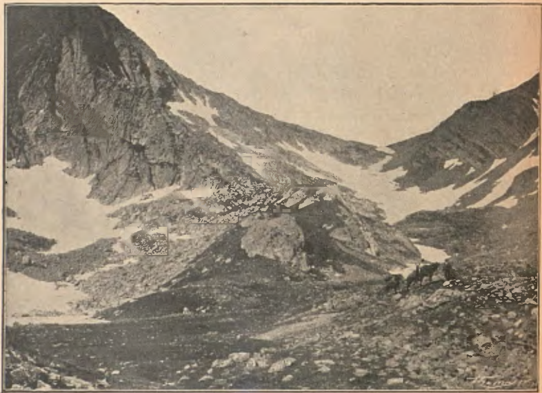
VALL D'ARÁN: CAP DEL PORT DE VIELLA

Sens dubte aquells infeliços, en mitg d'aquella desfigurada naturalesa, atuhits pel torb y cansats de rompre neu, perderen l'esma y, una vegada arribats al coll, en compte de girar-se a la dreta y seguir serra enllà cap a la carena, prengueren el coll com