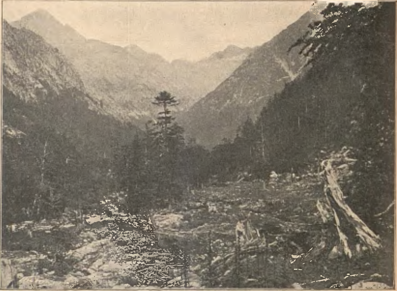
RIBERA DE LES SALENCAS

En dues hores d'aquest hermós paisatge forem al cap de la ribera. Allí l'espai se'ns obria, y el riu el vèyem entreforcar-se. A la dreta NO. se'ns presentava en allargada cascada entatxonada en la boscuria: era'l propri riu de les Salencas, que surt en el tarter o