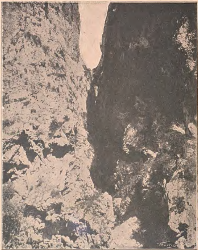
LA CANAL DE TORO AL PORT DE VIELLA

expedició ab les autoritats, y, ja dalt del Port, y després de llargues recerques, en el planell del Coll de Toro un bony que feya la neu denuncià la freda mortalla d'aquella infeliça, qual cadavre, assegut