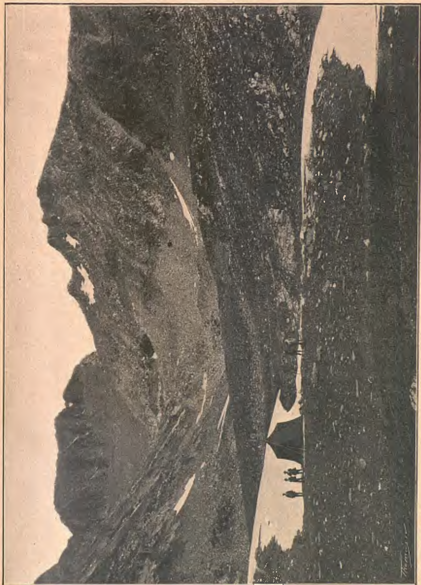
VALL DE CADÍ. LA PICA DE BALATJ