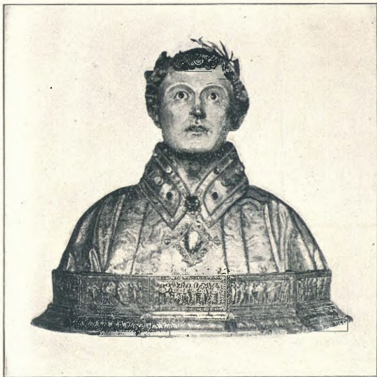
SANT LLORENS: RELIQUIARI DE SANT ORENCI

De Sant Miquel fem via a una plana ahont se suposa tinguda