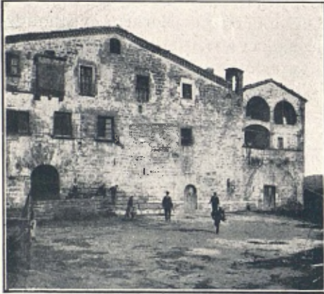
MONTANYÀ DE NAVÉS

A una mitja hora de Tarascó hi havia'l mas de Montanyà (patria de l'hèroe del Bruc y canonge de la sèu de Manresa, Ramon