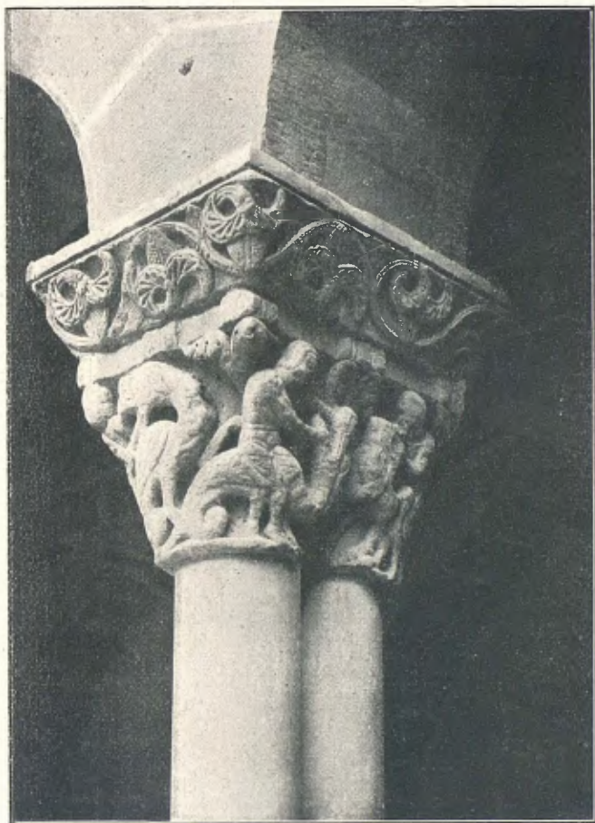
SANT PERE «LO VELL»: CAPITELL DEL CLAUSTRE FIGURANT LA LLUYTA DEL HOME AB LA FERA

Llorens 1 y de Sant Orenci, són obres d'orfebreria recomanables del segle XVI al XVII. Assenyaladament lo darrer, per son preciós fris, ahont en cinch alts relleus d'orfebreria se reproduueixen altres