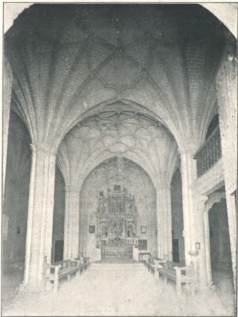
CAPELLA DE SANT JORDI A AICORAZ