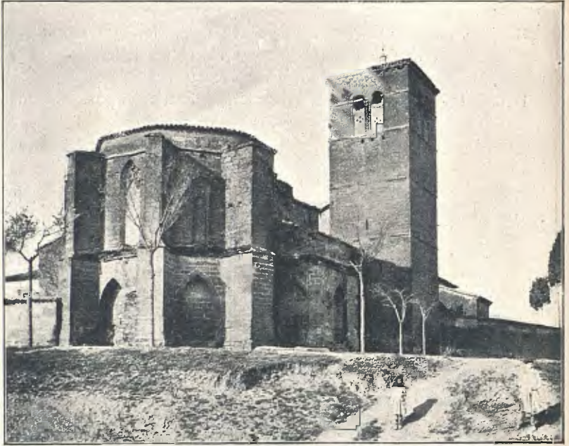
IGLESIA DEL MONASTIR DE SANT MIQUEL