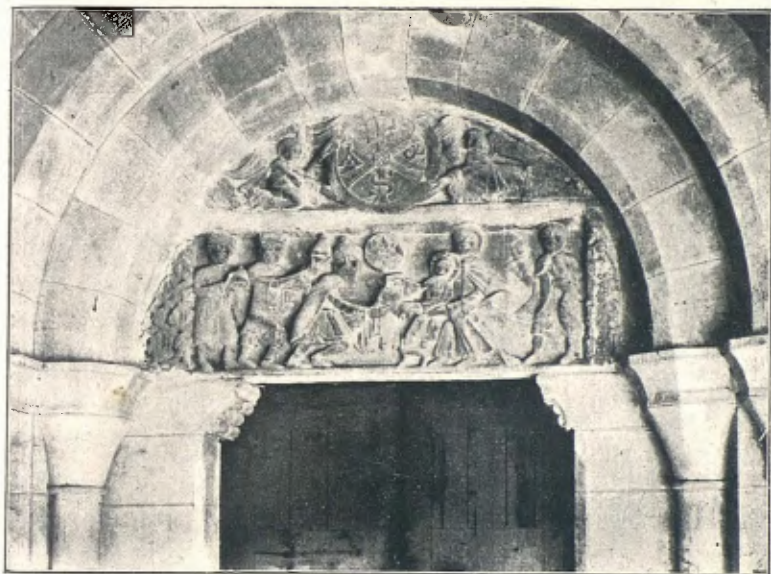
SANT PERE «LO VELL»: PORTA INTERIOR DEL CLAUSTRE