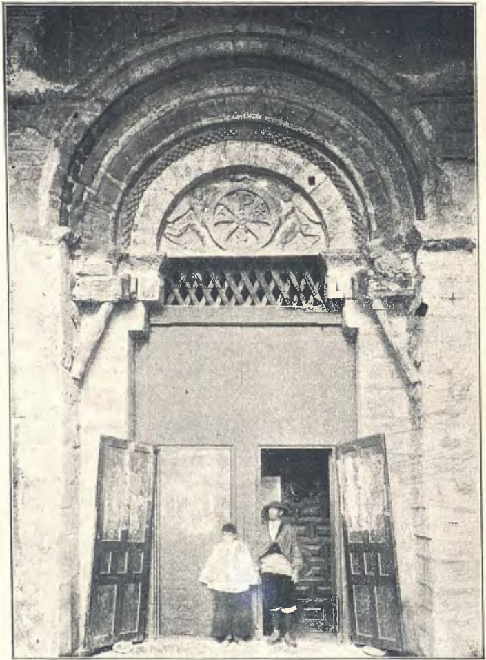
SANT PERE «LO VELL»: PORTA FORANA

vingut com a legat del Papa, per arreglar lo mal estat de les iglesies dels reyalmes cristians d'Espanya. Estigué diferents vegades a