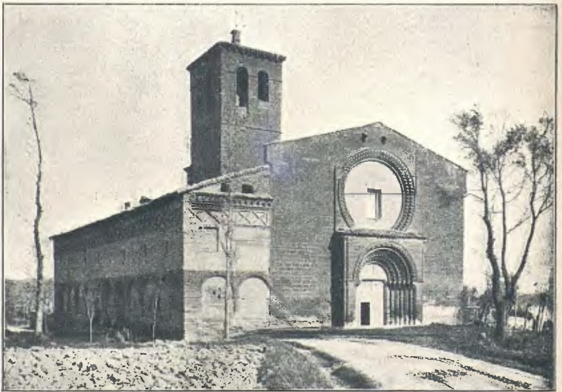
MARE DE DÉU DE SALAS: ASPECTE GENERAL DEL TEMPLE