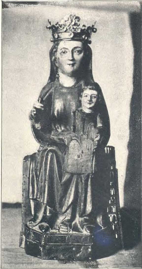
SANT FRANCESC: IMATGE DEL SEGLE XIV

tants episodis de la vida del sant oscense, tots ells de bona composició y esmerada factura.