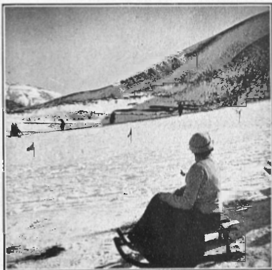
UN ASPECTE DE LA PISTA DE LA FALGOSA

Les festes de Ribes havien deixat complagut a tothom. Aquells dies d'expansió perduraran com recordança agradable. Les amistats segeilades en plena natura feien anyoriça una prompta separació, que 's veia ab força recança. Es per això que, a l'arribar el dilluns y emprendre quasi tots els expedicionaris el retorn cap a Barcelona, ningú se consolava de la despedida, y en els mateixos trens que els portaven novament a la nostra ciutat comtal va néixer espontaniament l'idea d'aplegar en algun acte a tots els excursionistes.