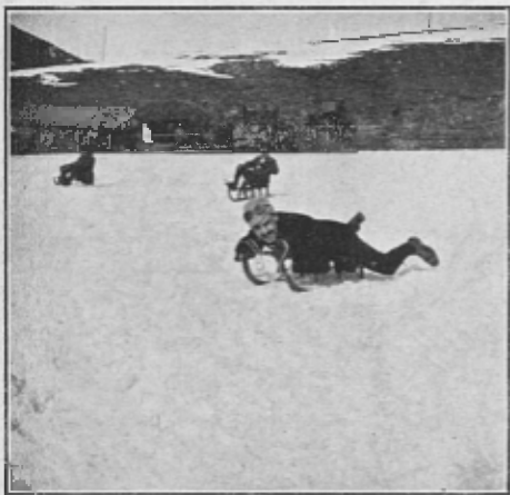
ENTRENANT-SE PER LES CURSES

efecte y que formen una llarga caravana, que fa de bon veure per aquella serpentejant carretera que va pujant serra enllà. A la collada de Toses la gent se divideix; y, mentres la majoria s' dirigeix a la Molina (uns per la carretera y en carruatge, y altres a peu per la