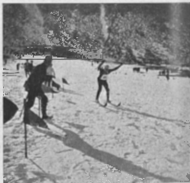
EN PLENA CURSA DE SKIS

terminats. La recança d'una propera separació traspuava per totes les converses d'aquella joventut entusiasta.