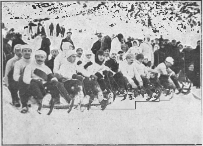
CURSA DE BOBS : AGRUPAMENT DELS QUE HI PRENGUEREN PART

No cal dir que durant aquesta tarda la majoria de concorrents