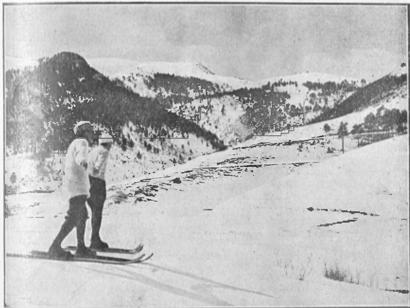
PER LES MONTANYES DE TOSÉS

vistosa corrua, se dirigeix vers la pista de Campelles, situada en un bell faldar de la carena que separa les vessants del Rigart de les del torrent Llobra. Aquesta té més d'un kilòmetre de llargada, y està marcada per dues rengleres de banderes verdes y vermelles que l'assenyalen. A l'hora de començar la cursa de luges pera 'ls paisans