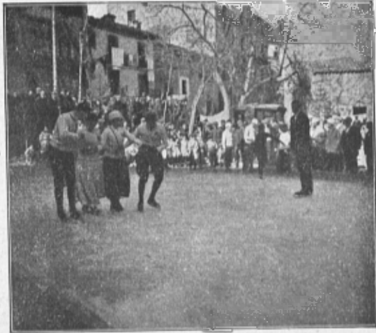
PISTA DE PATINATGE A RIBES

y abets, dòmassos, banderes, penjarolles diverses, il·luminació elèctrica ab potents arcs voltaics, y varis arcs de triomf ab inscripcions y dedicatories al CENTRE EXCURSIONISTA DE CATALUNYA. Els seus habitants corrien joiosos a donar la benvinguda als expedicionaris que anaven arribant, omplenent tots els carrers, barrejant-se ab els excursionistes y oferint tot plegat un quadro ben vistós, ple de vida y alegria; una nota de color y animació mai vista en aquella vila. Allí tothom se mostrava atent y servicial, complaent-se en servir y obsequiar als forasters, regnant entre tots una franca cordia-