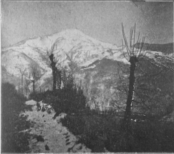
EL TAGA DESDE LA VALL DE RIBES

Arribà, per últim, el dia desitjat; y, mentres la dantera dels expedicionaris sortia cap a Ribes al matí del diumenge dia 29 del passat Janer, a fi de seguir pistes y ultimar preparatius, aquí continuava l'animació y les inscripcions que a fi d'acontentar a tothom