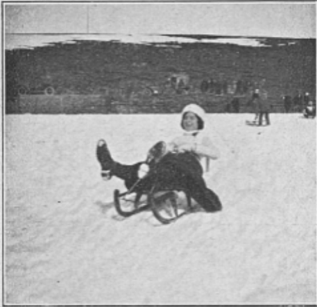
EN PLENA CARRERA