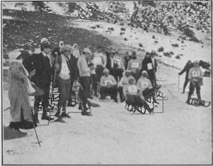
CURSA DE LUGES : ESPERANT LA SORTIDA

El campionat de skis fou força més interessant. L'estat de la neu era més a propòsit donant lloc y permetent regulars velocitats, que