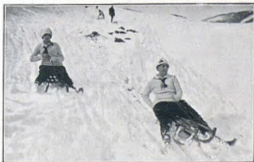
Clisé d'en Braugui

Després d'haver-se complert estrictament el programa en els dos dies anteriors, malgrat els esforços de la Junta Organitzadora dels concursos, no pogué portar-se