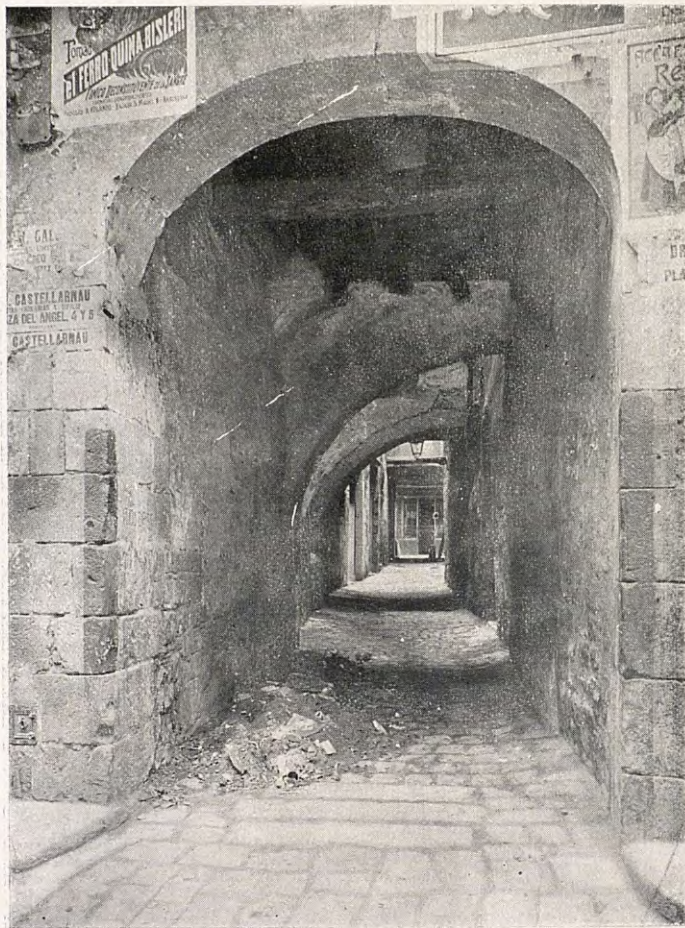
CARRER DE LES «TRES VOLTES»