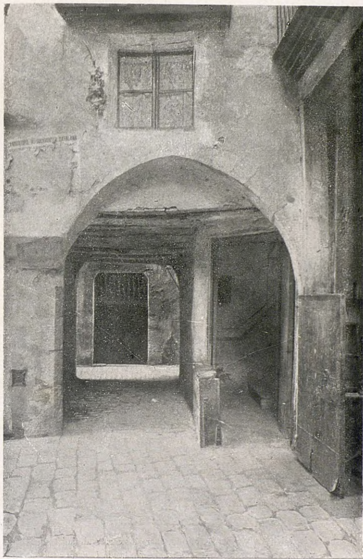
TÍPICH ARCH DEL SEGLE XIII AL XIV