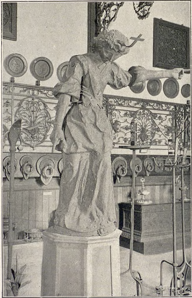
ANGEL DE LA PLAÇA DEL BLAT