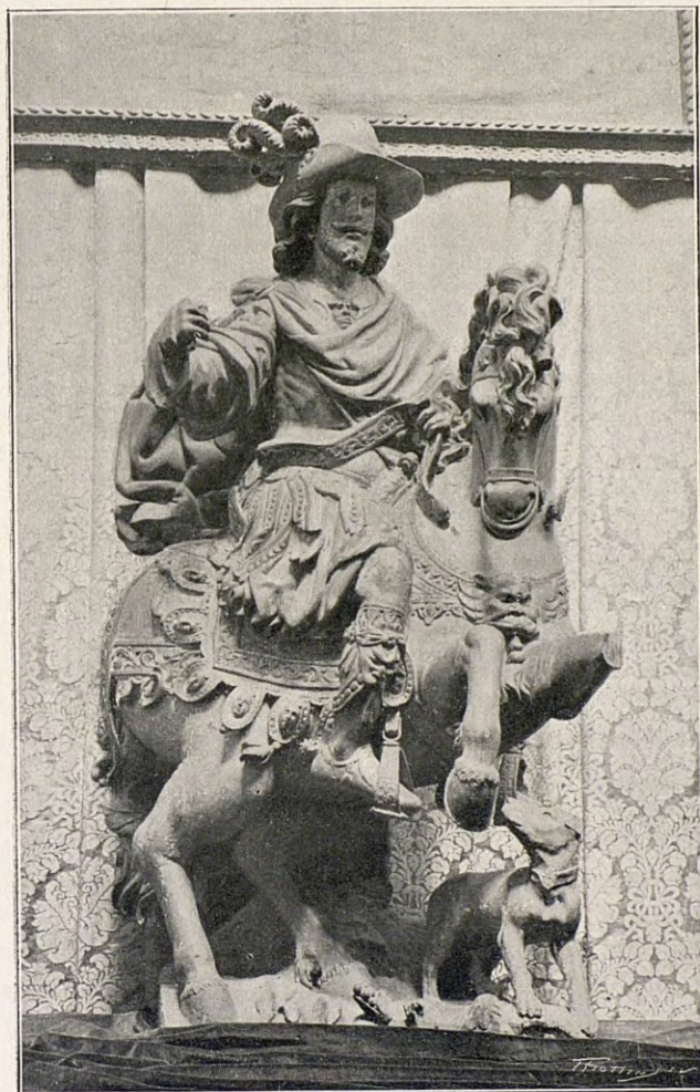
SANT JULIÀ (PATRÓ DELS MERCERS)