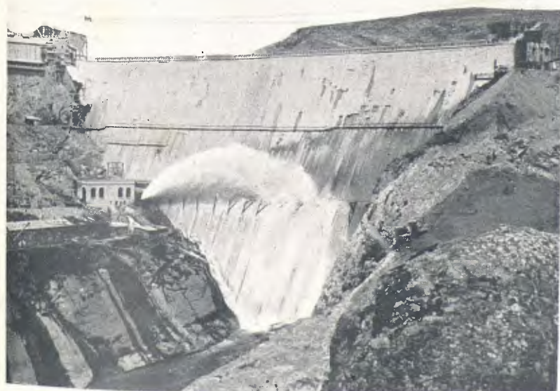
RESCLOSA MONUMENTAL EN EL NOGUERA PALLARESA