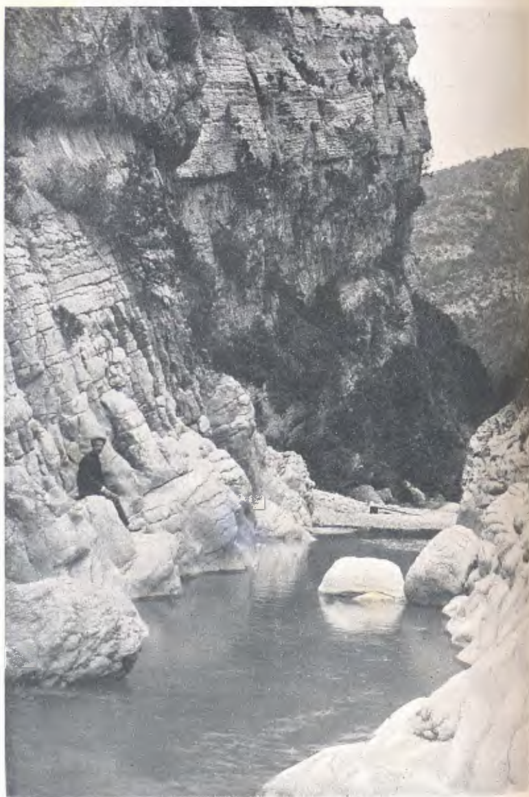
SERRA DEL MONTSECH : TORRENT DEL BOSC