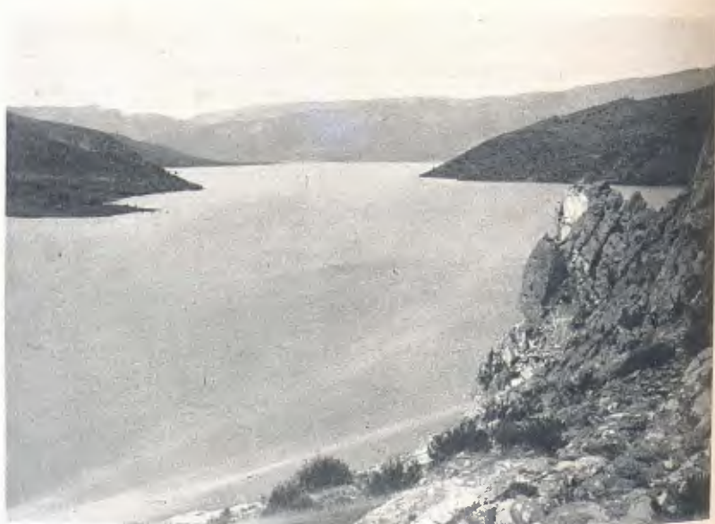
LLAC FORMAT PER LA RESCLOSA