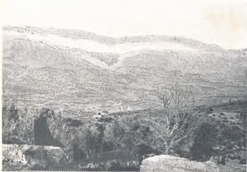
AGER I SERRA DEL MONTSECH, DES DE FONTDEPOU