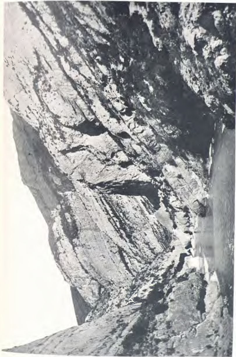
SERRA DEL MONTSECH ; PAS DELS TERRADETS