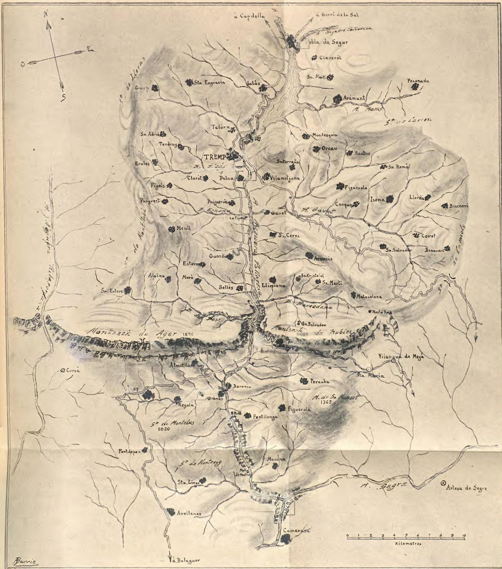
MONTSECH I CONCA DE TREMP