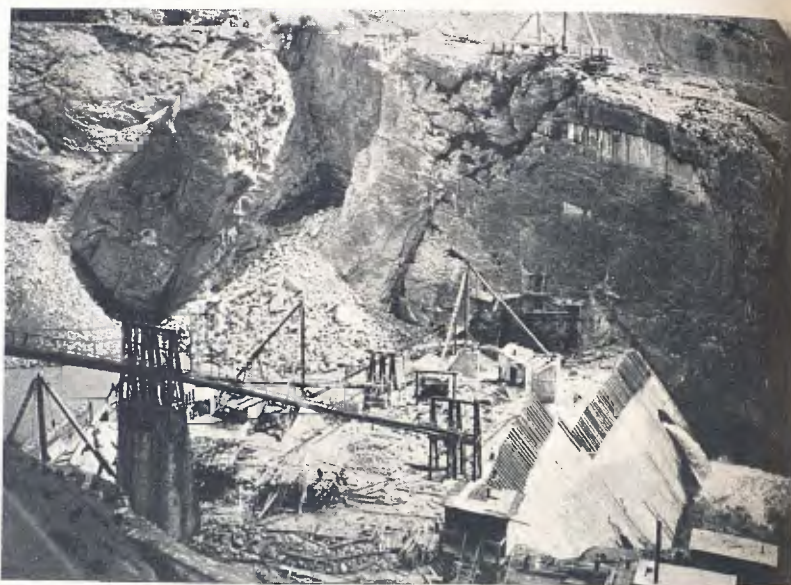
CONSTRUCCIÓ DE LA RESCLOSA