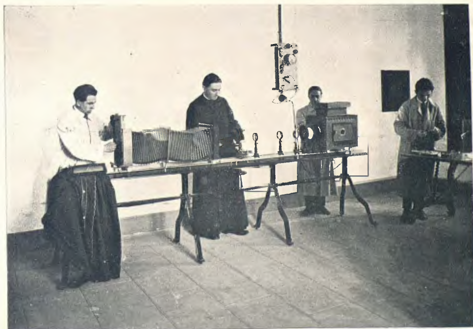
INSTAL·LACIÓ DE MICROFOTOGRAFIA EN EL LABORATORI DE GEOLOGIA DE L'ESCOLA SUPERIOR D'AGRICULTURA