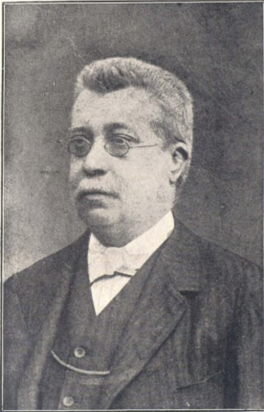
JOSEP FITER I INGLÈS