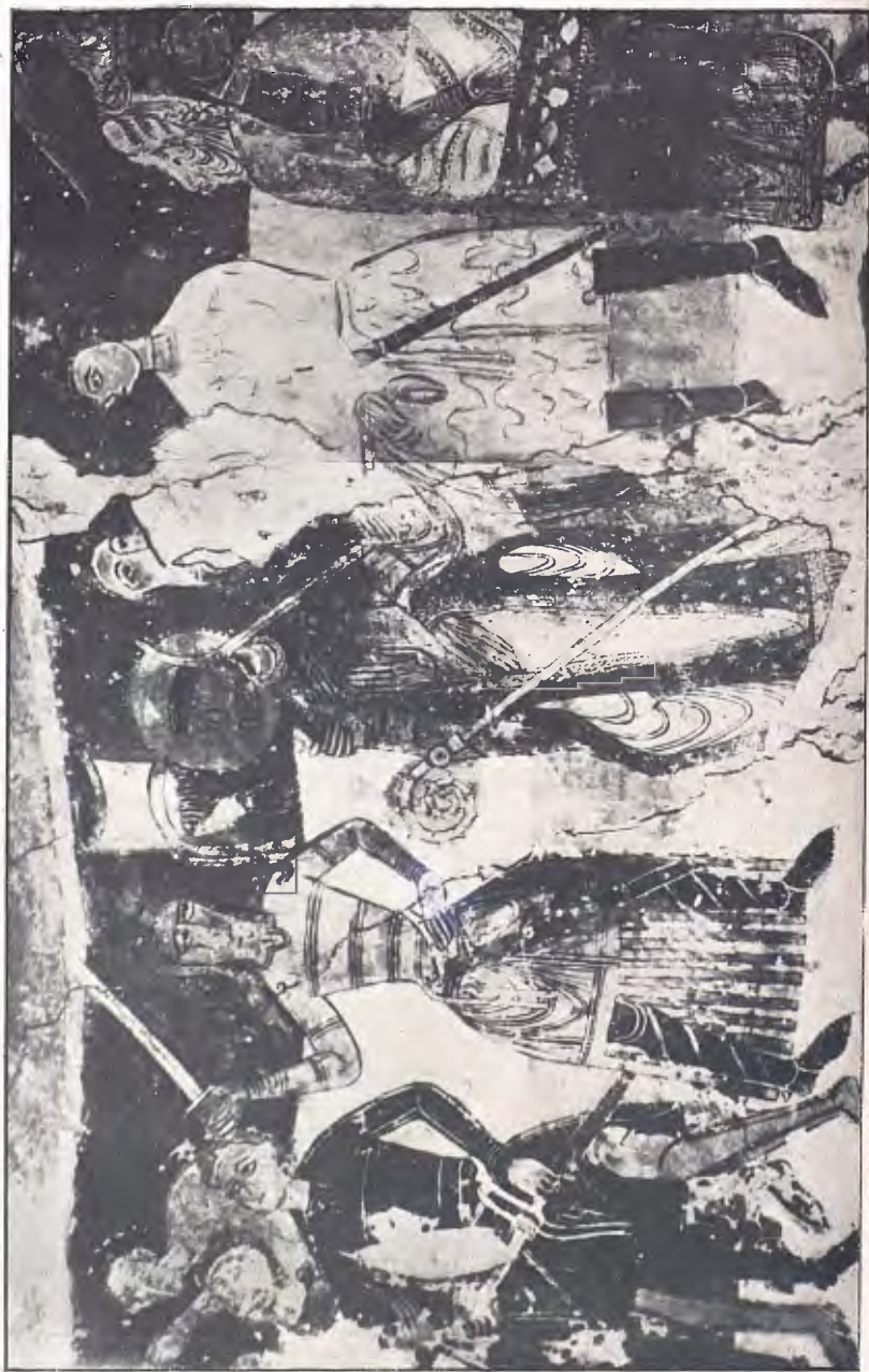
FIG. 10. — PANTURES MURALS DE SANTA MARIA DE TERRASSA