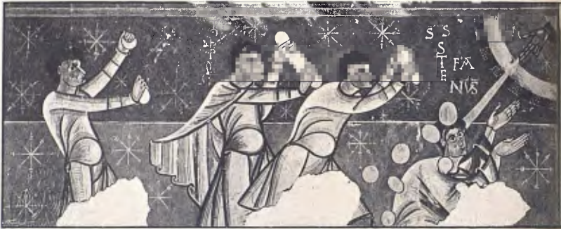
FIG. 11. — PINTURES MURALS DE SANTA MARIA DE BOHÍ Segle XII