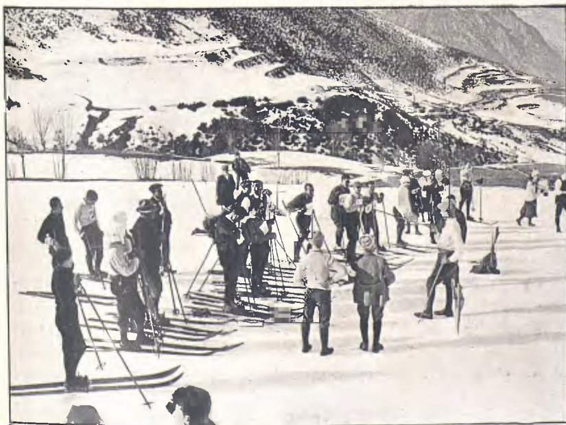
PREPARANT-SE PER A LA SORTIDA DE LA CURSA DE FONS