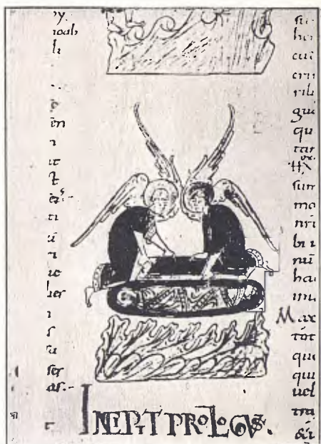
FIG. 13. — BÍBLIA DE SANT PERE DE RODA