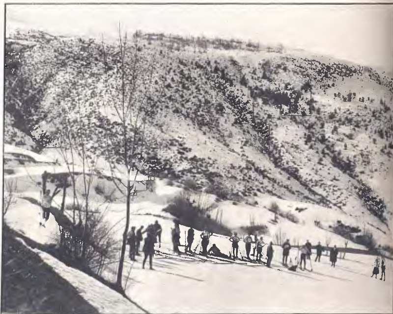
ASPECTE DE LA PISTA DE FONS