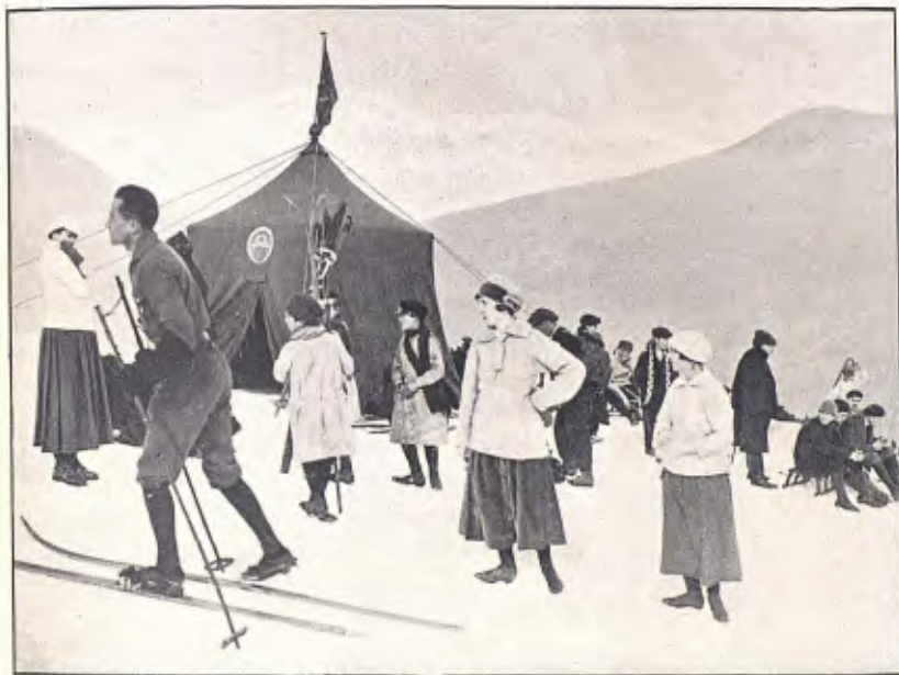
PISTES DE LA FALGOSA