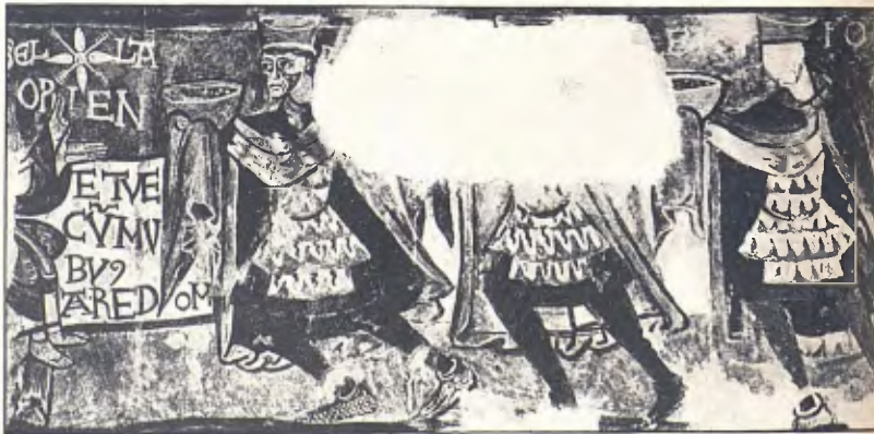
FIG. 12. — PINTURES MURALS DE SANT MARTÍ DE FENOLLAR Segle XII