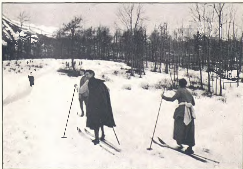
VOLTANTS DE CAMPRODON