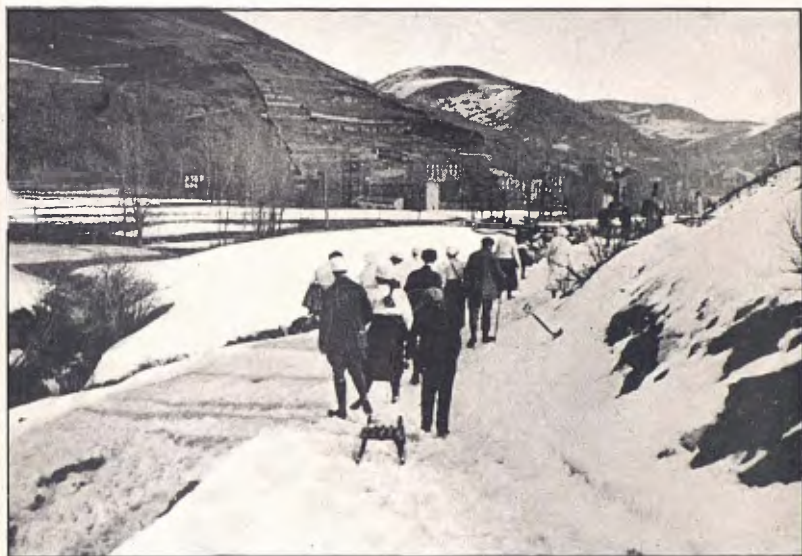
CAMPRODON : CAMÍ DE LES PISTES