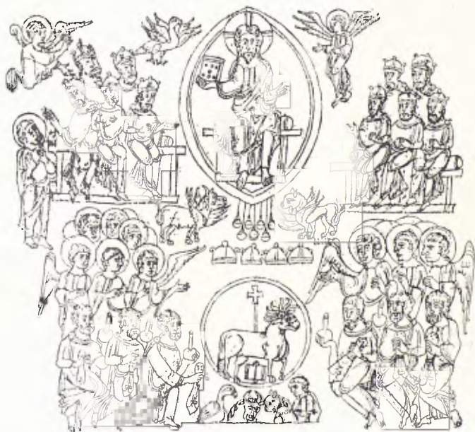
FIG. 9. — BÍBLIA DE SANT PERE DE RODA