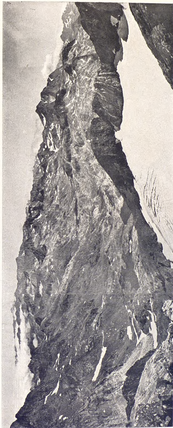
II. — VISTA PANORÀMICA DES DEL PIC DE L'INFERN

3. — REGIÓ LACUSTRE DE BACHIMAÑA; 4. — LLACS DE BRAMATUERO; 5. — VIGNEMALE