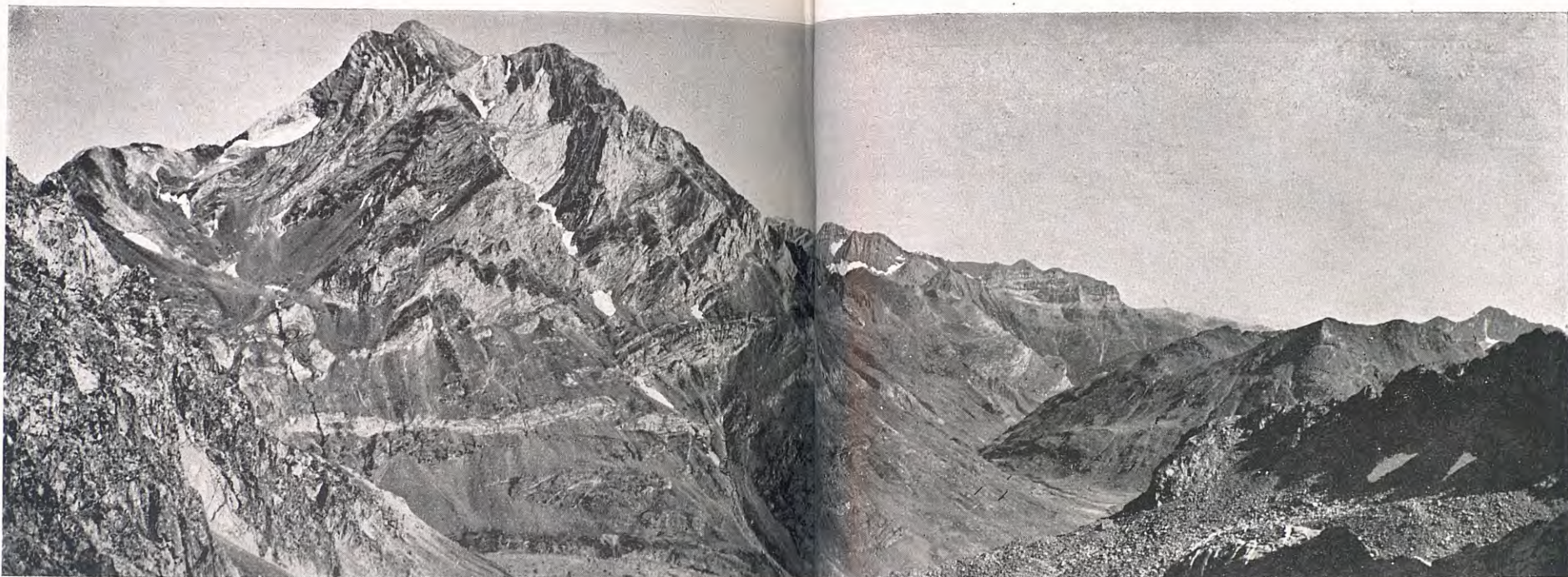
VISTA DEL VIGNEMALE DES MOLLADA DELS BATANS