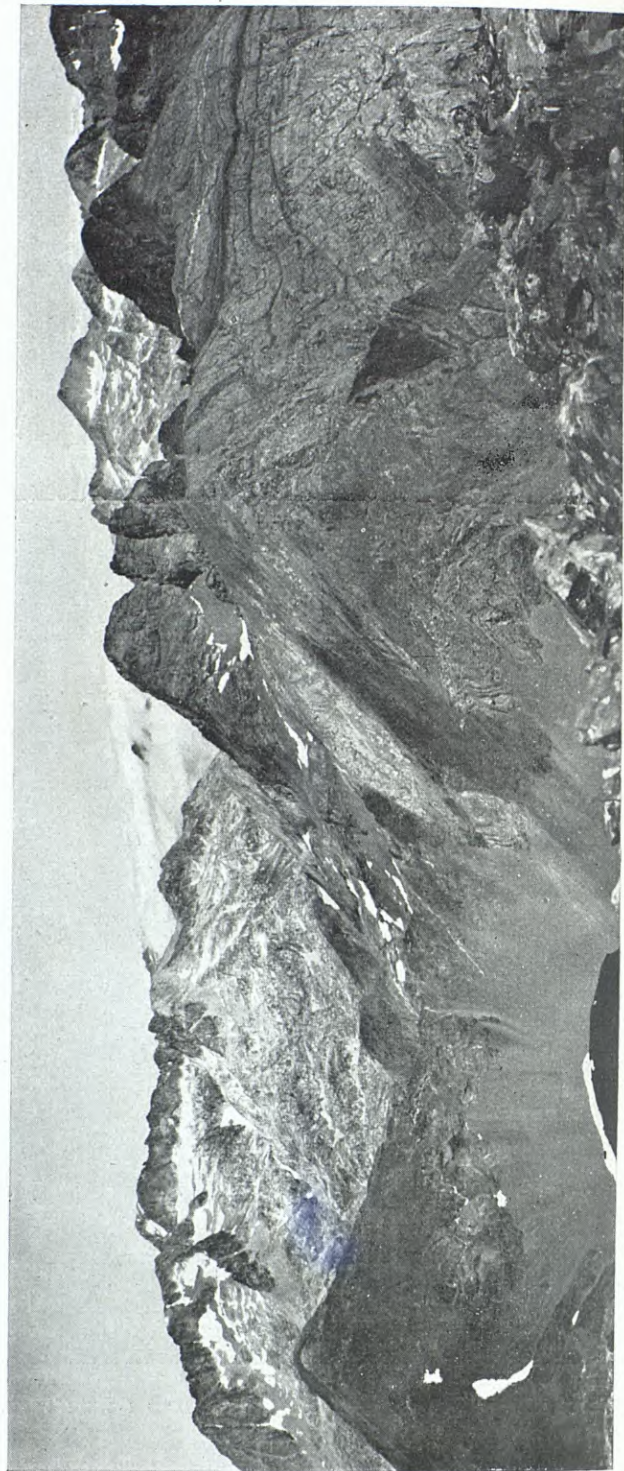
1. — VISTA PANORÀMICA DES DEL PIC DE L'INFERN