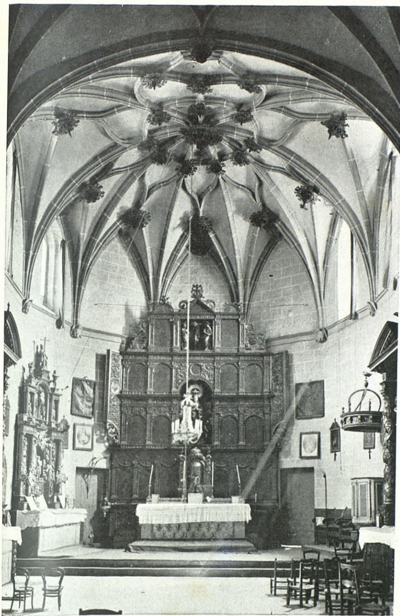
SALIENT. — INTERIOR DE L'ESGLÉSIA