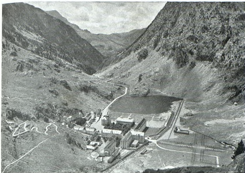
ESTABLIMENT E IBON DELS BANYS DE PANTICOSA