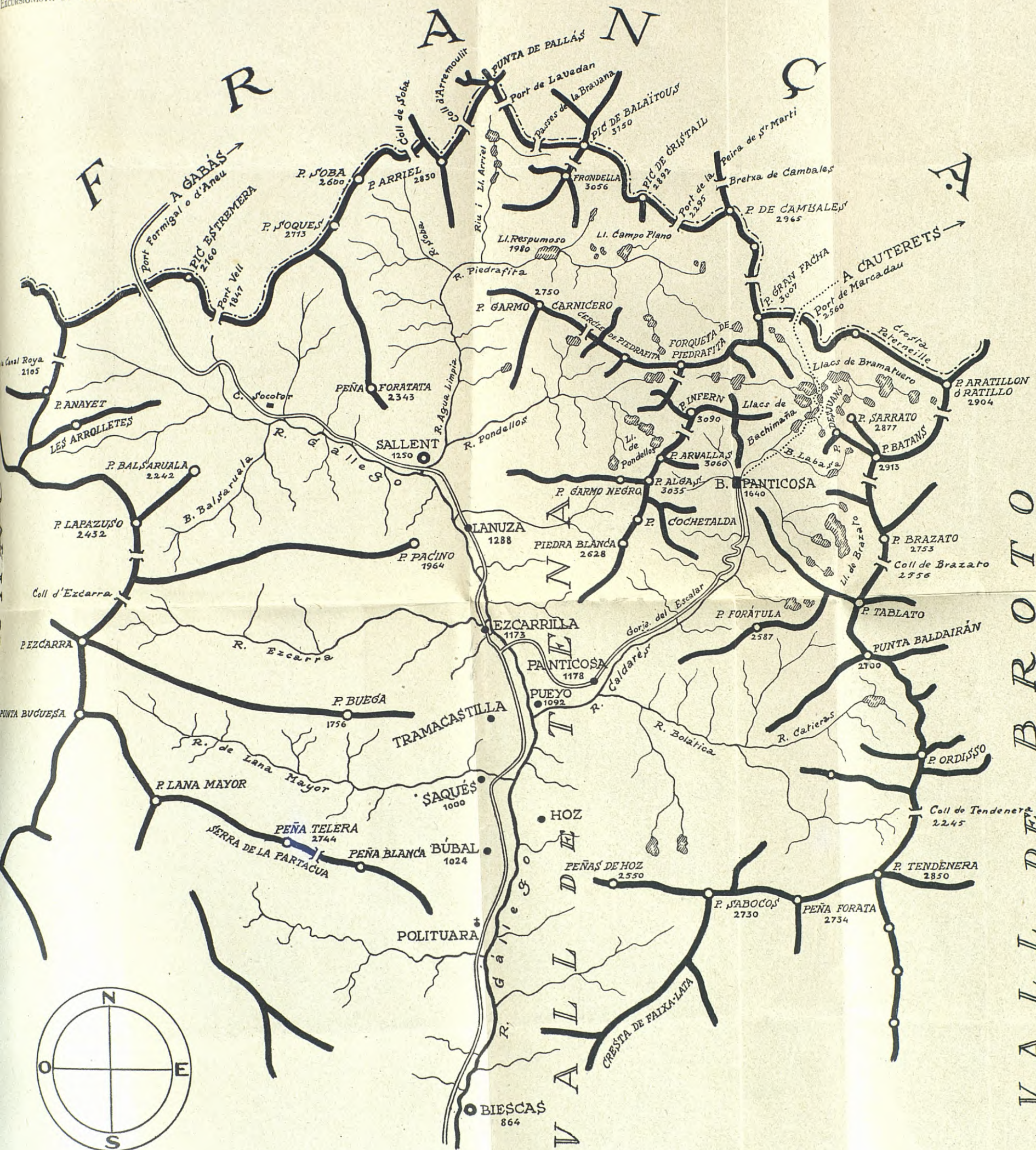
MAPA DE LA VALL DE TENA Escala 1:100,000