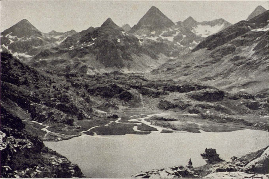
ESTANY RESPUMOSO; AL FONS ELS PICS DEL CERCLE DE PIEDRAFITA