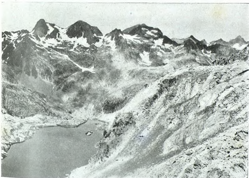
LLAC DE BRAZATO I PICS D'ALGÁS, D'ARUALAS I DE L'INFERN