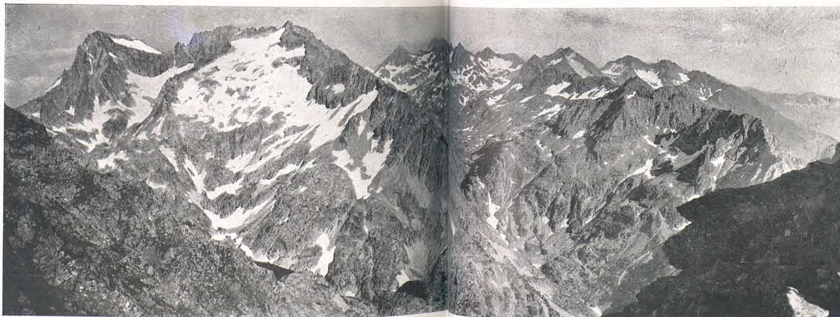
PANORAMA DEL BALAITOUS, ESTANYS D'ARRIEL I CHE DE PIEDRAFITA DES DEL PIC D'ARRIEL