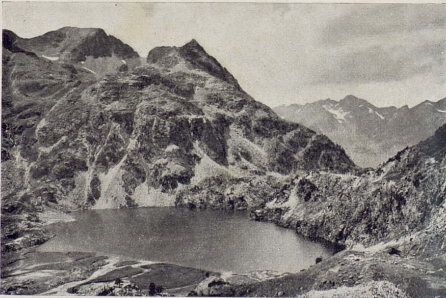
ESTANY RESPUMOSO I MUNTANYES D'ARRIEL AL FONS