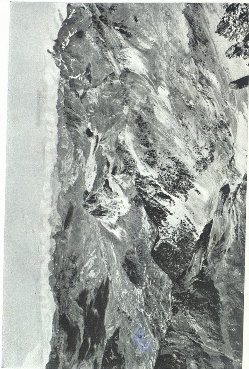
PANORAMA SOBRE SALLENT I LA VALL DEL GÀLEGO