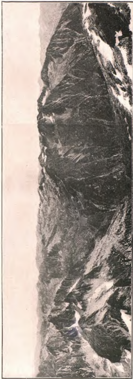
PANORÀMICA DES DEL PIC DE BICIBERRI. MONTARTO D'ARAN I ELS COMOLOS