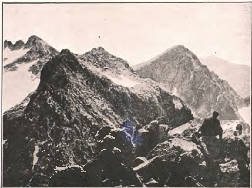
CRESTA DEL BICIBERRI MERIDIONAL