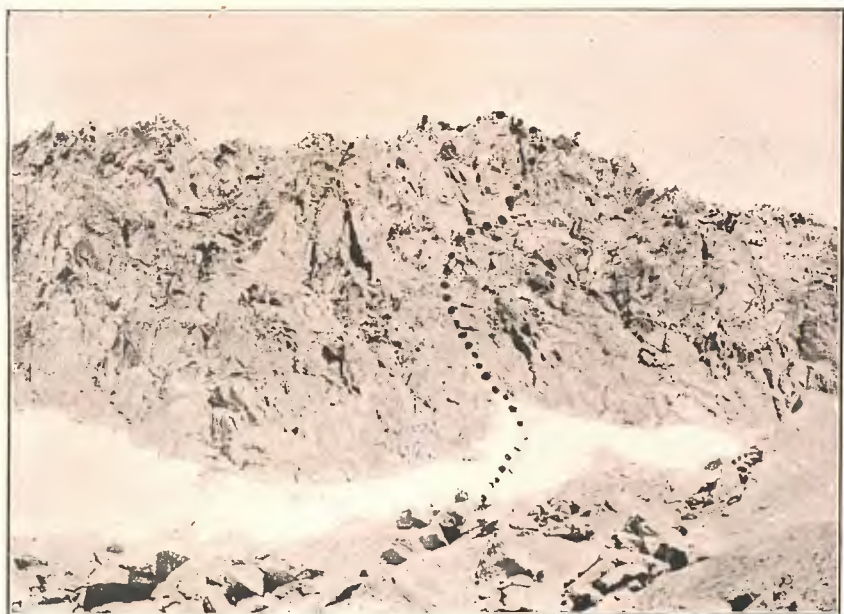
CRESTA SUPERIOR DE BICIBERRI