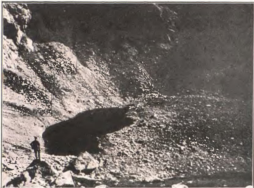
ESTANY SUPERIOR DE BICIBERRI