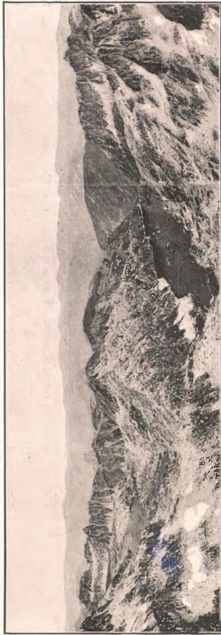
PANORÀMICA DES DEL PIC DE BICIBERRI. ESTANYS DE RIUS I DE MAR