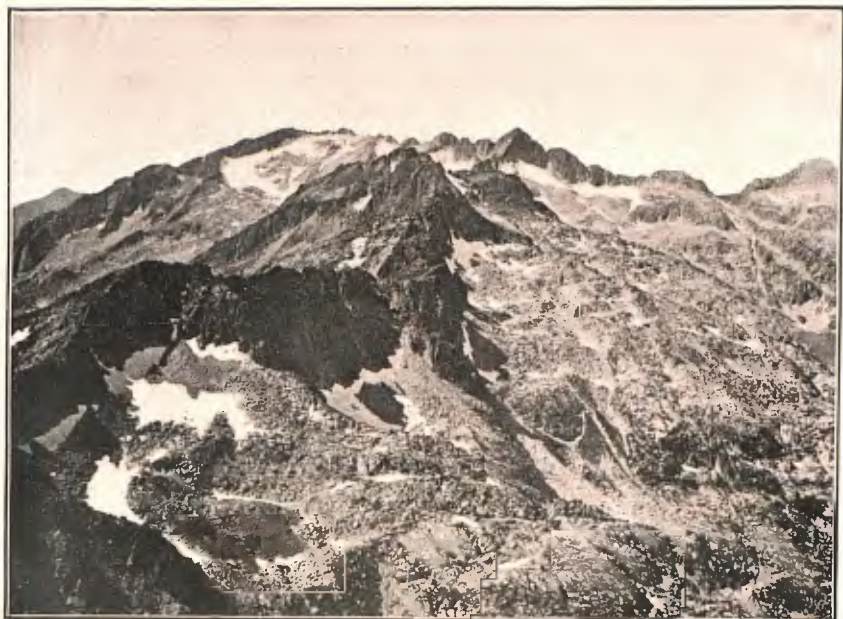
EL PIC DE BICIBERRI, DES DE MONTARTO D'ARAN