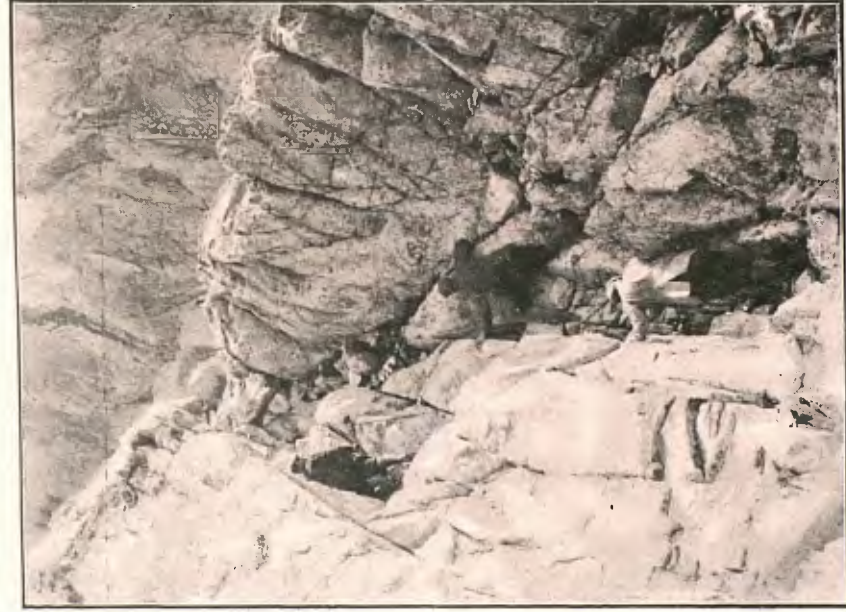
ESCALANT EL PIC DE BICIBERRI