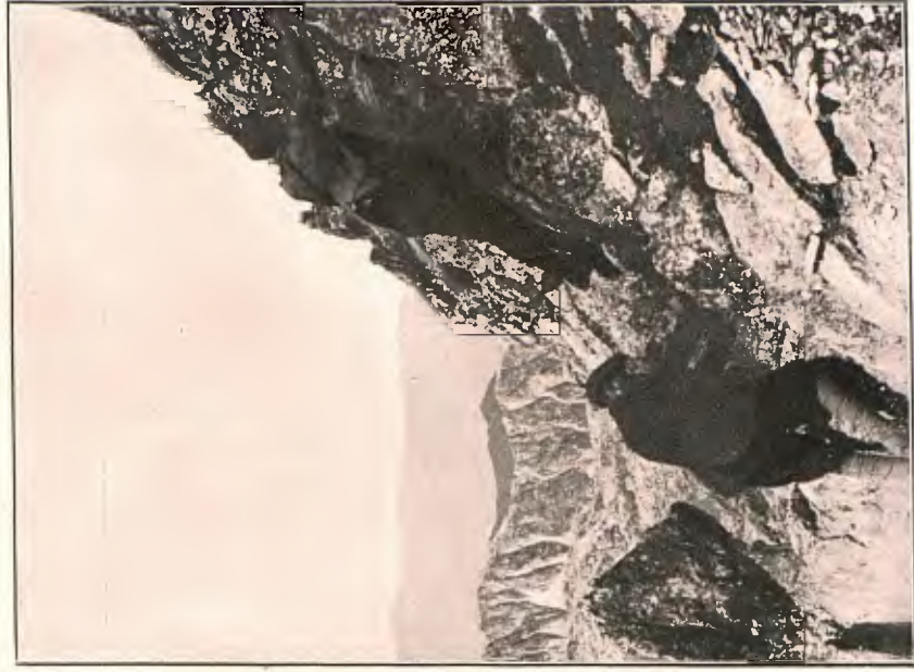
ESCALANT EL PIC DE BICIBERRI