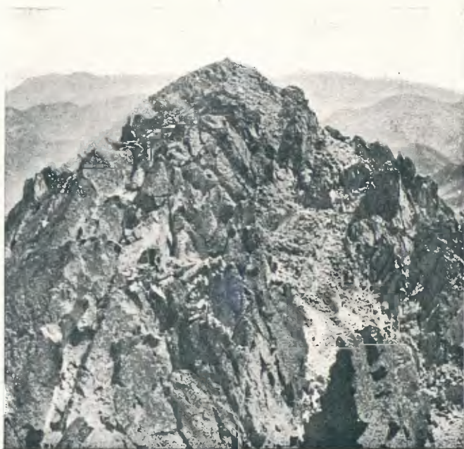
Pic i cresta Russell (pàg. 247)