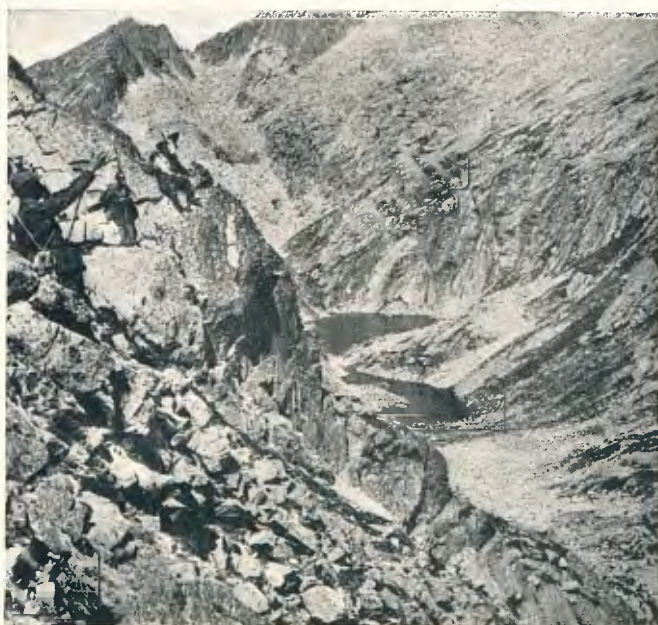
Estanys de Llosàs (pàg. 244)