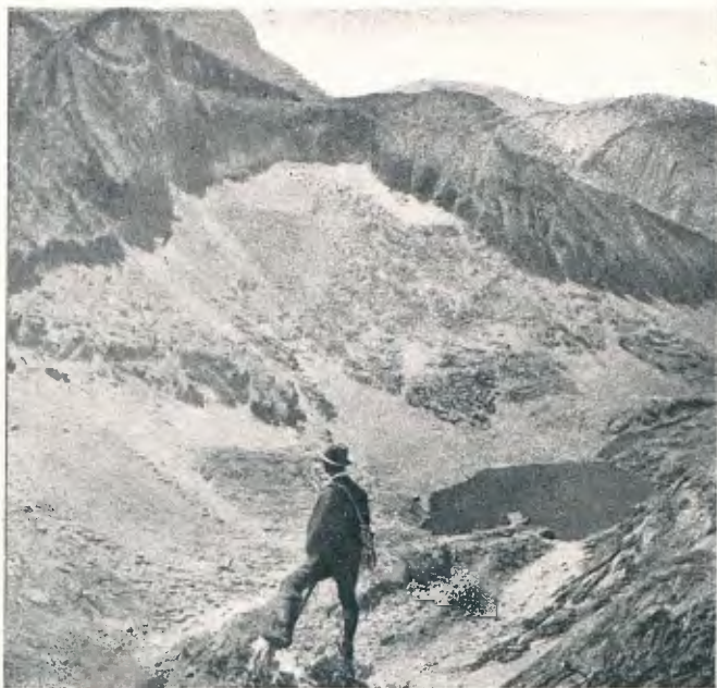
Cl. I. Canals Estany del camí del port de Vallhibierna i parets del pic d'aquest nom (pàg. 245)