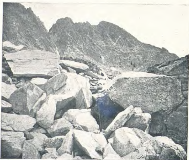
Bretxa i pic de les Tempestats des dels morens de la gelera del mateix nom (pàg. 264)