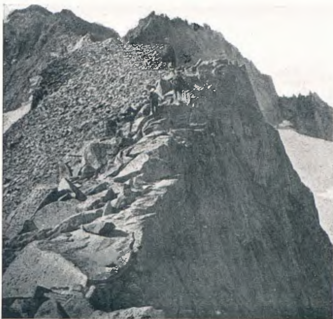
En camí vers la bretxa de Russell Cl. I. Canals (pàg. 248)