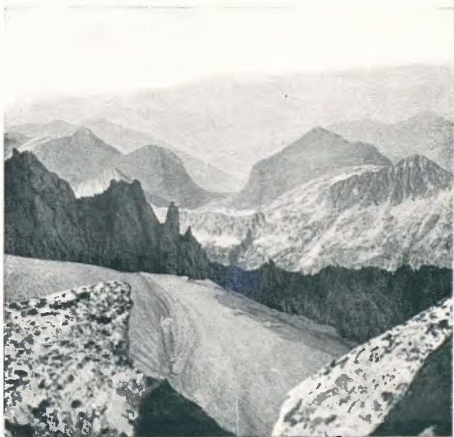
Des de la bretxa de Russell mirant vers la Vall d'Aran (pàg. 248)