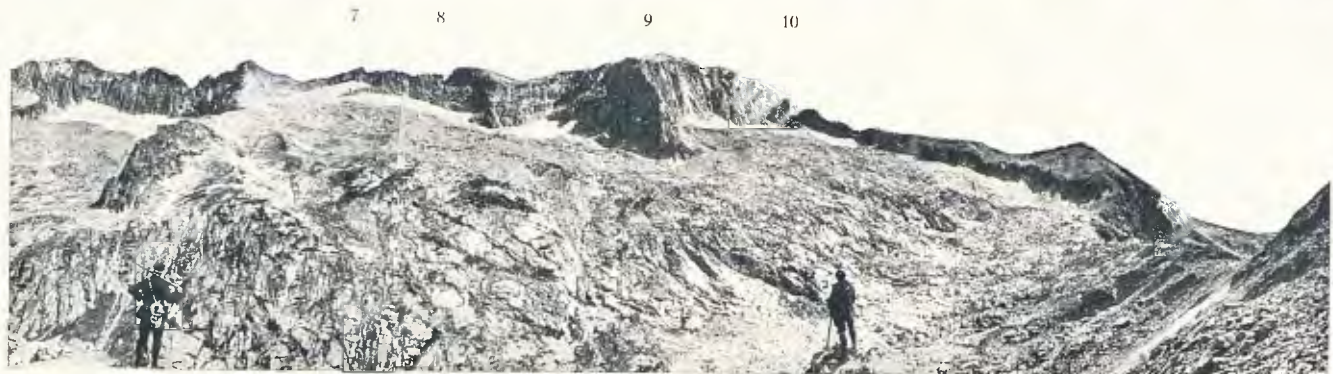
1. Vall de Vallhibierna. 2. Pic de Posets.