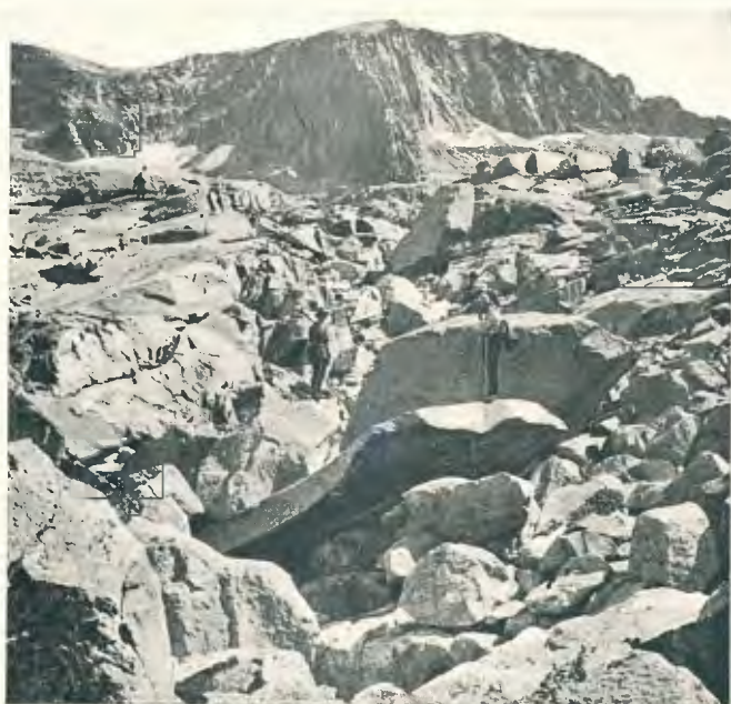
La taritera vers al pic Russell (pàg. 245)