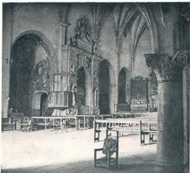
Situació del sepulcre d'En Ramon Folch de Cardona en l'església parroquial