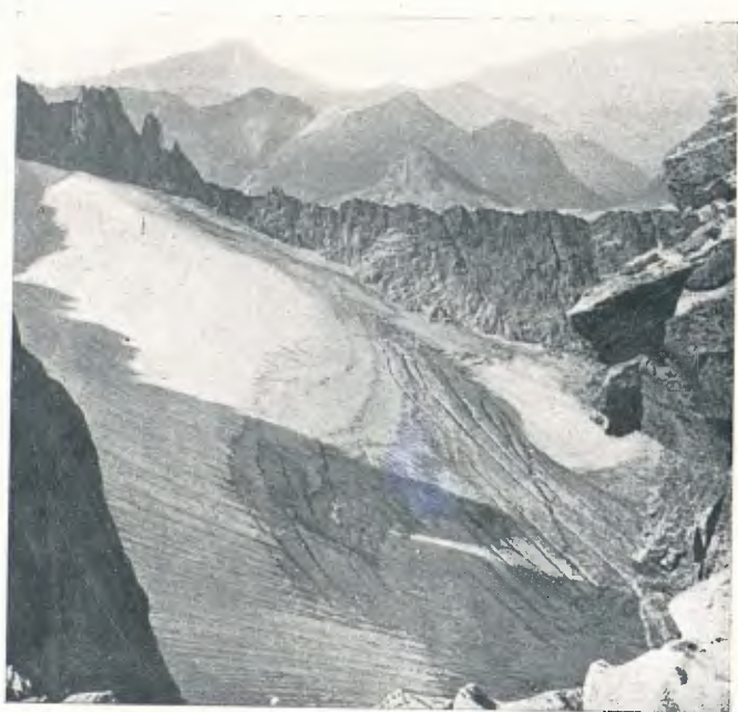
Cl. I. Canals La gelera de les Salenques des de la bretxa de Russell (pàg. 248)