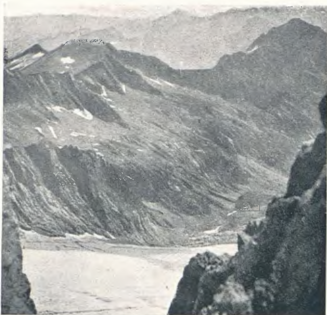
Cl. I. Canals Pic de Mulleres i de Feixants des del coll Margalida (pàg. 249)