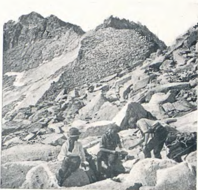
Un dinar a 3,000 metres sota el tallant de l'aresta (pàg. 248)