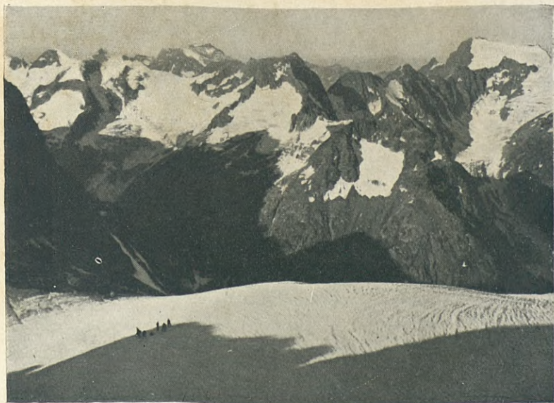
CL. LL. ESTASEN