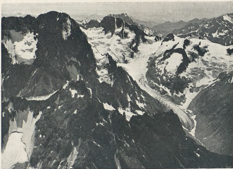
L'AILEFROIDE I ELS BANS