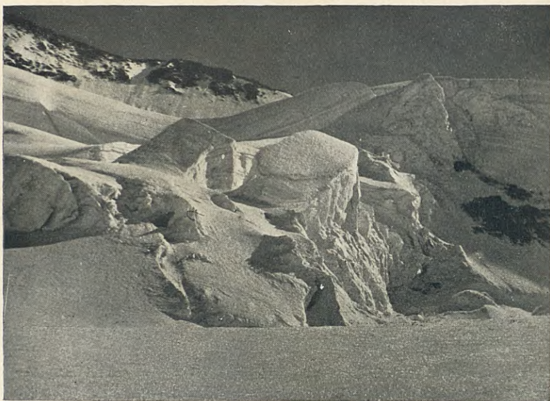
SÉRACS DEL GLACIER BLANC