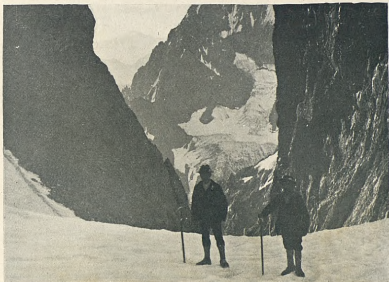
COLL des Avalanches