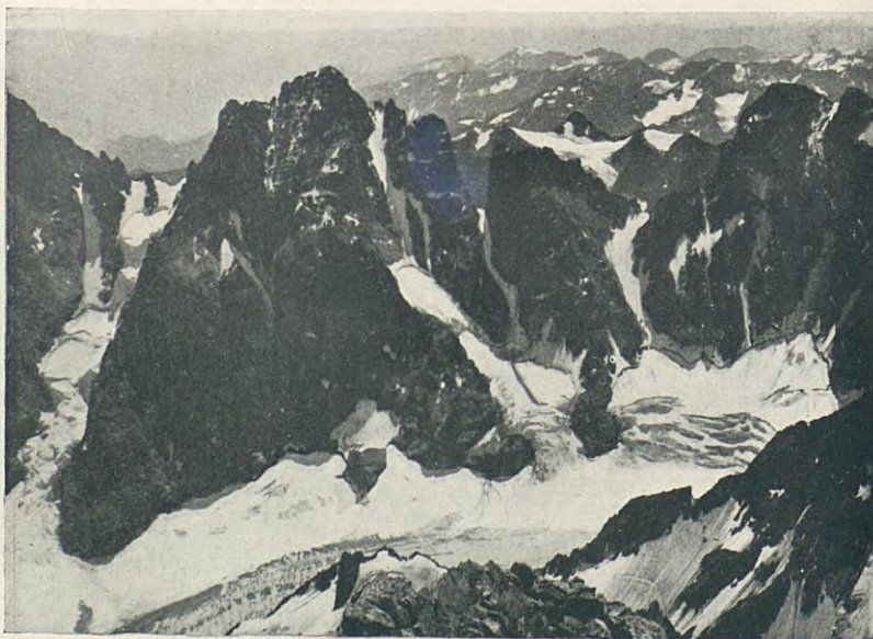
C.S. LL. ESTADEN