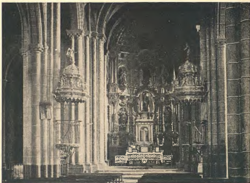
ESTELLA : INTERIOR DE L'ESGLÉSIA DE SANT MIQUEL