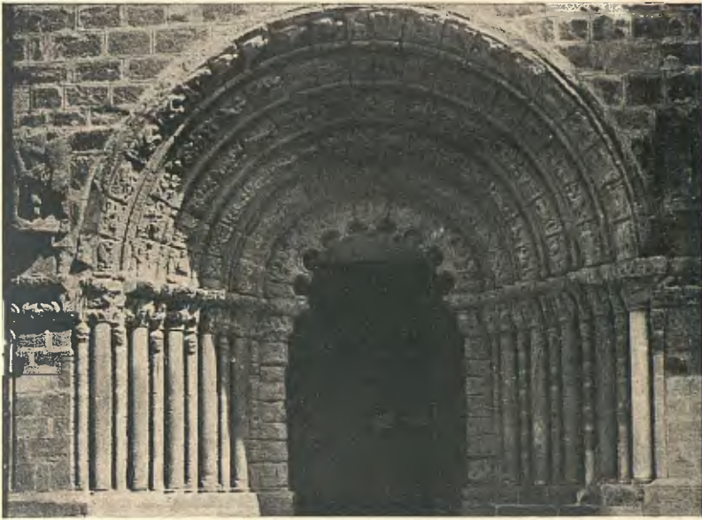
PUENTE LA REINA : PORTA DE L'ESGLÉSIA DE SANTIAGO