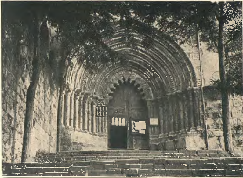
ESTELLA : PORTA DE L'ESGLÉSIA DE SANT PERE LA RUA