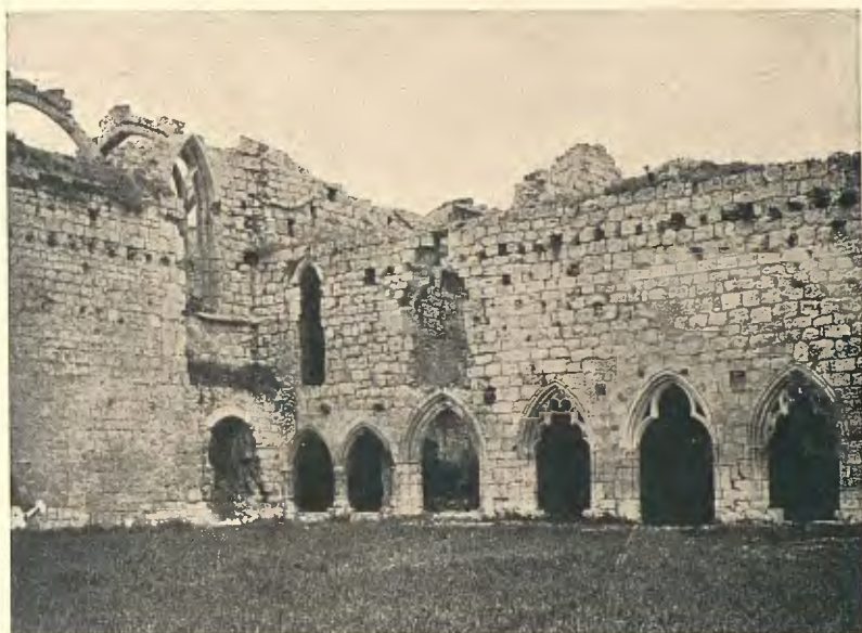
ESTELLA : RUÏNES DEL CONVENT DE SANT DOMÈNEC