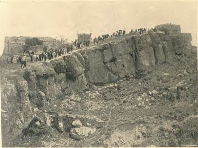
II APLEC EXCURSIONISTA DE LES COMARQUES TARRAGONINES