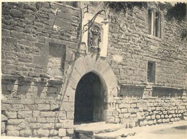
SANGÜESA : RESTES DE L'ANTIC PALAU REIAL, AVUI PRESÓ