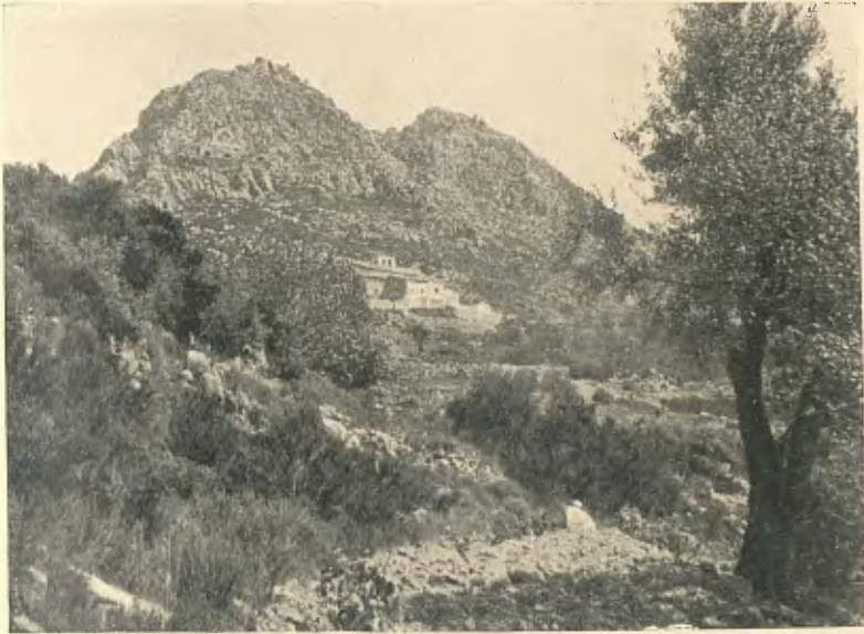
PARRÒQUIA I MUNTANYES DE MONTMELL