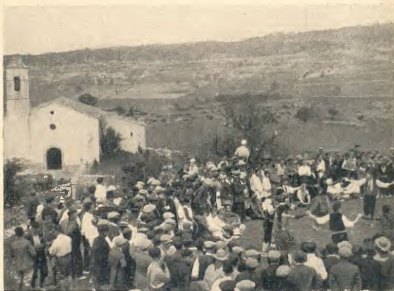
ESGLÉSIA DE LA MUSSARA