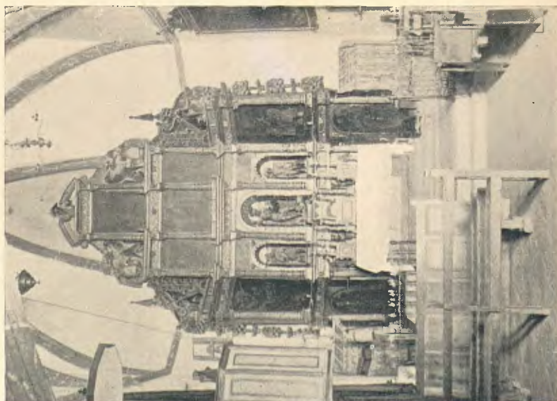
ESGLÉSIA DE MONTMELL