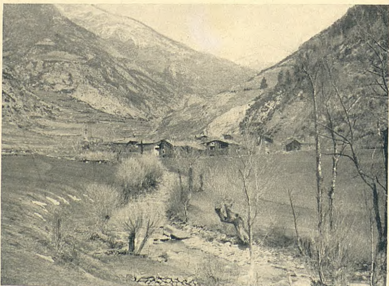
VALL D'ORDINO : LA CORTINADA