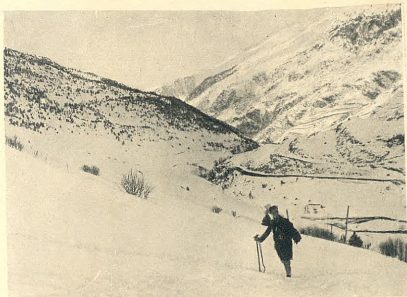
VALL DEL BALIRA PROP DE SOLDEU - AL FONS, EL MASSÍS DE CASAMANYA