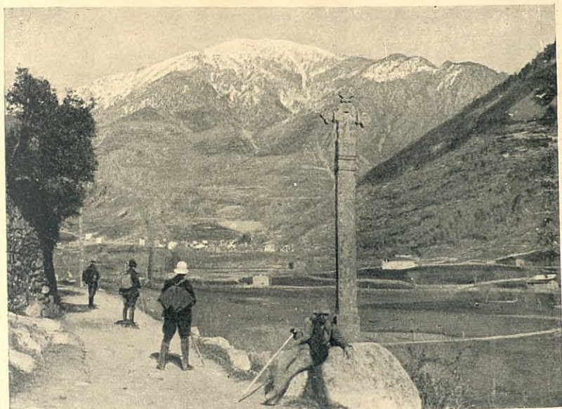
CREU DE TERME D'ANDORRA LA VELLA AL FONS, LES ESCALDES I SANT MIQUEL D'ANGULASTERS