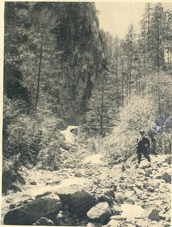
CAMÍ DEL COLL DE PENDÍS