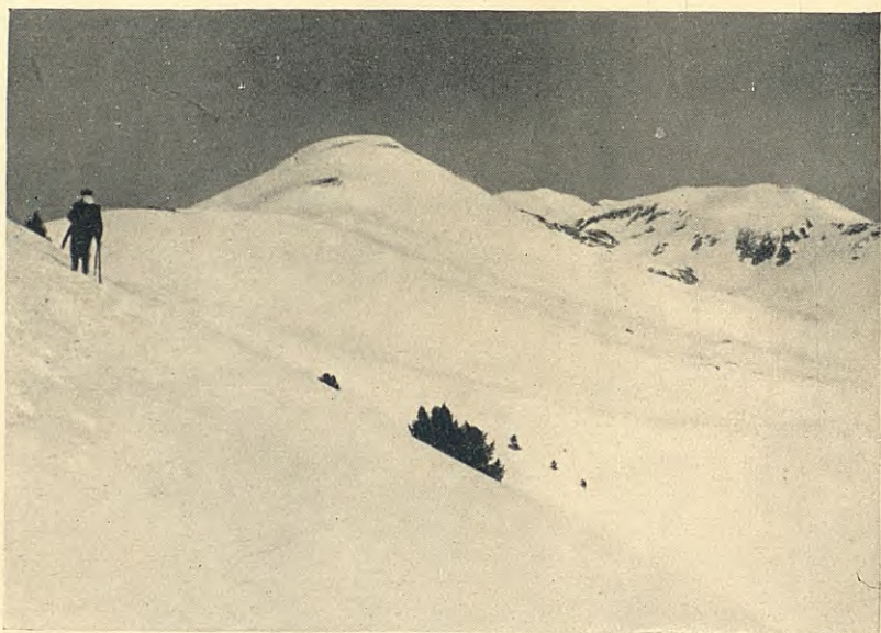
MUNTANYA DE CASAMANYA