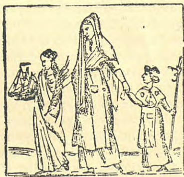
Les pelegrines de Santa Madrona