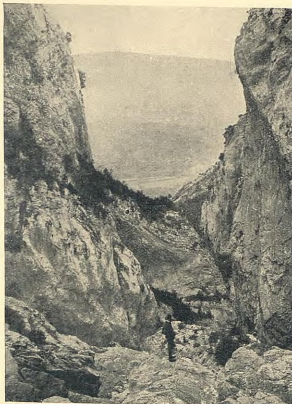
EL FORAT DE PENDÍS