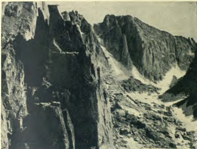
ELS BASIEROS DES DE LA CRESTA S.