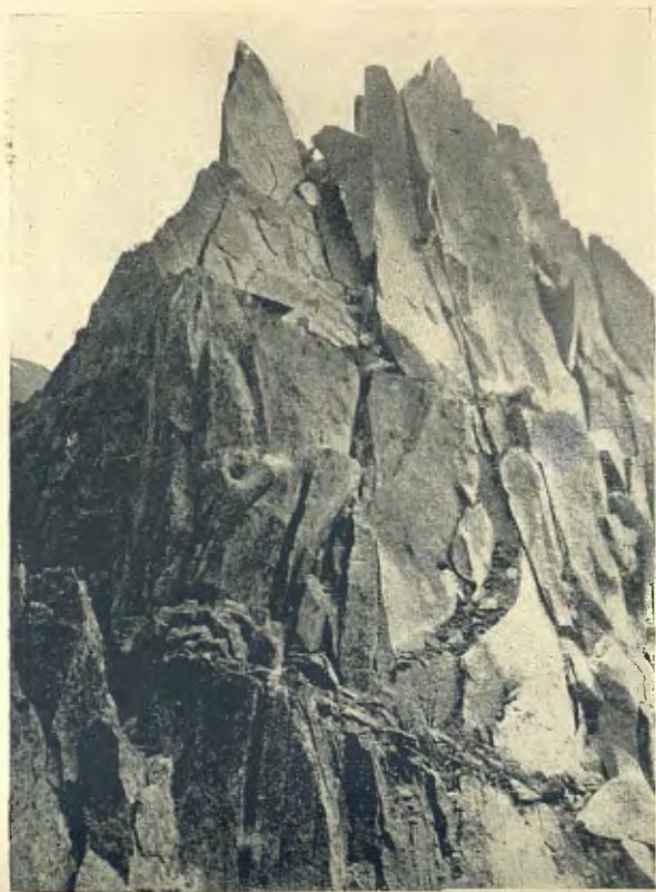
UN DELS CIMS DE LES AGUDES