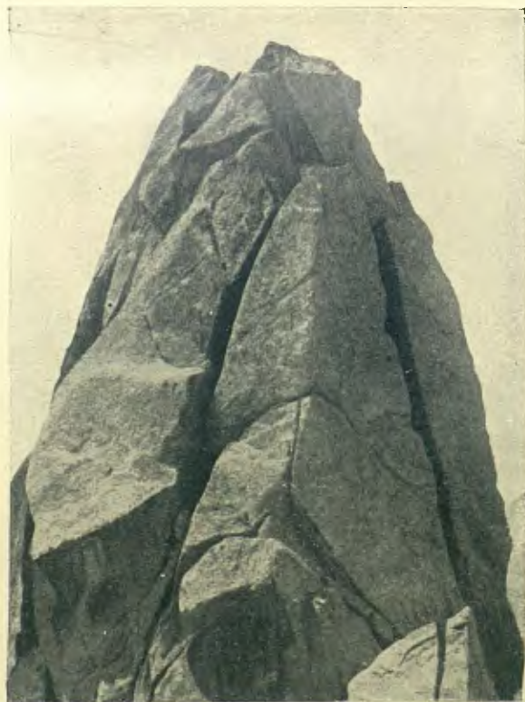
CRESTA S. DEL BASIERO : LA PUNTA DE SAGETA