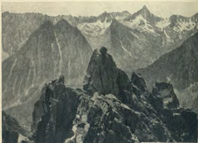
EN LA CRESTA S. DEL BASIERO