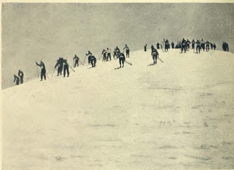
OI. J. M. Eux