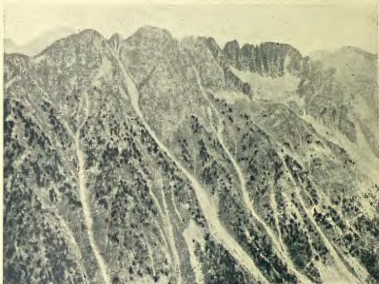
LES AGUDES DES DELS ENCANTATS