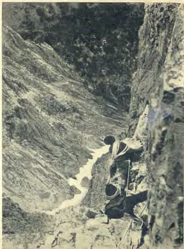
ENCANTATS: PARRD S. PAS DE L'ESCALA