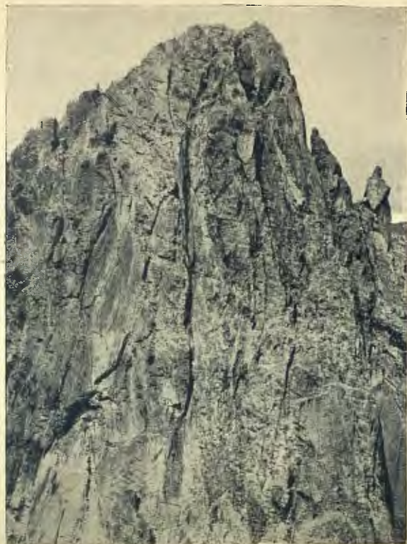
Alt. 31. 000m.