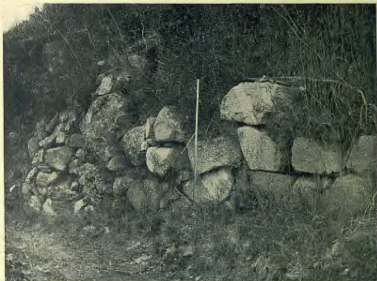
RESTES DE MURALLA ROMANA