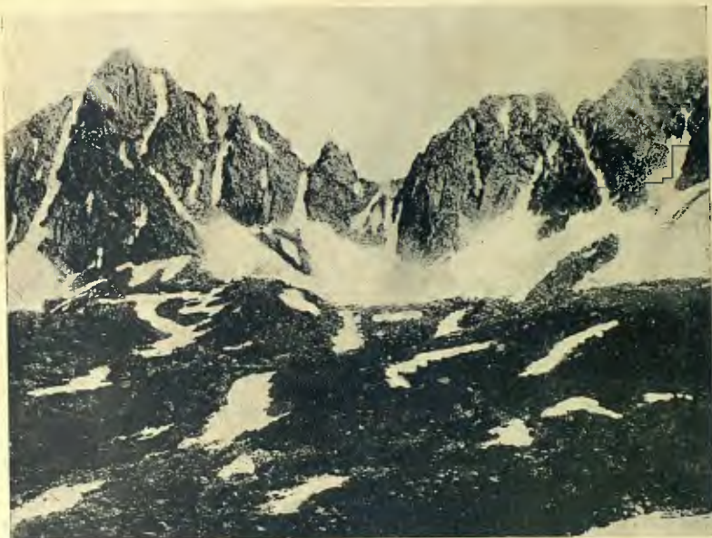
LA PEYRAFORCA : VESSANT NO.