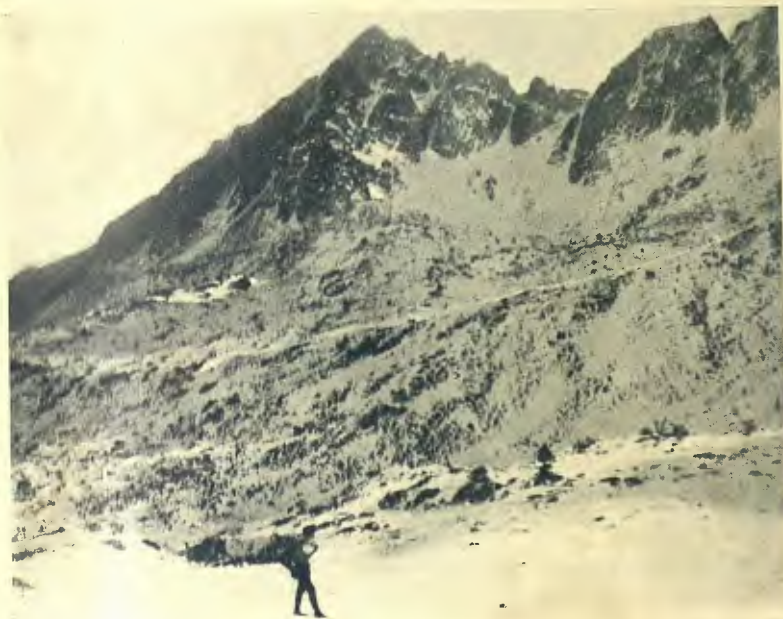
Obs. J. Ulthoff