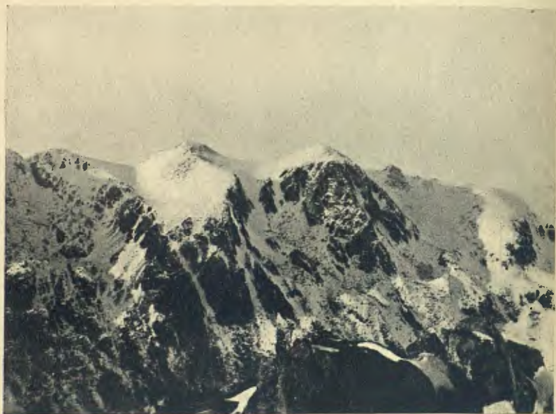
CARENA DE FONTNEGRA DES DEL CIM DE LA PEYRAFORCA