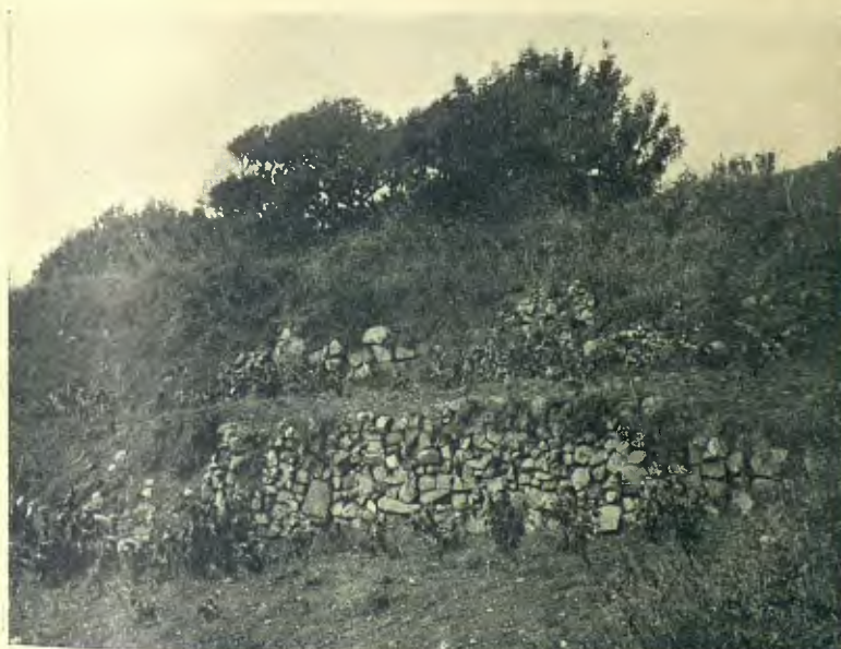
RESTES ROMANES : VISTA PARCIAL DELS MARGES