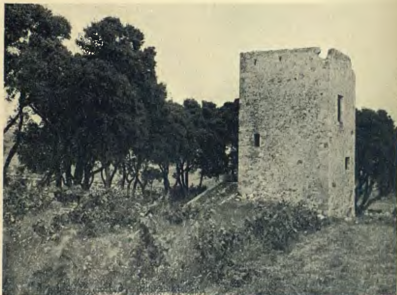
SANT POL DE MAR : TORRE DE LA MARTINA