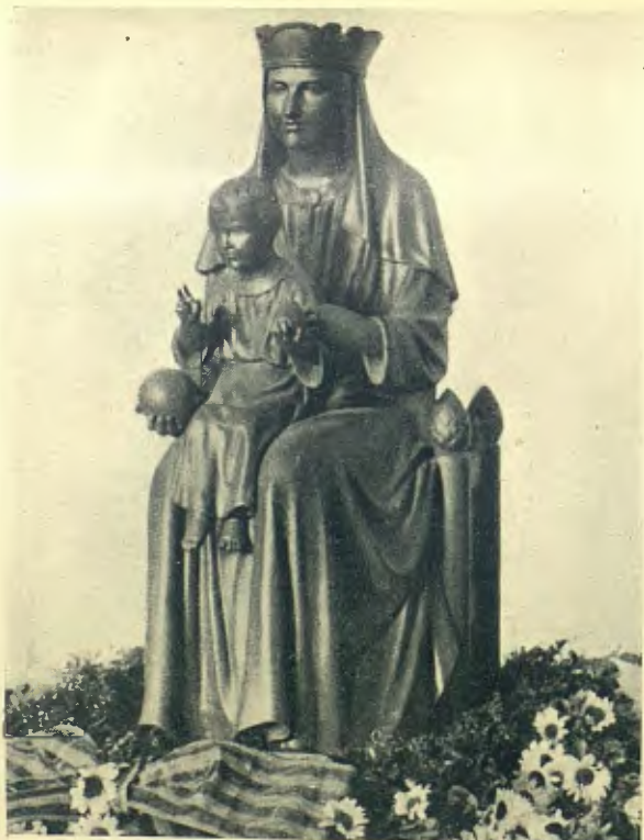
Cl. Ll. Olivella

IMATGE DE LA VERGE DE MONTSERRAT QUE ES VENERA A LA CAPELLA DE LA MOLINA