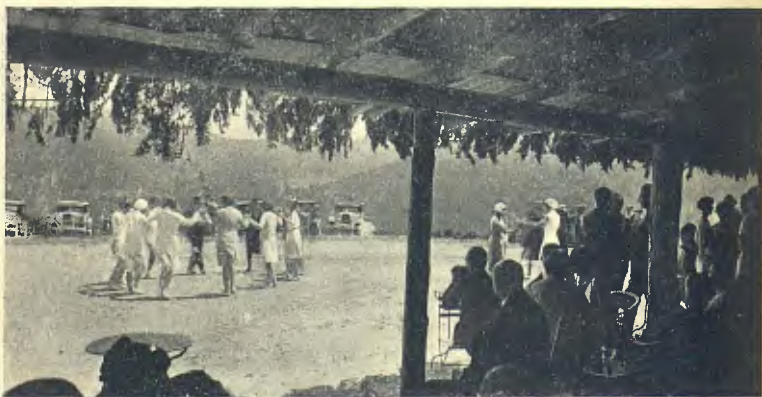
PROCESSÓ CELEBRADA A LA MOLINA AMB MOTIU DE LA BENEDICCIÓ DE LA IMATGE DE LA VERGE DE MONTSERRAT