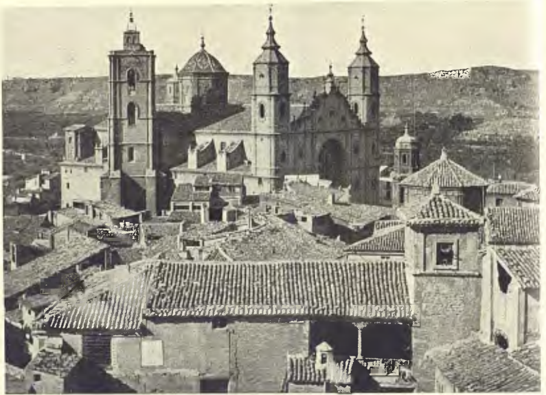
ALCANIÇ. EX-COL·LEGIATA DE SANTA MARIA