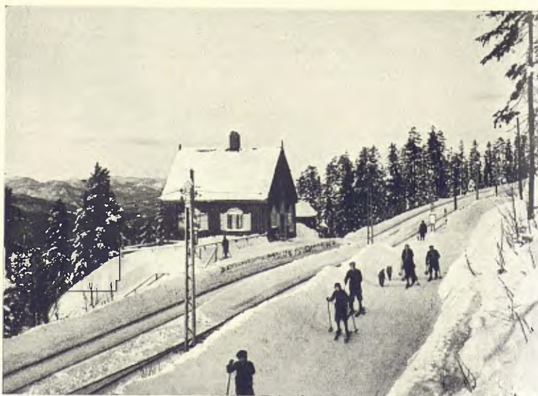
NORUEGA. TORNADA DE LES PISTES