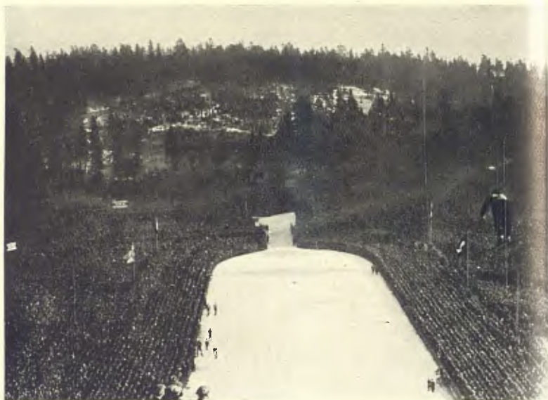
NORUEGA. EL GRAN TRAMPOLÍ D'HOLLMENKOLLEN EL DIA DEL CONCURS DE SALTS