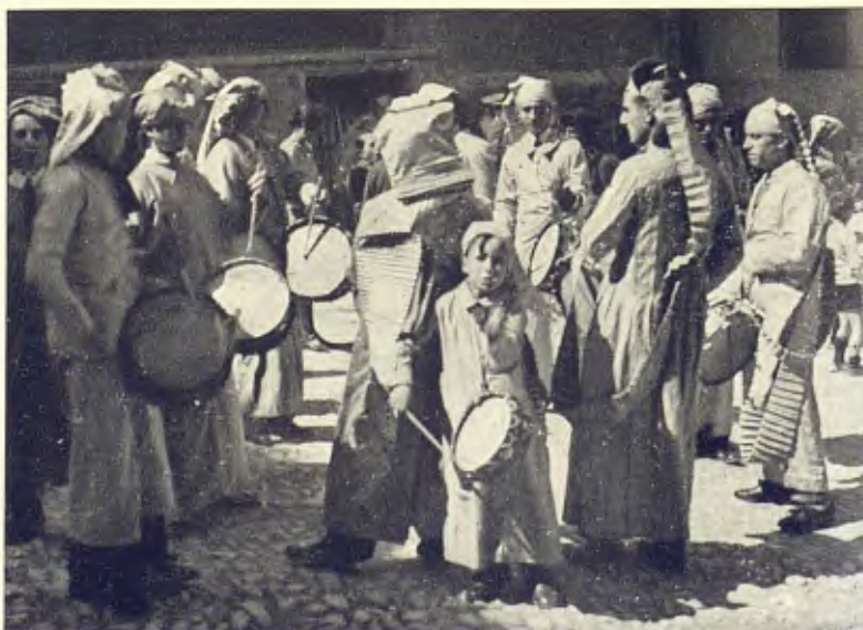
ALCANIÇ. GRUP DE TIMBALERS