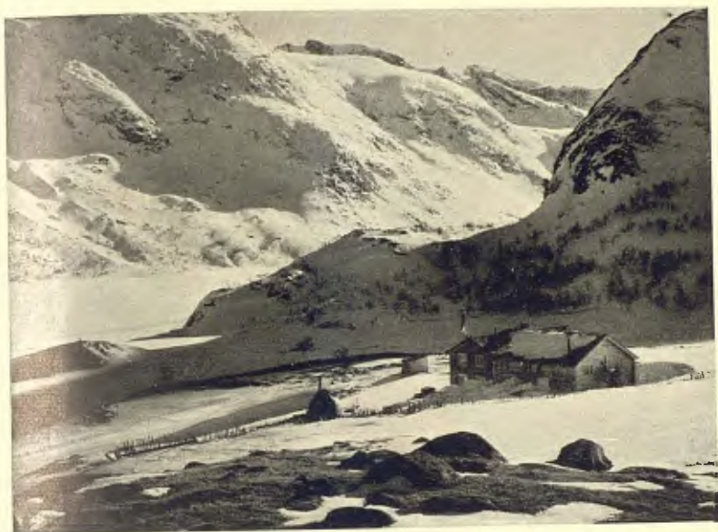
NORUEGA. LA VALL DE JOBINHEIMEN