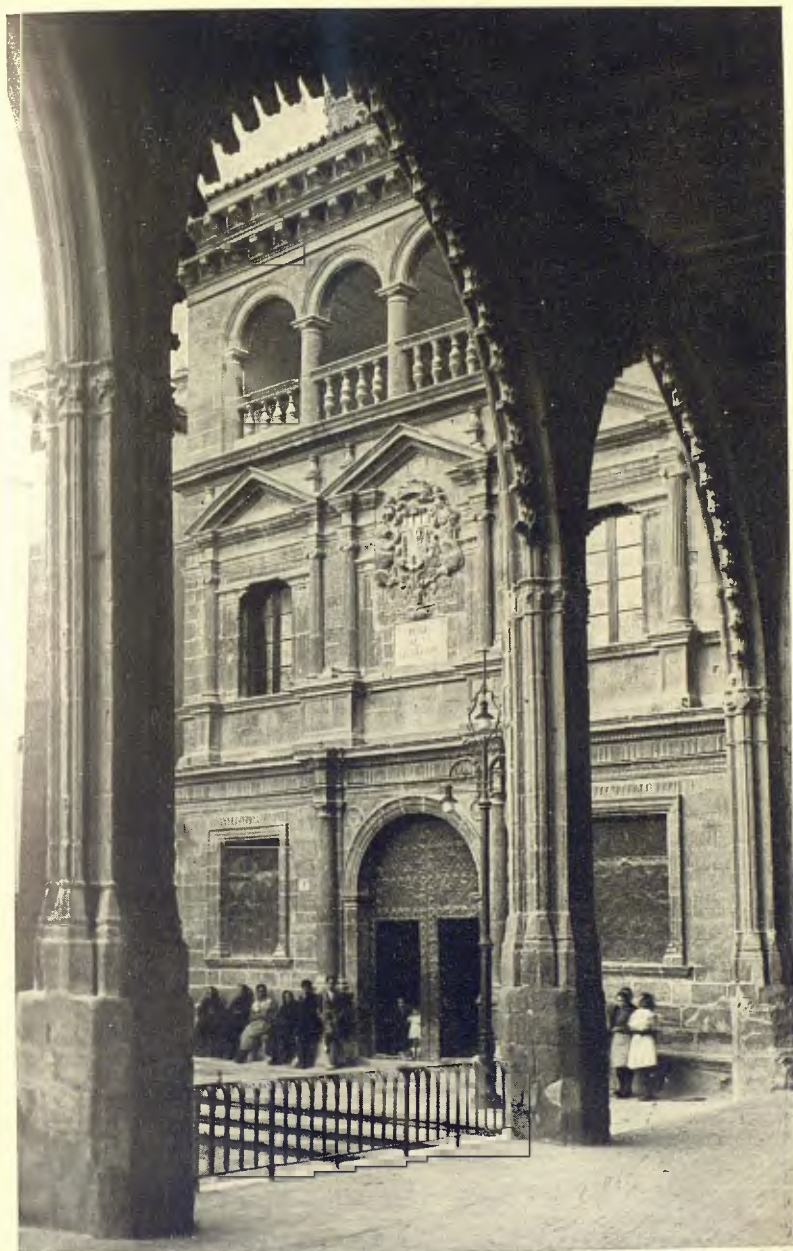
ALCANYIÇ. LOGIA DE L'ANTIGA CORT I CASA DE LA CIUTAT