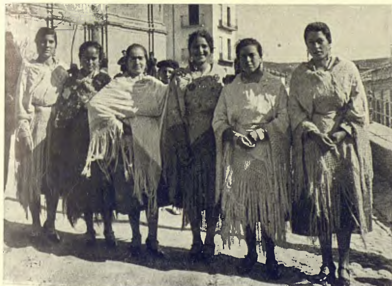
ALCANYIÇ. GRUP D'HORTOLANES