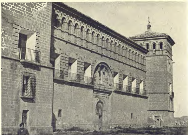
ALCANIÇ. FAÇANA DEL PALAU DEL CASTELL