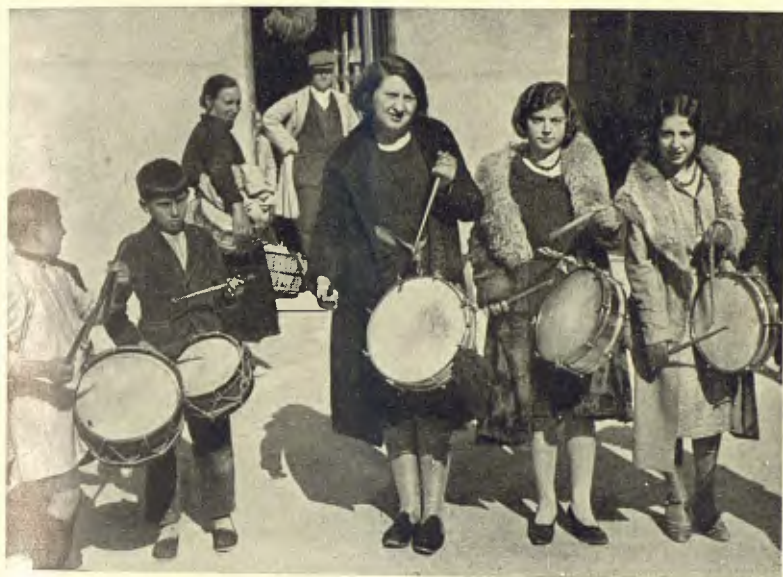
ALCANYIÇ. ALTRE GRUP DE TIMBALERS