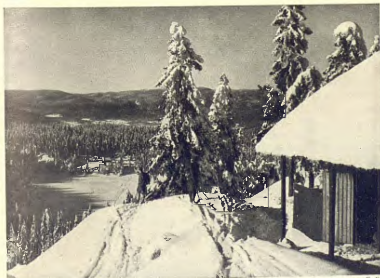
NORUEGA. LES PISTES DE NORDMARKEN