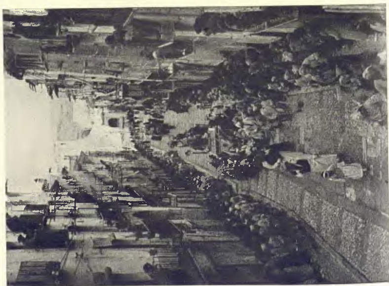
ALCANYIC. PROCESSÓ DEL SANT ENTERRAMENT