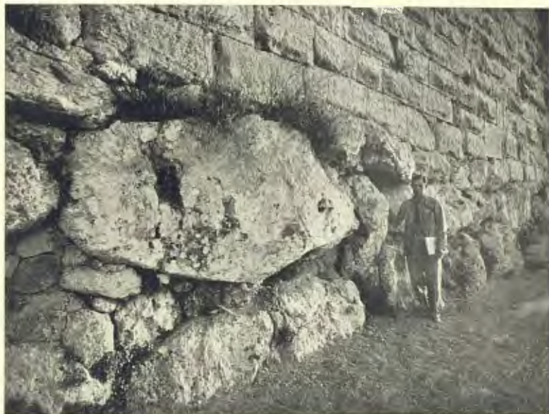
TARRAGONA: MURALLA ENTRE LES TORRES DE L'ARQUEBISBE I DEL CAPÍSCOL