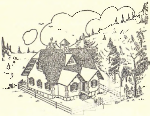
Refugi dels Rasos de Peguera

L'edifici està compost de dos pisos; es destina la planta a salamenjador amb llar de foc i estufes, cuina, serveis higiènics, guarda esquís, i un petit dormitori per a dames. En el primer pis són situades les restants lliteres, amb un total de llocs per a unes seixanta persones. Està prevista també la instal·lació de calefacció,