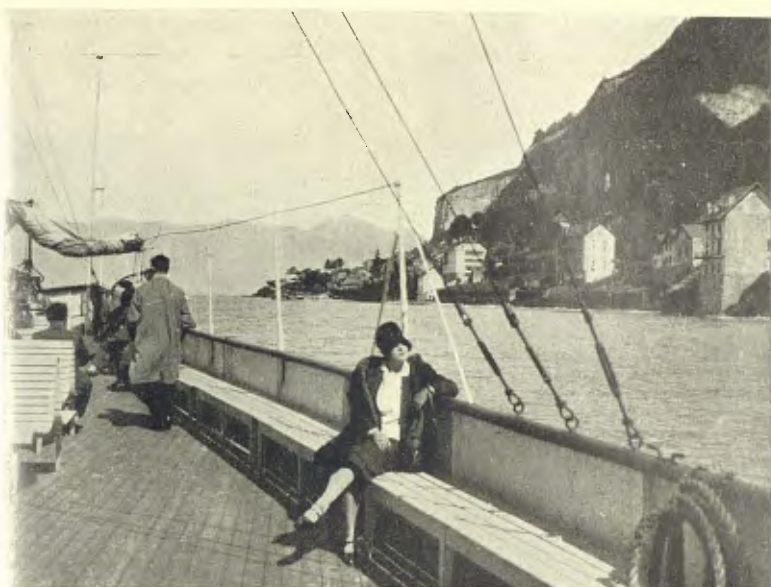
SUISSA: LLAC LÈMAN. SANT GILGOLF (FRONTERA FRANCESA)