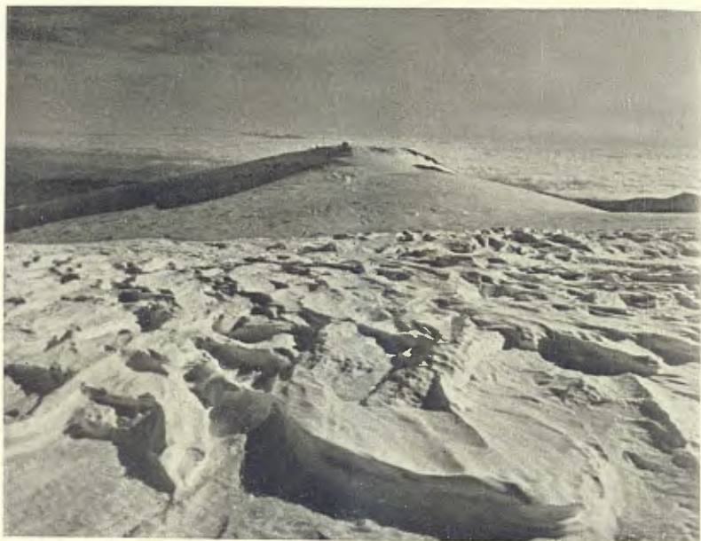
EFFECTES CARACTERÍSTICS DEL VENT SOBRE LA NEU ENDURIDA