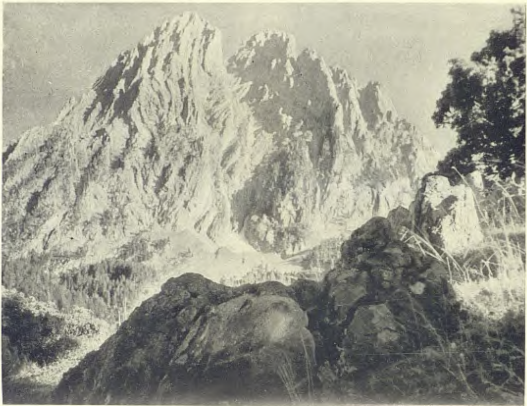
ELS ENCANTATS DES DE SANT MIQUEL