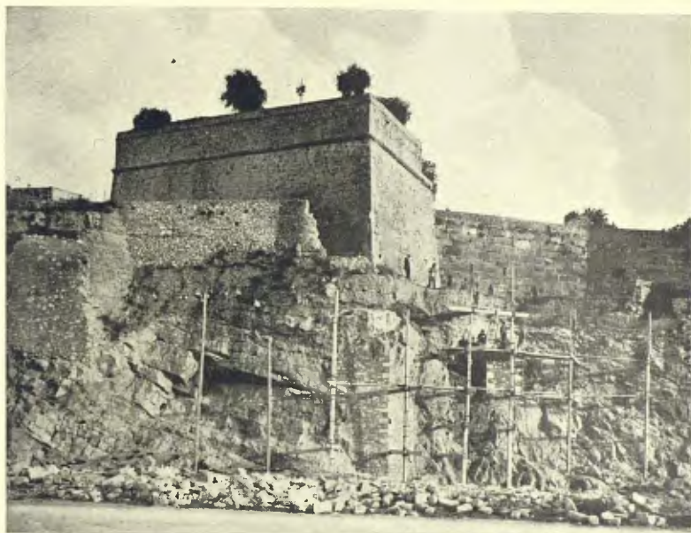
TARRAGONA: PEDRERA, AMB L'EXPLOTACIÓ DE LA QUAL ES DESTRUÍ, EN 1900, EL PAS A LA «FALSA BRAGA»