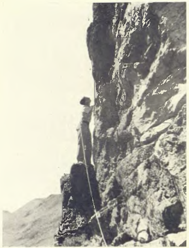
ENVIANT DEL ROC COLOM