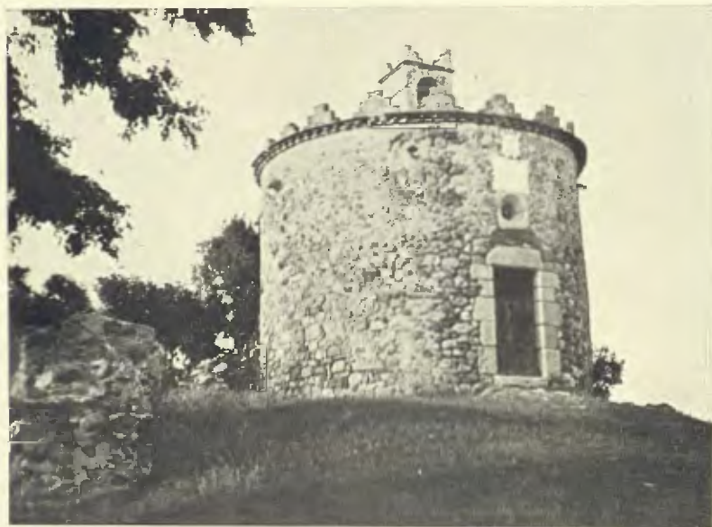
L'ESGLÉSIOLA RODONA DE SANT PERE DE BELL-LLOC