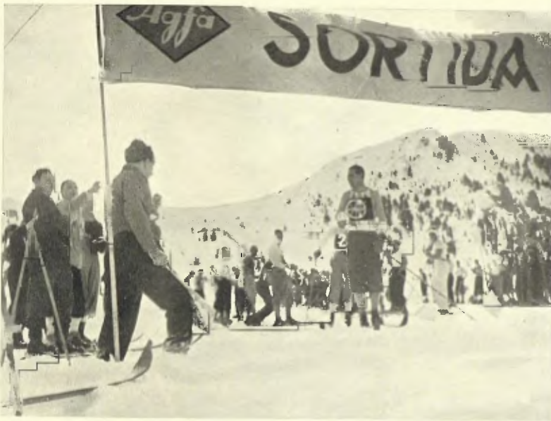
SORTIDA DELS CORREDORS EN LA CARRERA SOCIAL EN EL XXV o ANIVERSARI DE LA SECCIÓ D'ESPORTS DE MUNTANYA