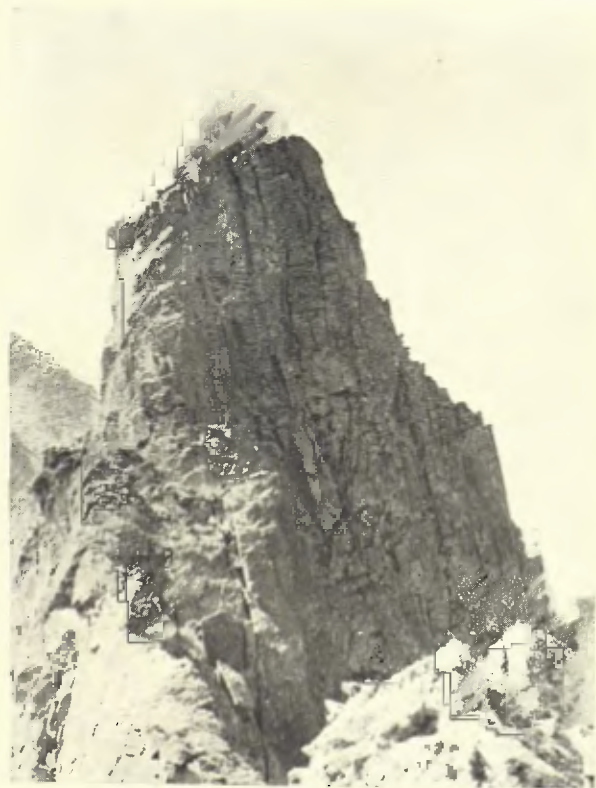
EL ROC COLOM