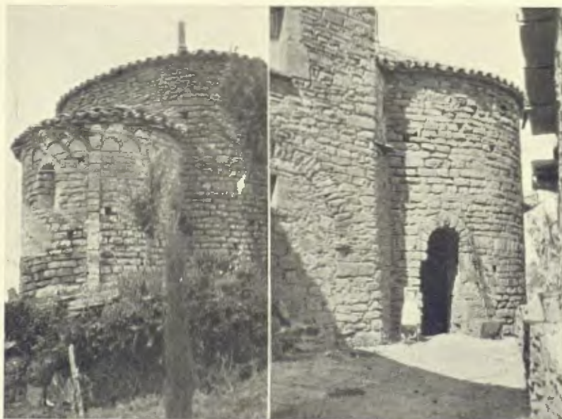
Obs. J. Domenech Mansana