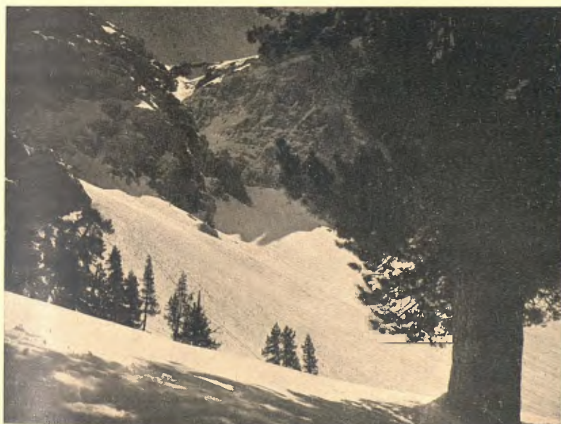
SERRA DEL CADÍ, SOTA LA CANAL BARIDANA