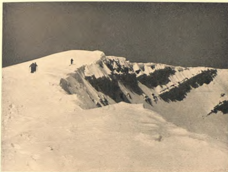
SERRA DEL CADÍ, PROP DE LA CANAL BARIDANA