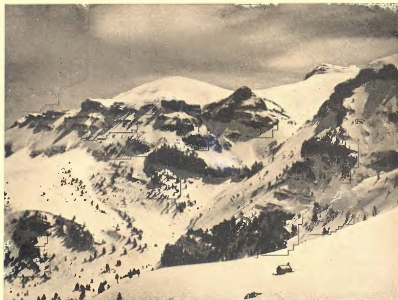
PUIG TARRÉS, PRAT D'AGUILÓ I REFUGI CÉSAR A. TORRAS