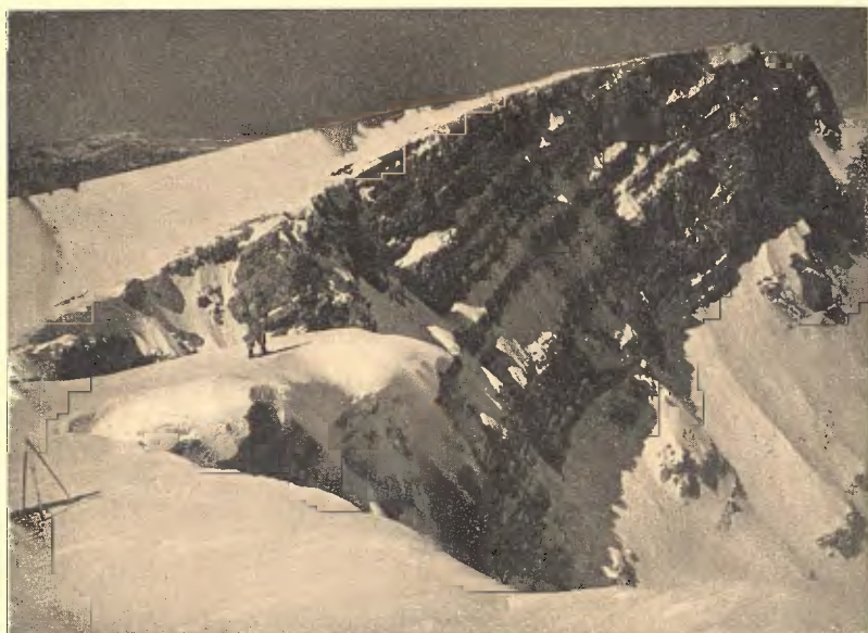
SERRA DEL CADÍ. DETALL