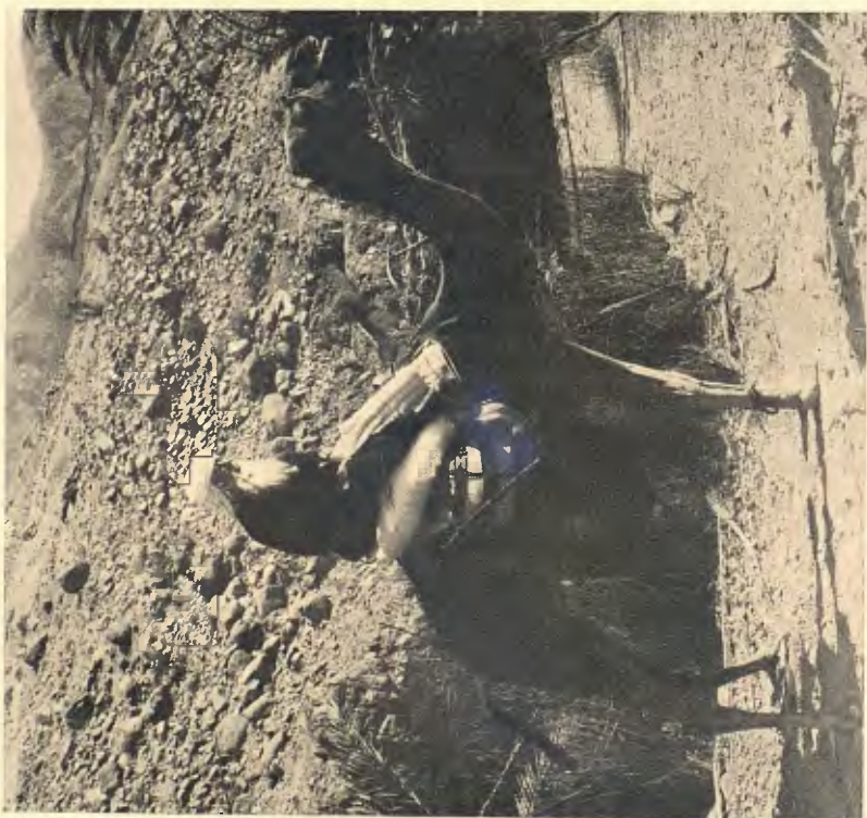
EL NOSTRE MEDALLISTA D'ENQUANY EN UNA DE LES SEVES EXCURSIONS D'ESTUDI