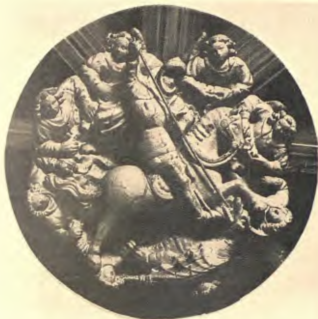
CLAU DE LA CAPELLA DE SANT JORDI DE LA GENERALITAT DE CATALUNYA