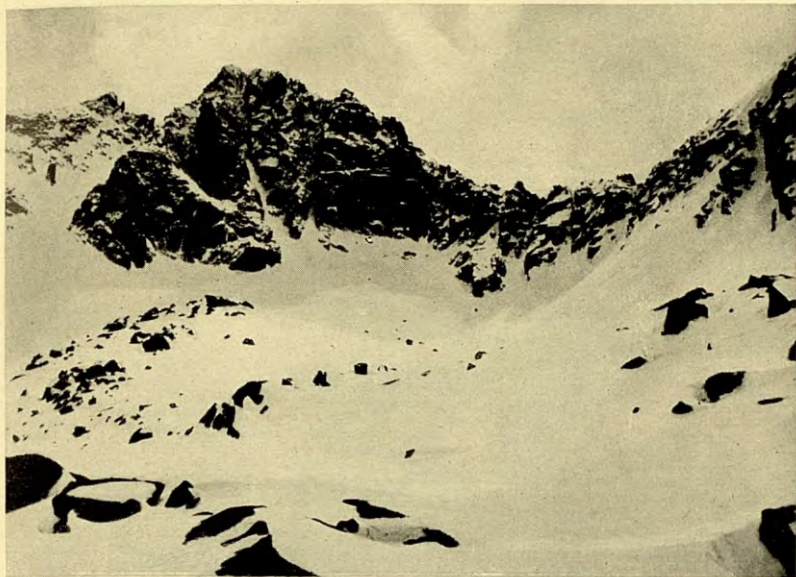
PICS DEL BASIERO ORIENTAL (1) I OCCIDENTAL (2) DES DEL RECLAU AL SE. DEL CERCLE DE GERBÉ