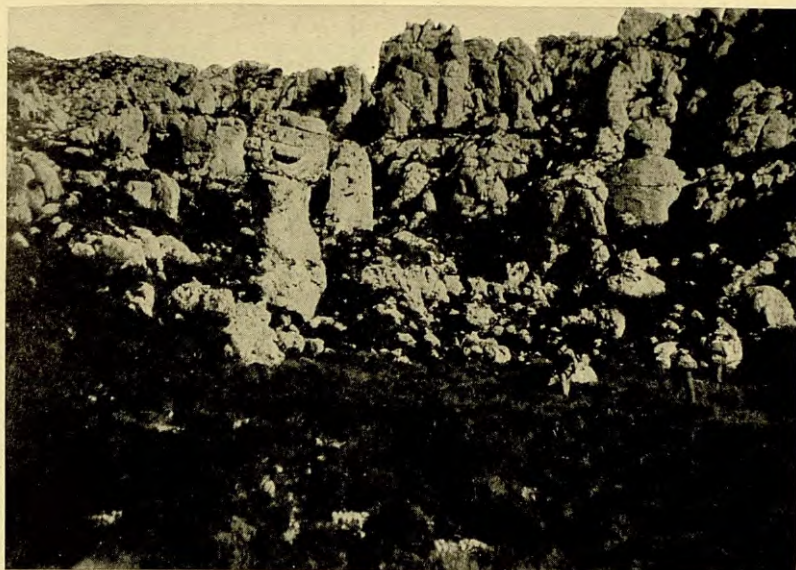
PLA DE L'EURA SOTA EL PILÓ