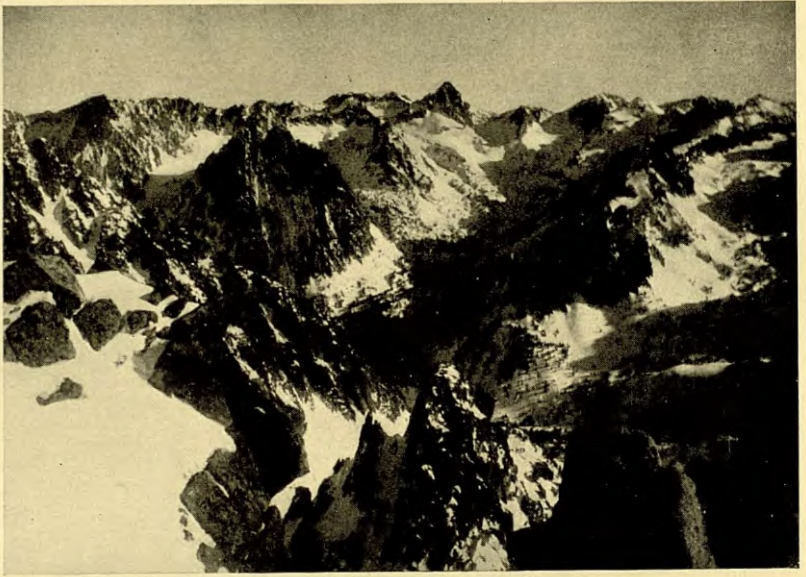
ELS ENCANTATS, EL PIC DE PEGUERA I LA VALL DE MONASTERO DES DEL CIM DEL BASIERO ORIENTAL