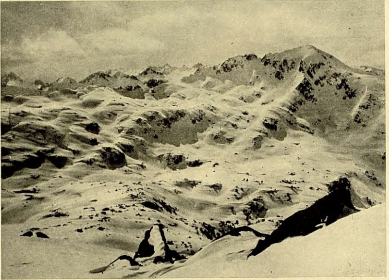
COMOLOFORMO (1), BECIBERRI N. (2) I TUC DE LA SENDROSA (3) I CERCLE DE SABOREDO EN PRIMER TERME, DES DEL COLL AL N. DELS PUIS DE L'ESTANY GERBÉ