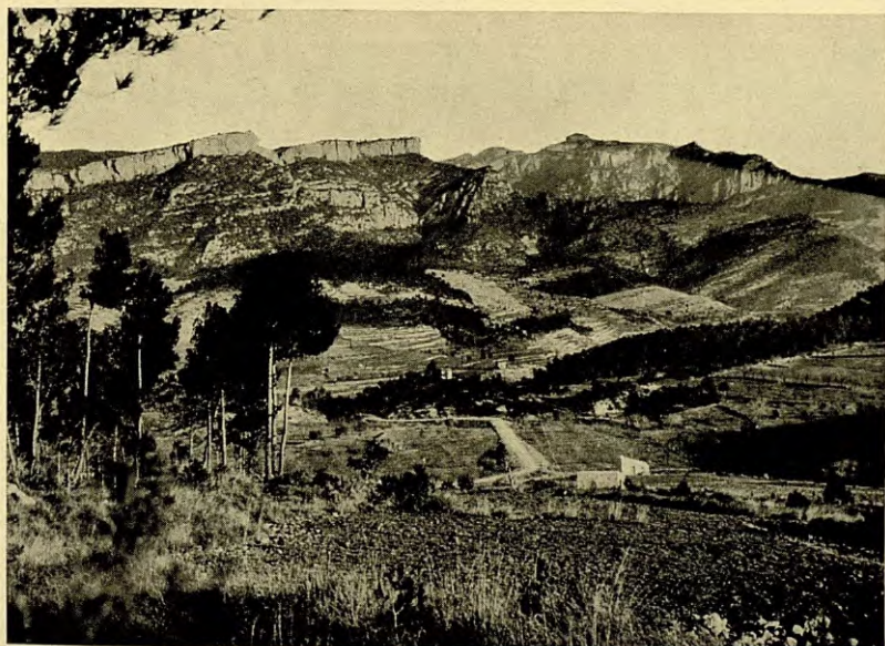
SERRES DE LLEVARIA