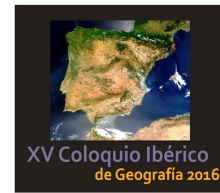
RETOS Y TENDENCIAS DE LA GEOGRAFÍA IBÉRICA

Del 26 al 28 de Octubre 2016 se ha celebrado, en UB, el Simposium de Jóvenes... [±]