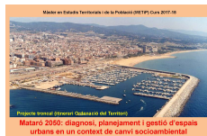
Mataró 2050: diagnosi, planejament i gestió d'espais urbans en un context de canvi socioambiental